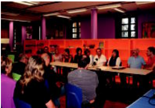
Tolomendiko eta ikastetxeetako ordezkariak, aurkezpenean. ITZEA URKIZU

Tolomendik eta eskualdeko zazpi ikastetxek hitzarmena sinatu dute, ikasleek baratzeak landu eta nekazarien lana «baloratzeko» 02