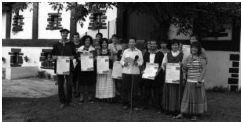
Herriko hainbat eragilek eta udal ordezkariak aurkeztu zuten igandean egingo duten euskal jaiia.

Festa handia igandean da, baina bezperan ere izango da zer ikusia. 17:30ean Urrezko Segapotua Segaxapelketa Herrikoia egin-