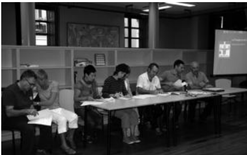
Hitzarmenean parte hartu duten ikastetxeetako zuzendariak, sinadura ekitaldian. I. URKIZU