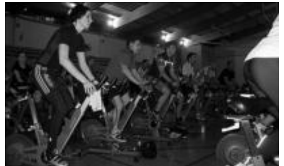
Gazteentzako cycling ikastaroaz gozatu ahalko da aurtun Belabietan. N.L.

Informazioa eskatu edo izena emateko Belabietako kiroldegira (662 125 497 / 657 719 533) jo ahalko da. Pilota ikastaroaren kasuan Sendi Ekintzan (625 707 829) egin beharko da.