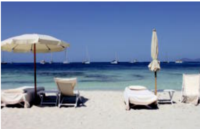
Argazkia Formenterako hondartza batetik ateratakoa da. Bertan lasaitasuna, Mediterraneo itsasoko ur gardenak eta Ibizako mendilerroa ikus daitezke. OINATZ MARTINEZ