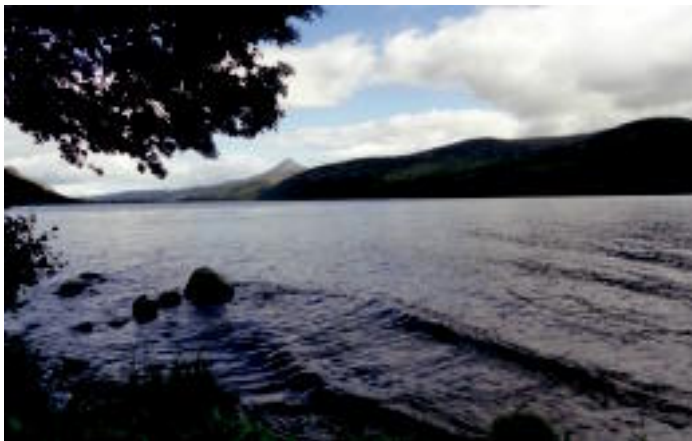
Argazkia Eskoziako lurralde garaietan ateratakoa da. Eskualde menditsua eta lakuez bete da, eta Erresuma Batuko mendirik altuena bertan dago (Ben Nevis). INIGO ZAPIRAIN