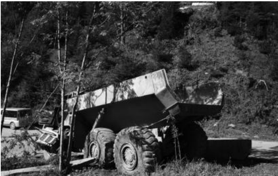
Irudian ikusten den amildegitik behera erori ondoren, horrela gelditu zen kamioia. Gidaria bertan zendu zen. A. IMAZ