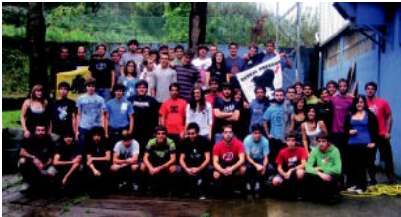
Larunbateko Gazte Egunean parte hartu zuten guztiek argazki bat atera zuten. HITZA