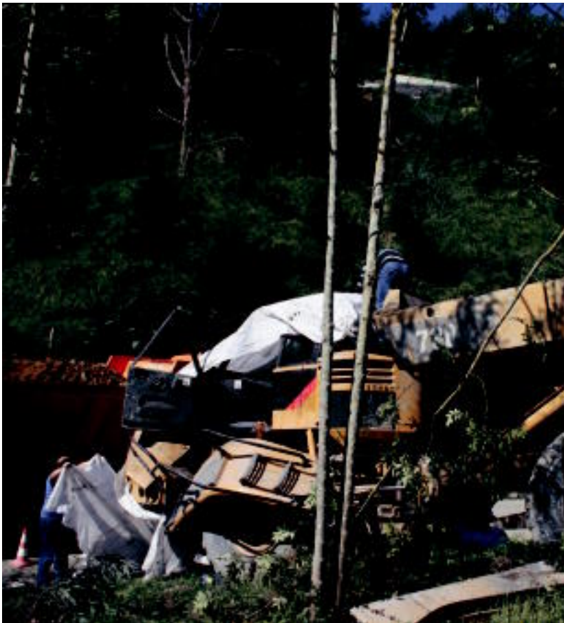
47 urteko langilea amildegitik behera erori zen kamioiarekin, atzo goizeko 04:00etan. A. IMAZ

Lan istripua salatzeko ELA, LAB, STEE-EILAS, EHNE eta HIRU sindikatuak elkarretaratzea deitu dute bihar, 12:00etan, Tolosako udaletxearen aurrean 03