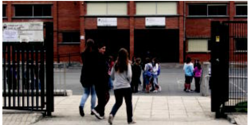
Jolaslekuan elkartzen joan ziren ikasleak, eta txirrina jotzearekin batera barrura sartu ziren, Alegian. E.MAZ

HITZAK ez du bere gain hartzen egunkarian adierazitako esan-nen eta iritzien erantzukizunik.