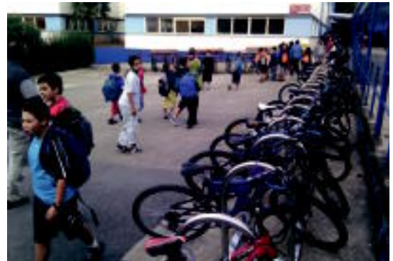
Bi hilabete eta gero, Tolosako ikastetxeek ere bizia hartu dute. I.GARCIA

Gurasoek eta ikasleek alferkeriak alde batera utzi eta eguna indartsu hasi zuten. Gurasoen laguntzarekin gerturatu ziren txikiak. Batzuek lehen eguna izan