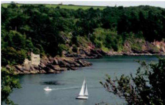
Argazki hau Ingalaterrako hego mendebaldeko Brixham herri arrantzaletik gertu ateratakoa da, Devonon, Ingalaterrako paraje ederrenetarikoa daude bertan dudarik gabe. AGURTZANE LARRAÑAGA