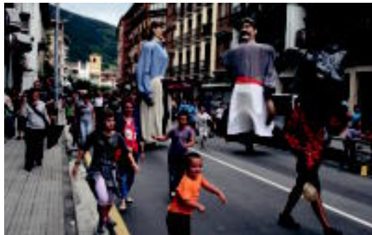
Errebote plazatik atera ziren buruhandi eta erraldoiak. A. MAIZ