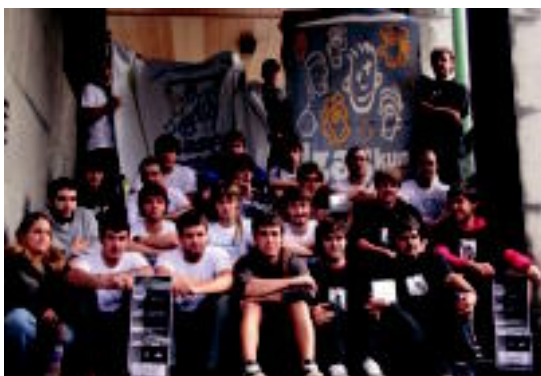
Diskoko aurkezpena, Izaskun jaiak aurkezteko baliatu zuten. I. URKIZU

Bonberenea Ekintzak zigiluarekin kaleratu dute lana; Izaskun auzoko jaietan, irailaren 2an, aurkezpen kontzertua eskainiko dute ◦2