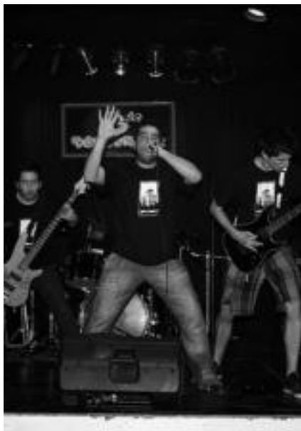
Ezkerrean, aurkezpen prentsaurrekoa eta eskuinean, Sputnik 11 ren zuzeneko aurkezpen kontzertua.