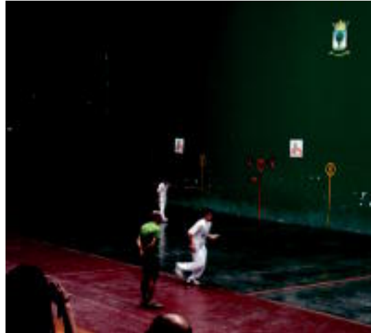
Larunbat arratsaldeko partidako une bat.