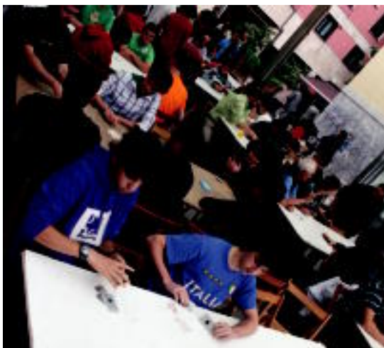
Berdura plaza mus zaleen bilgune izan zen. A. MAIZ