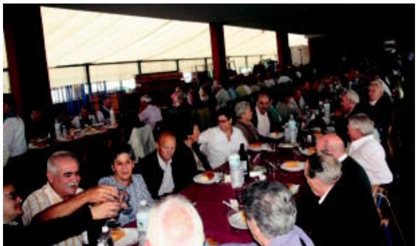
Txermin ikastolako arkupeetan, jubilatutako asko bildu zen bazkaltzeko.