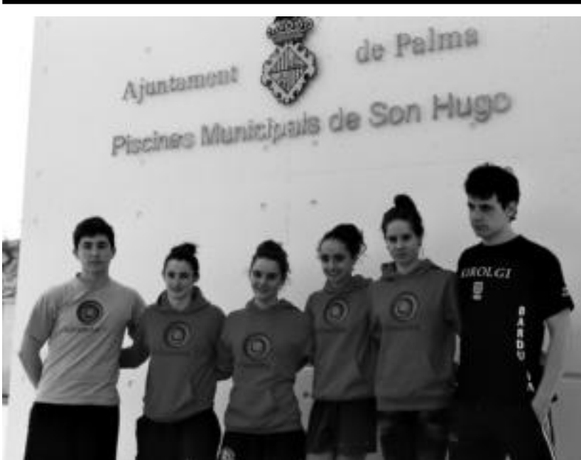
Tolosaldea IKTko igerilariak Mallorcan.