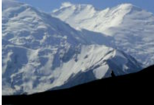
Artzain nomada bat, urrunean Pamir mendiak dituela.