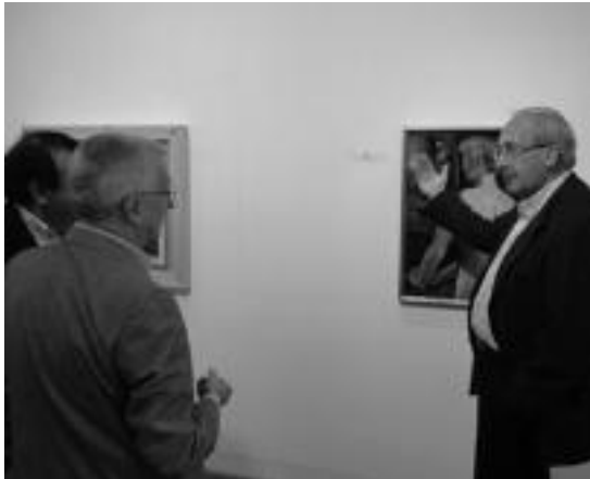
Irungo artistaren 44 lan ikusi ahal izango dira Aranburu jauregian. HITZA

Iberiar penintsulan barrena antolatutako erakusketa ibiltari baten hirugarren geldialdia da Tolosakoa