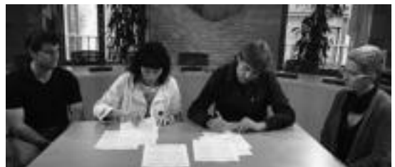
Udal ordezkariek Konfiako ordezkariekin hitzarmena sinatzen. HITZA

Enpresari buruzko informazio gehiago www.konfia.net webgunean, edo 943 36 85 61 telefonoan eskura daiteke. Hala ere, irailetik aurrera, Nafarroa etorbideko 6-3 zenbakian (Correos-eko eraikinean) izango da enpresaren egoitza berria.