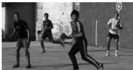
Urte askotako tradizioa du Berazubiko Paleta Txapelketak. ESTI EZEIZA

Xalaren hutsunea azpimarratzeko da. Buruz-buruko txapelketa Baionan egongo da San Inazio egunean, bertako trinkete txapelketa ospetsuan parte hartuko baitu.