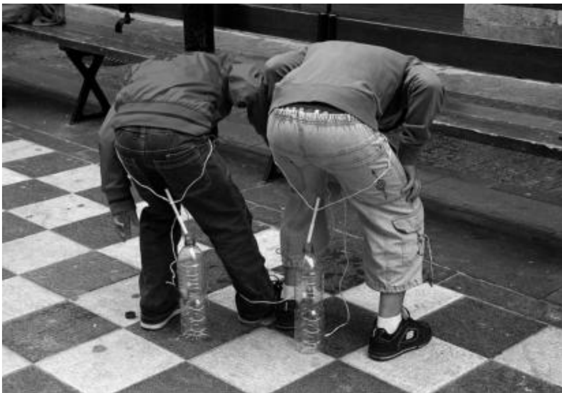
Gaztetxoek hainbat froga gainditu behar izan zituzten. I. URKIZU