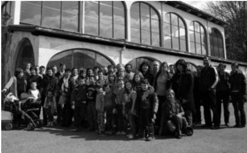
Ekiatldiz betetako egun pasa egingo dute Leaburu-Txaramakoek Larresoroko bisitan. I. AZPILIKUETA