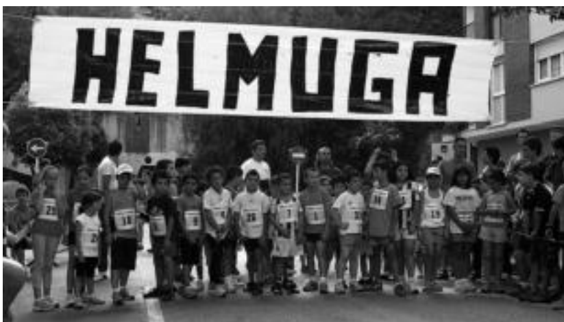
2009ko Santio Kros Herrikoian haurrak irteera puntuan. HITZA