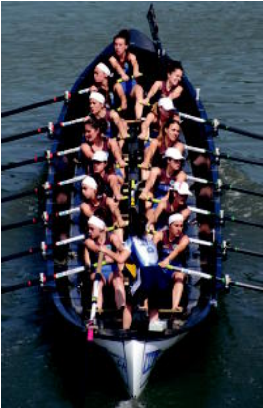
Getaria-Tolosako trainerua. HITZA

Gipuzkoako eta Euskotren Ligako estropada guztiak irabazi dituzte aurtengo denboraldian; Gipuzkoako txapela ere jantzi berri dute ◦5