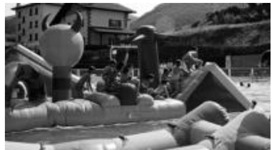
Festan ez dira musika, dantza eta edariak faltako. N. URBIZU

Guzti horrez gain alkoholik gabeko maitasun edabeak eta sorpresa gehiago ere egongo dira. Antolatzailerik «gau liluragarria» bizi nahi duten guztiak gonbidatu dituzte festan parte hartzera.