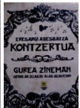
Kontzertua iragartzeko kartela. HITZA

Kontzertuaz gain, Santio Eguneko 12:00etako meza nagusian ere, Eresargi abesbatzak kantatuko du.