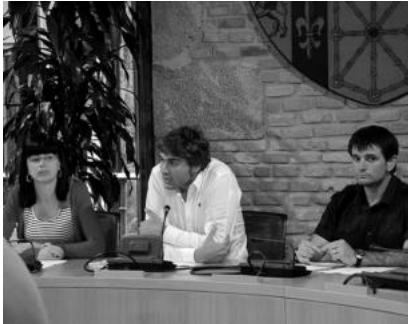
Batzorde informatiboak, organo kolegiatuak eta liberazioak zehaztu zituzten, besteak beste.

Bordondantza eta aurraskuari dagokien, aurtengo Zumardian dia berreskuratu da, eta lorategien jaialdia dela eta, 20 dantzarik bakarrik dantzatu ahal izan dute bertan. Lekuaren inguruan ere hausnarketa egin beharko dela azaldu dute.