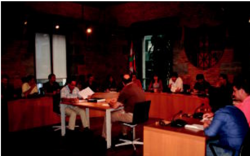
Herenegun arratsaldean egin zuten ezohiko osoko bilkura Tolosako udaletxean.

Hamaika udal batzorde informatibo osatu dituzte; Bilduren ordezkariaren esanetan herritarrei zabalduak daude batzordeak, «parte hartzea bultzatzeko» 2