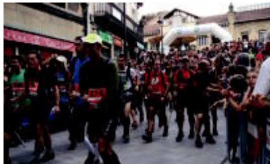
Ehunmiliak probako partehartzaileak laz, Beasaingo Irteeran.