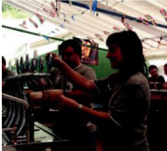
EGARRI DENAK 18:00etatik aurrera izango du eztarria bustitzeko aukera. MAIZ

Garagardo aukera zabalda eskaintzen dute, eta aurtin bi berri gehitu dituzte. Orain artean garagardoek prezio ezberdinak izaten