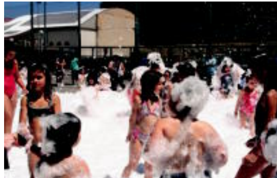
Aurten ere apar festa izango dute haurrek. E.MAIZ