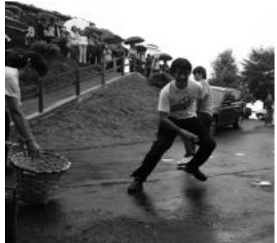
Herriko gazteen arteko herri kirolak izango dira, astelehenean. E. MAIZ

Herri afaria izango dute ostiralean, eta urterto moduan trikiti doinurik ez da faltako. Kasu honetan, Laja trikitilariak Narbaiza izango du lagun. Larunbata egun lasaia izango dute. Mus Txapelketaz gain, Kupela taldea izango da. Igandea eta astelehena berriz, bete-beteak izango dituzte. Igandean, txirrindu zaleekin hasiko dute eguna. Andazarrateko XXVII. Igoera izango da federatu gabeko txirrindularientzat. Herri