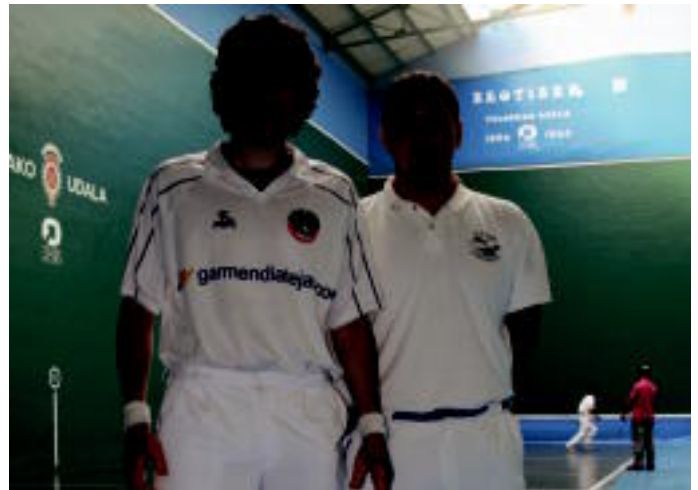
Nagusien mailako finalean Artola-Irusta eta Urretabizkaia-Aizpuru ariko dira elkarren aurka. A. MAZ