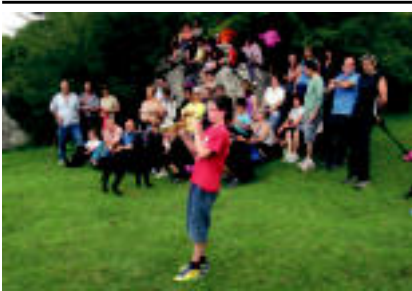
Mendi ibilaldia egin zuten bedaiotarik larunbat goizean; dultzaina entzuteko aukera izan zuten.