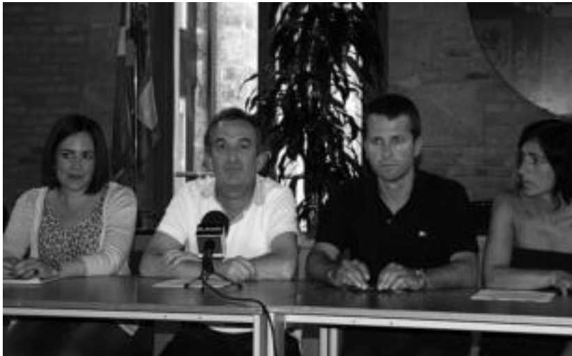
EAJko zinegotzi guztiak izan ziren agerraldian. ITZEA URKIZU