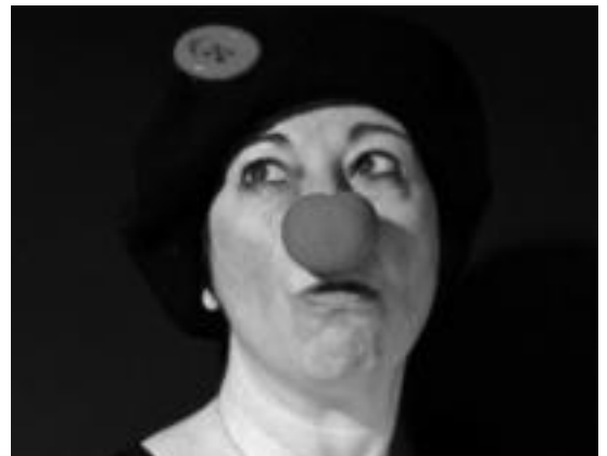
Clown ikastaroan parte hartzeko beharrezkoa da esperientzia izatea. HITZA

Clown ikastaroan parte hartzeko esperientzia izatea beharrezkoa da, eta helburua gaur egungo clownaren transposizioa lortzea