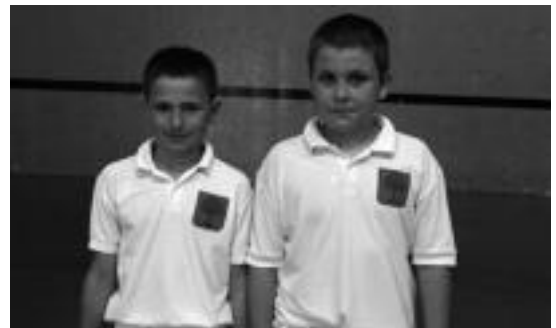
Zabala-Agirre finaletik at gelditu ziren. R. CALVO

Kadeteek ere Beotibarren jokatuko zuten, egun berean. Garaio-A. Aburuzak 18-15 irabazi zuten, Mugika-C. Balerdiren aurka. Urdanpilleta-B. Iruretagoiena 18-15 gailendu ziren. Galarraga-D. Alduntzinen aurrean.