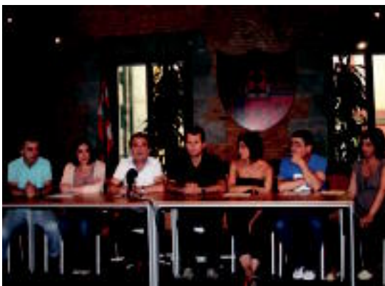
EAJko zinegotzi guztiak izan ziren agerraldian. I. URKIZU

Gaurko osoko bilkuran proposamen «kritikoa» egingo du alderdiak ◊2