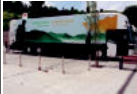
Ibarako plazan izan zen autobusa larunbatean. I.GARCIA

Datozen egunetan eskualdean izango da autobusa eta hainbat herritatik igaroko da. Hilaren 13an eta 14an Abaetakoan izango da, hilaren 15ean berri ere, Ikaztegiatan, hilaren 16an eta 17an Abeltzizketan, hilaren 19an Astegian, Ibarra eta Berastegian izan da. Honako da ordutegia: 10:00-14:00 eta 16:00-20:00.