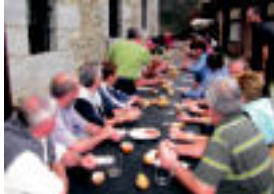
Abaetako lorategietan afaldia zuten hainbatok. HITZA

Larunbata ekitaldiz betea izan zuten Bedaion. Goizean mendi ibilaldia egin zuten herriko gazteen omenez, eta gauean afariarekin eta erromeriarekin bakatu zuten eguna. Eguraldia lagun egin zuten mendi ibilaldia eta gogoratu zituzten «gure ondoren ez dauden gazteko», azaldu dute Artubi elkartetik. «Ohiuturari jarraituz, hauek eta helduek mendia aliatu ginen, eta bertan, gazteak jarriak dauden monolitotatik oromenezko lore sorta eskaintza egin genuen», gaineratu dute elkartekoek. Dultzinaren doinuak ere izan ziren entzungai Balerdi ma-