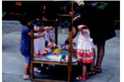
Denbora erraz pasatzen zitzaion haur eta helduei txotxoiaren plazar. HITZA