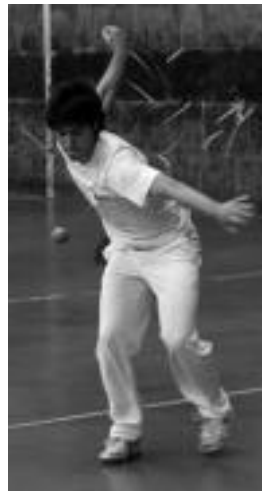
Larunbateko partidetakoa bat. i.e.