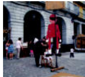
Txotxongilo erroaldi bat zegoen sokekin mugitzen zena. HITZA