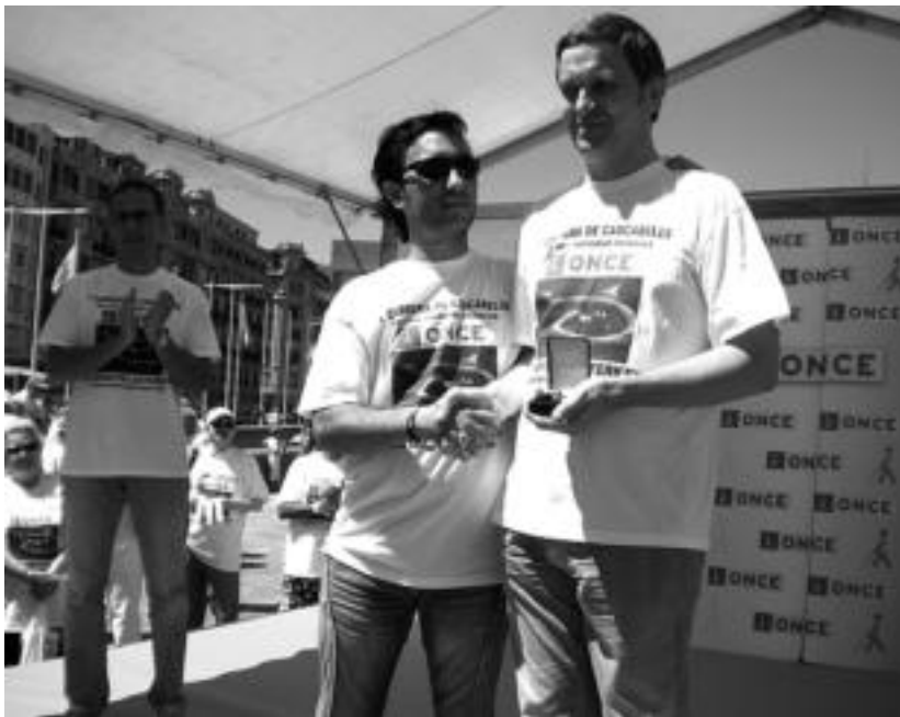
Pasa den larunbatean jaso zuen saria Gainditzen elkarteak, Donostian. HITZA