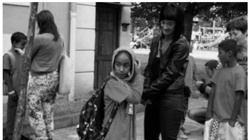
Haur sahararrak Tolosara iritsi zirenean, familia hartzaileak zain zituzten Tolosan.