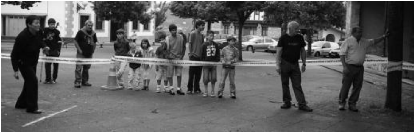
Leaburun dultzaineroen kalejirarekin eman zioten hasiera egunari. Gero meza, hamaiketakoa, dantza emanaldi edo toka txapelketa izan zituzten, besteak beste. MAIER UGARTEMENDIA