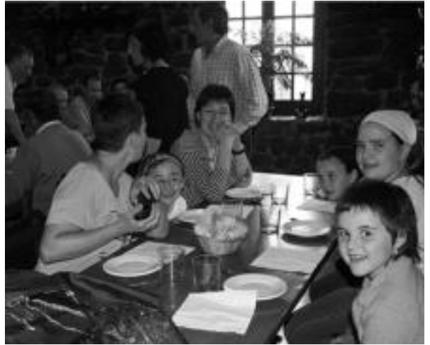
Urkizun hamaiketakoarekin ospatu zuten San Pedro eguna. ASIER IMAZ