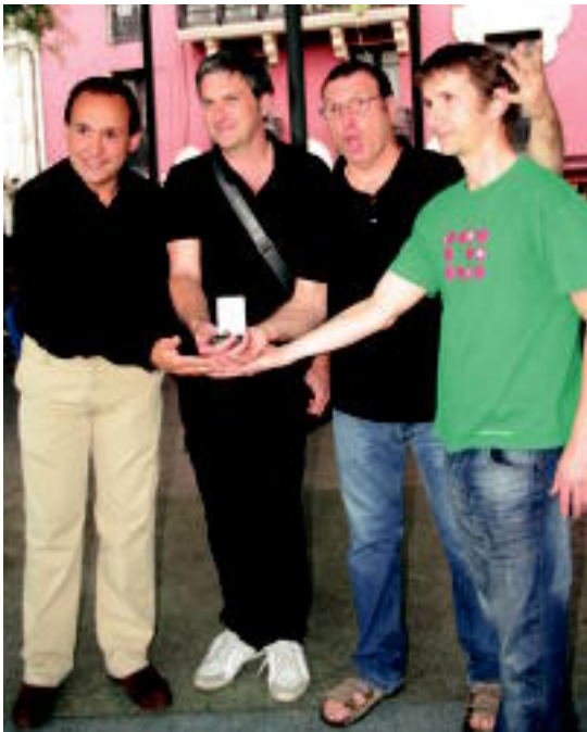
Gainditzen elkartekoek eskerrak eman nahi izan dizkiote ONCEn I. URKIZU

Gormutuen elkarteak jaso du ONCEn saria, Tolosan, zeinu hizkuntzako Nazioarteko I. Film Laburren jaialdia antolatzeagatik o2