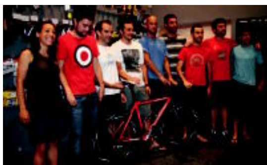
Tolosako IBK Kiroiak dendan egindako aurkezpeneko irudia. A. IMAZ

Austriako Iron Manean eskualdeko bederatzikiolarik hartuko dute parte; Tolosatik gaur irtengo dira Europa erdialdera 03