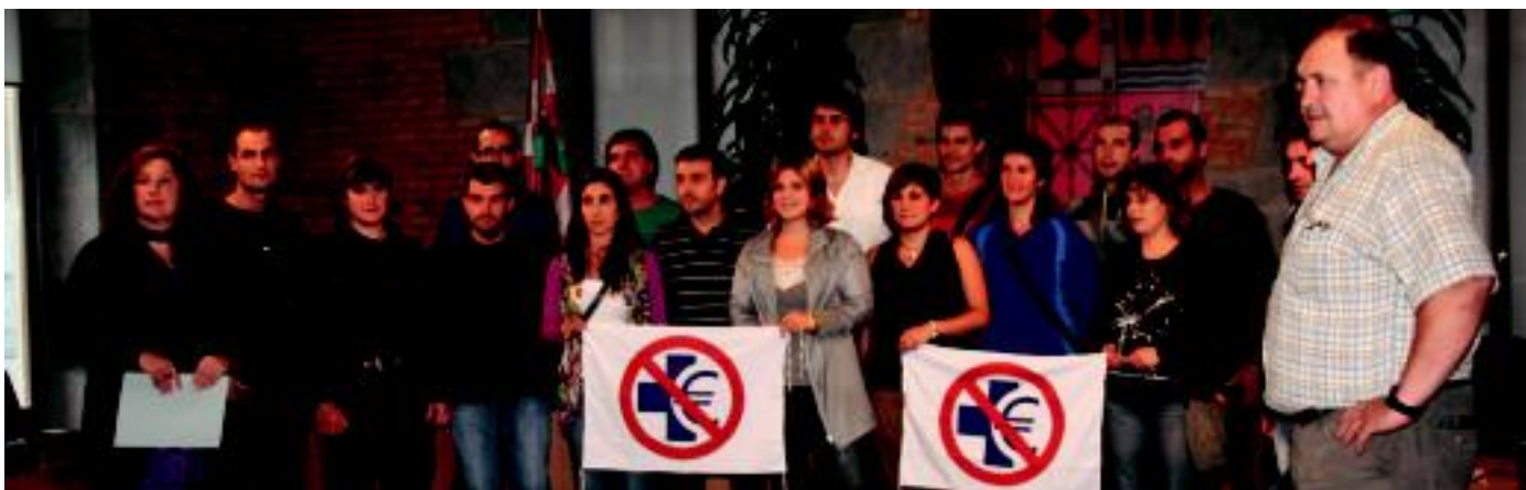
Tolosako udaletxean burutu zen osasun publikoaren aldeko prentsaurrekoa. Bertan eskualdeko udal ordezkariak elkartu ziren. LURKIZU

TOPA koordinakundearen aldarri guztiak bat egin dute hautetsiek, eta Eusko Jaurlaritzak «bultzatu nahi duen erreformaren aurka» agertu dira 02