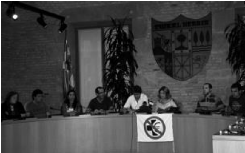
Eskualdeko alkateak Tolosan elkartu ziren prentsaurrekoan. I. URKIZU