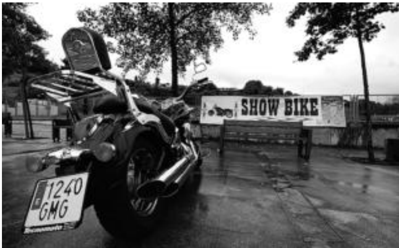
Asteburu guztian zehar mota guztietako motoak eta motozaleak elkartuko dira, Ibarrran. S. GOMEZ