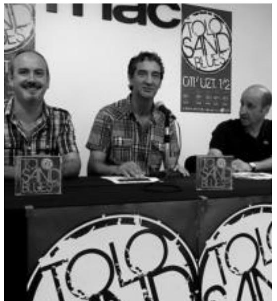
Donostiako Fnac-en izan zen aurkezpena. HITZA