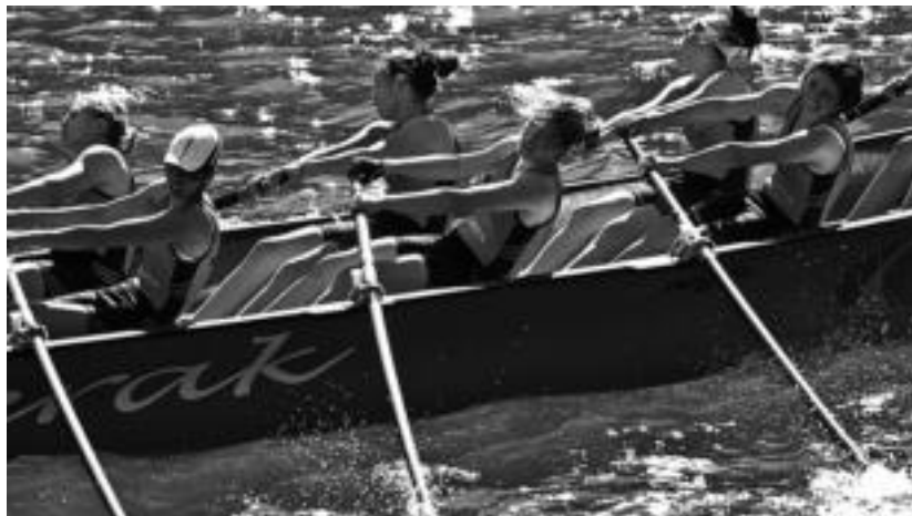
Pasaiaiko uretan jokatu da Gipuzkoako Traineruen Ligako lehen estropada.