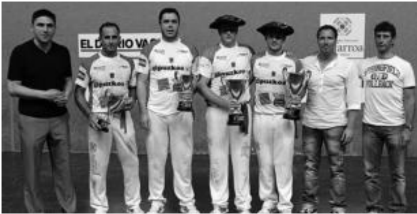
Zeberio II.a, Etxeberria III.a, Urrutia eta Uterga, ezkerretik eskuinera. MAIALEN ANDRES