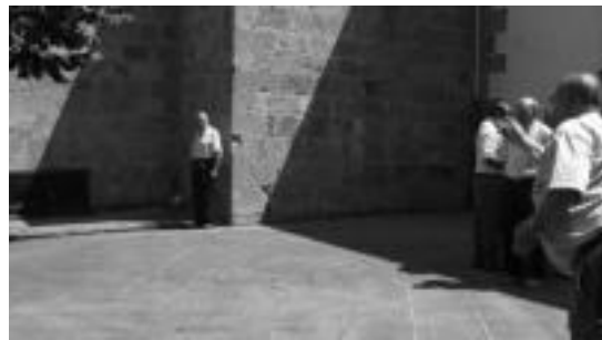
Leaburun herriko eta Euskal Herriko toka txapelketak egingo dira. E. EZERZA

Leaburun izango da beritasunik, Ostatua berriro zabalduko baita egun hauetan. Bihartik igandera izango da irekita eta ondoren lau egunetan itxita izango da. Uztailaren 8an berriro zabalduko dituzte atea eta hortik aurrera egunero irekita izango da.