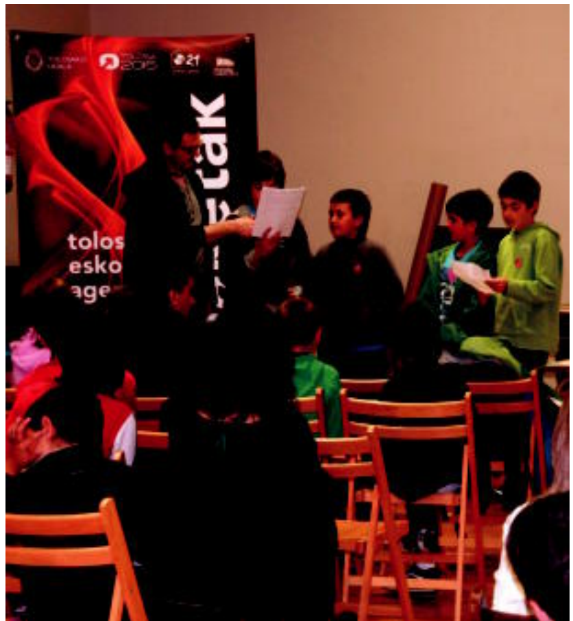
Ikasleak Eduardo Mokoroa musika eskolan bildu ziren atzo goizean zehar. I. URKIZU

Atzotik hasita, N-1 errepideko tarte honetan egiten diren arau-hausteeak isuna izango dute 02