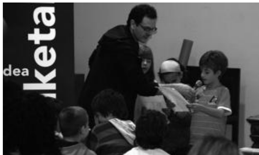
Ikasleek euren ondorioak azaldu zituzten. I. URKIZU

TOLOSA Etzi, hilak 11, bular-emate kolektiboa izango da Aranburu jauregiko berdegunean, 11:00etatik aurrera. Edoskitzea normalizatzea eta sustatzea da helburu nagusia.