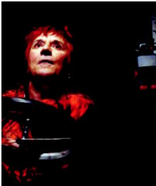
Tic Tac taldeak, Maitetasuna antzezlan eskainiko dute, eta Edurne Agirrezabalak, Zintzilik antzezlan. AMAIA PAGOLA