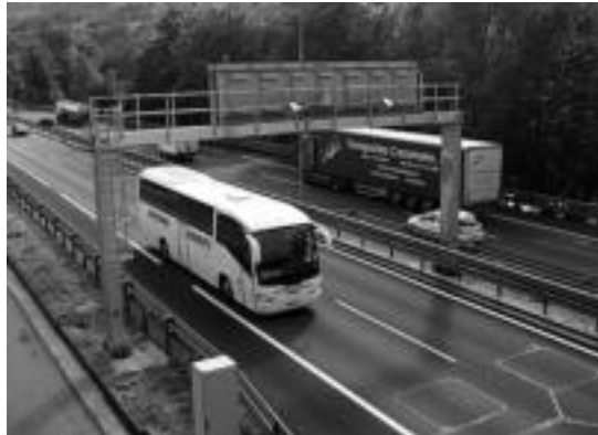
Irurako Laskibar zubiaren ondoan dago radarra. I. GARCIA

Probaldian egon den bi hilabeteetan, baimendutakoa baino batez besteko abiadura handiagoan zihozten mota guztietako 2.178 ibilgailu hauteman ditu N-1eko