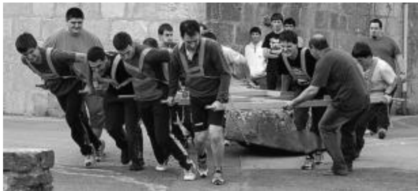
Berastegiko gizon proba taldea eta idi pare elkarren aurka ariko dira, Berastegiko harriarekin . HITZA