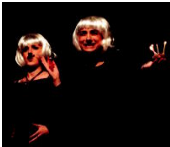
El león y la cigala antzezlan egingo du Pollo Rosa taldeak. HITZA