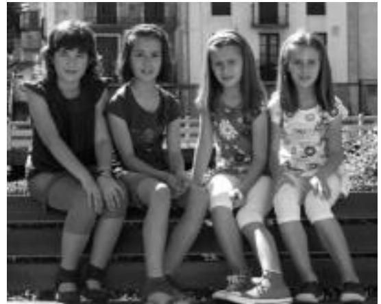
Lizartzako Sorginak taldeko kideak.

Nafarroako Gobernuak azaldu-takoaren arabera, hildakoa Anoetako 58 urtetako gizona da. Ustez gidaria bakarrak zihonan autoan.