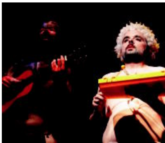
Eguzkilo lana egingo dute, Hortzakakoek. HITZA

Bukatzean den V. Poltsikoko Antzerki Lehiaketako finalera, guztiak gonbidatu nahi izan ditu.