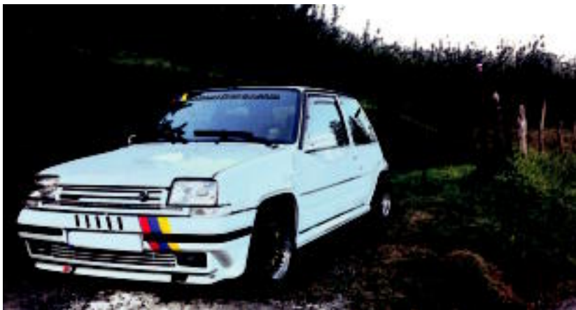
Auto lasterketen zaleek euren autoak eramango dituzte Ibarra plaza. HITZA

‘www.maskarreras.com’ webguneak antolatuta, 35 autotik eta 50 lagunetik gora lagunetik gora bilduko dira