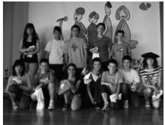
14 urte arteko Nafarroako Eskolarteko Bertsolari Txapelketako finala. HITZA

■ Garajea. Iruran 120 metro karratuko lokala alokatzen da, gune industrialean kokatua. Oso egokia eta aproposa da hainbat eginkizunetarako. 500 euro hileko. Interesatuak, deitu 619 34 93 85 telefono zenbakira.