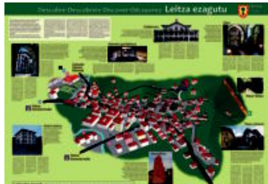
Hainbat mapa prestatu dituzte gerturatzen diren turistek banatzeko. HITZA

dian, eta urteko beste egunetan egun eta ordu zehatz batzuetan irekiko dituzte. Bulegoetan Leitzari eta bere inguruneari buruzko informazioa duten panelak daude. Lehen harategia zen plazako bulegoan, esate baterako, gai hauek lantzen dira: Natura,