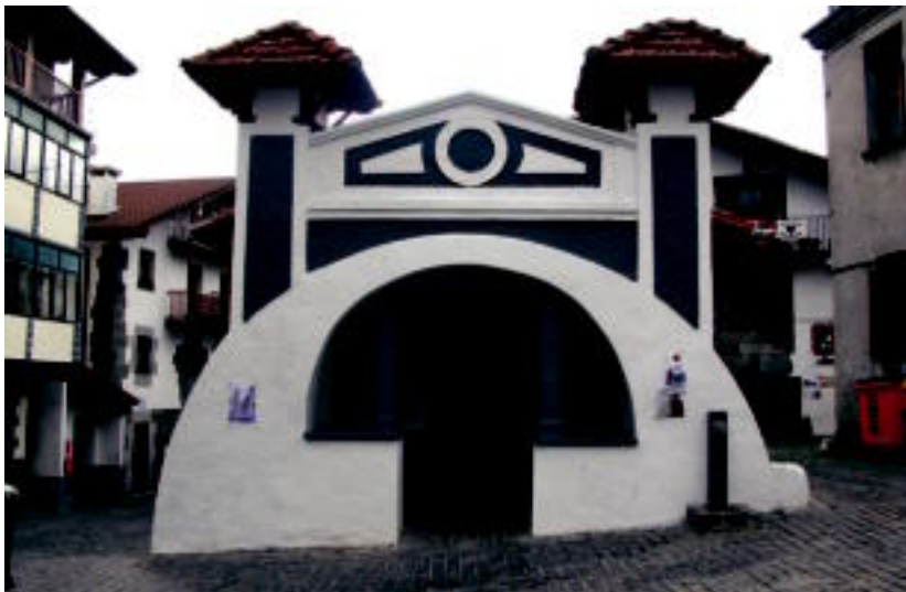
Epe motzean bi turismo bulego zabalduko dituzte. Alde batetik, plazan bertan eraberritu berri duten harategi zaharra; eta, bestetik, Leitzalarreko Ixkibarrekoa. M. UGARTEMENDIA