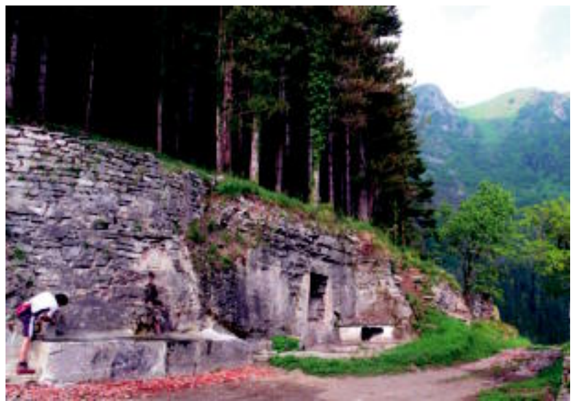
Uzturre inguruan orain, zuhaitzen landatzea bakarrik falta da. A. BELAUNZARAN