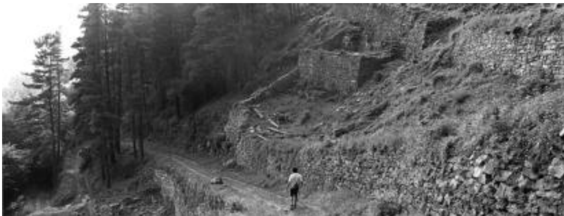
Uzturre inguruan garbiketaren lanetan aritu dira hainbat gazte azkenaldian. A. BELAUNZARAN

ZIZURKIL Gaur Atxulondo kultur etxean 12:00etatik 14:00etara, eta 15:00etatik 16:00etara casting bat egingo dute iragarki bat grabatzeko. Iragarkia Espainiako Loteria Primitiboarena izango da, eta Zizurkilgo baserri batean grabatuko dute ekainaren 9an. Casting-aren antolatzaileek argitu dutenez, jende «kaleko jendea» nahi dute, hau da, ez da beharrezkoa arlo honetan esperientziarik izatea.