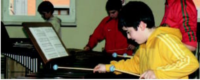
Tolosako Eduardo Mokoroa Udal Musika Eskolako ikaslea. HITZA