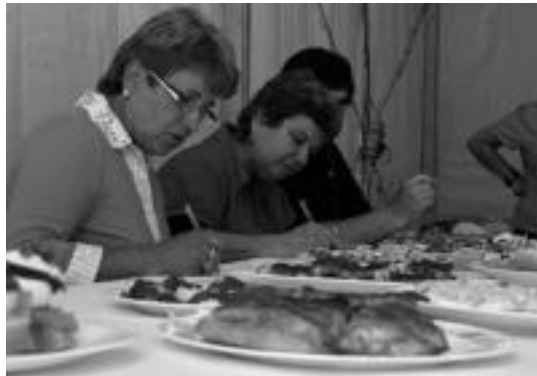
Aurten ere pintxorik goxoena aukeratu dituzte pintxo lehiaketan. R. CALVO

Txaramako jai batzordeak herritar guztiak animatu nahi ditu festetan parte hartzera eta ondo pasatzera.