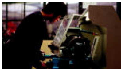
SR eta SEA ikasketekin batera, grafikagintzako DP eta PR ikasketak burutzen dituzte Urnietan. HITZA

Bestetik, Erregulazioe ta Kontrol Sistema Automatikoekin (SR) ikasketak ere eskaintzen dituzte. Zirkuitu elektriko, pneumatiko,