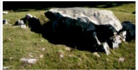
Jentilarri Trikuharri hau ikusteko aukera izango dute larunbatean. HITZA

Mendiarekin jarraituz, gaur 19:00etan hitzaldia egongo da Otsabin. Bertan Alpeen inguruko eskalada proiektzioa ikusteko aukera ere egongo da.