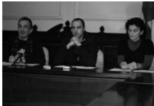
Pasa den otsailean, Tolosaldea Garatzenek Tolosako Udalarekin enplegua sustatzeko akordioa sinatu zuen. IGARCIA

Lanbide zerbitzuak aurrera ematen dituen ekintzen artean, honakoak azpimarra daitezke: Lanbideko curriculumetan eguneraketak egiten dituzte; lan eskaintzei eta prestakuntzei buruzko informazioa ematen dute; era-