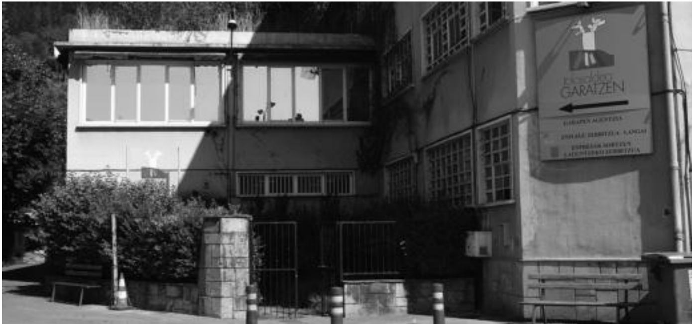
Kanpo merkataritzako ikastaroa Tolosaldea Garatzenen egoitzan izango da. LURKIZU