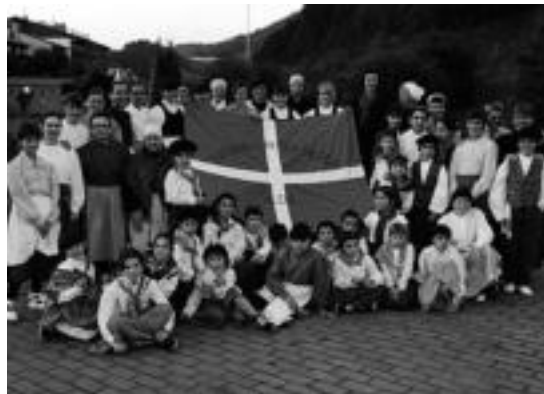
Sutarririk dantza taldeko kideak. HITZA

ke izena Sutarririk, eta datorren urterako taldean sartu nahi dutenek dagoeneko aukera dute horretarako. Kultur etxera joan behar da eta ekainaren bukaera arte dago epea izena emateko.