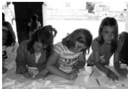
Ostiralean, kamisetak margotzen ikasi zuten herriko haurrek.

■ 09:00. Plazatik abiatuta, gaiteroen eskutik diana. ■ 11:00etatik aurrera. XXXIV. artisau azoka ikusgai egonen da plazan, egun guztian zehar.