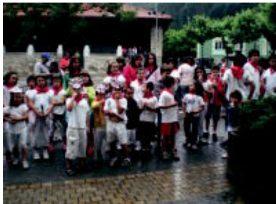
Irurako Udaleku Irekietan, San Ferminetan entzierroa irudikatu zuten. HITZA

HH1 eta LH6. maila bitarteko haurrentzat izango da; uztailaren 4tik 15era, 10:00etatik 13:00etara.