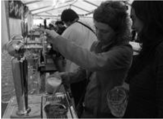
Ibarako III. Garagardo Festako argazkia. | TERRADILLOS

nua egongo dela azaldu dute antolatzaileek, hau da, herriko produktuekin batera ukondoa eta saltxitxak.