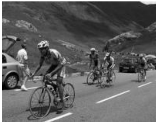
'www.kirolprobak.com' helbidean izena eman daiteke. L. MONTES

Lasterketa bat ez denez, ez da denborarik hartuko eta edozeinek parte hartzeko aukera izango du. Parte hartzaile guztiak ordea,