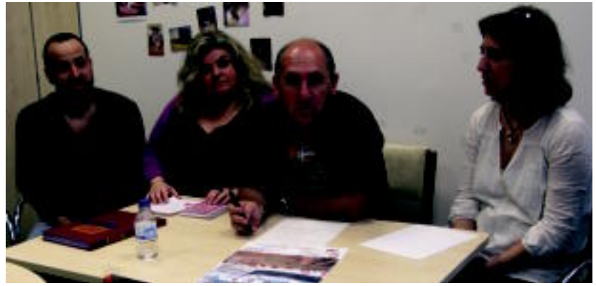
Tolosaldea Sahararekin elkarteak kideak, prentsaurrekoan.

Txangorako txartelak hilaren 30era bitarte izango dira eskuragarri, lekuak lehenago betetzen ez badira. Bazkideek, 33 euro ordaindu beharko dituzte, eta Harizpeko bazkide txartel eguneratua aurkeztu beharko dute. Bazkide ez direnek, berriz, 36 euro ordaindu beharko dituzte irteerara joateko.