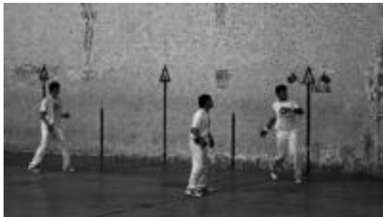
Berrobiren eta Bidegoianen arteko nagusien joaneko partida.