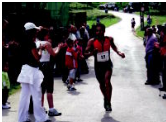
Ikusmina sortzen du Amasan egiten den lasterketak. A. OTEZABAL

Nahi duen guztiak har dezake parte, eta izen-ematea doan da. Uxo-Toki Elkartean eman beharko da. 10:30ean hasiko da lasterketa, Amasako plazatik. Bidea marikatuta egongo da, eta Loatzoko