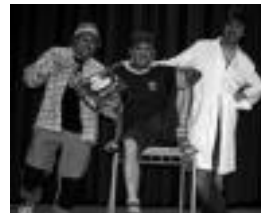
Xagu antzerki taldea.