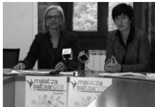
Lazkano eta Larrea, ekitaldien berri ematen. E. MAIZ

■ Trikitixa kontzertua. Loatzo Musika eskolako ikasleek eskai-