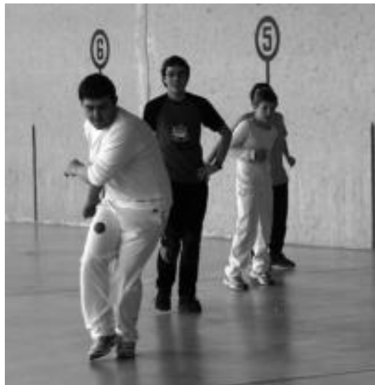
Elbarrenekoak kalekumeen aurka jokatu zuten partida bat. M. UGARTEMENDIA

Dianarekin eman zioten hasiera egunari. 11:00etan herritar guztiak adi jarri ondoren, 13:00etan auzoan arteko apustua egin zuten pilotalekuan. Bertan hiru auzotako hiru bikotek jokatu zituzten pilota partidak. Jende asko hurbildu zen pilota auzoan arteko partidak ikustera. Amaitu ondoren, pintxo lehiaketa egin zuten, herriko pintxorik onenak norenak ziren erabakitzeko. Arratsaldean, herriko neskek mutilen aurka