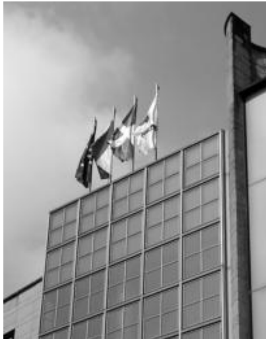
Tolosako epaitegian bandera europarra eta espainiarra jarri dituzte, ikurrinarekin eta Gipuzkoako armarrria duenarekin batera. R. CALVO