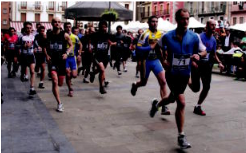
Joan den urtean 120 lagun inguruk parte hartu zuten, eta aurten ere kopuru bertsua espero dute. HITZA