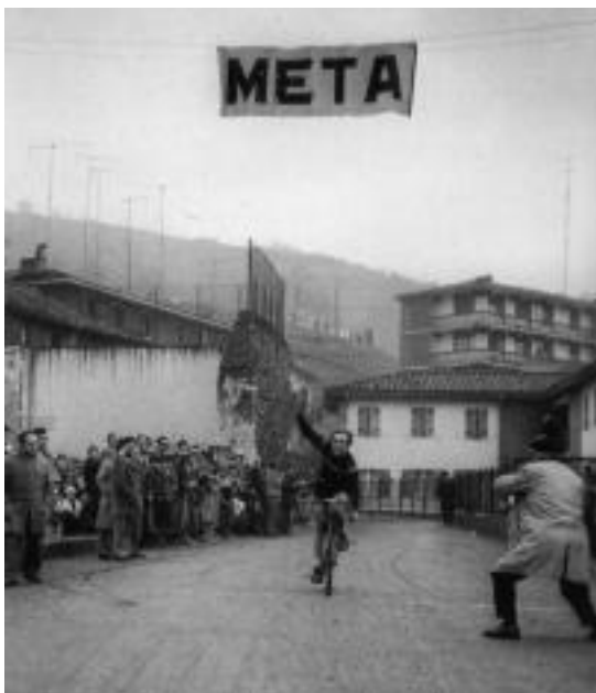
Txirrindularitzak Gipuzkoan garrantzi handia izan zuen. HITZA