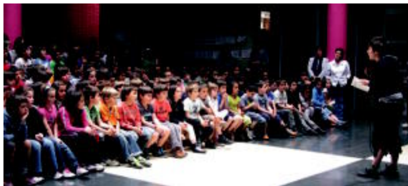
Pagola eta Estangak idatzitako Zeruaren beste aldean dagoen mundu ezkutua ipuina adi entzun zuten. E. MAIZ

Hala ere, antolatzaileek, eskerak eman nahi dizkie saritua izan ez diren, baina lehiaketan parte hartzaile izan diren guztiei. Lehiaketa honekin, euskara biziberritzeko plan nagusiaren barruan, haur eta gazte literatura suspertzea dute helburu.