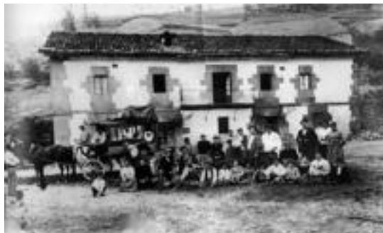
Juanlopezenea etxearen 1896ko argazkia. 'AMEZKETAK ETXEZ ETXE'