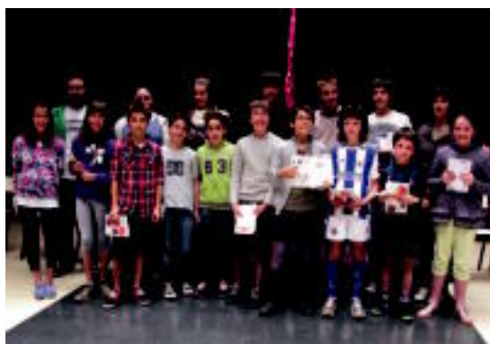
8 eta 16 urte bitarteko saria jaso duten, 15 ikasleak.