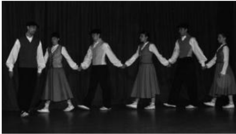
Alurr Dantza Taldekoak, Londresen eskaini zuten emanaldian.

TOLOSA ▶ Datorren astelehenean, apirilaren 11n, Eduardo Mocoora udal musika eskolako ikasleek, 2. hiruhilabeteko kontzertua eskainiko dute. Bertan, ondorengo instrumentua jotzen duten ikasleek parte hartuko dute: pianoa, flauta, akordeoia, klarinetea, saxoa, txeloa, oboea eta perkusioa. Kontzertua musika eskolako areto nagusian izango da, 19:15ean. Musika gustuko duen oro kontzertura gonbidatuta dago.