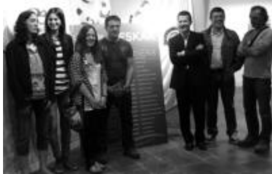
‘Boga berria’ argazki erakusketaren aurkezpena atzo egin zuten.

Argazki gehienak 2008koak dira, Kontxako I. Emakumezkoen Bandera jokatu zenekoak. Hala eta guztiz ere, TAKeko neskek bere lekua dute; hauen azken 6 urtetako lorpenak edo palmareak erakusten baitira. Klubeko maila guztietako emakume arraunlariak ere agertzen dira.