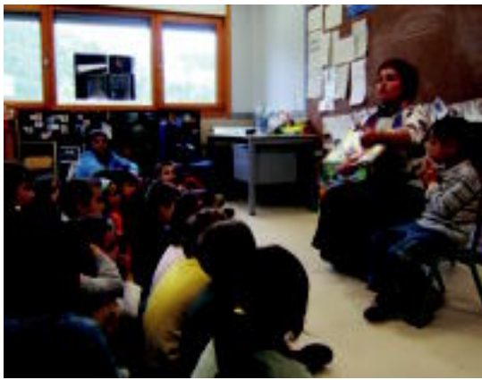
Ekitaldi ugari egiten dituzte Samiegon, irakurzaletasuna bultzatzeko. HITZA

Hitza-ko bezeroen arreta zerbitzua (zalantzak argitzeko, harpidedun egiteko): 902 82 02 01