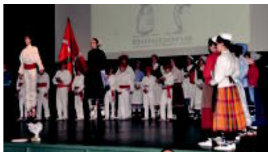
Iaz Villabonan jokatu zen kanporaketa. HITZA

VILLABONA › Bihar, txirindulari proba bat egingo da Villabonan, eta bertan gaztetxoek parte hartuko dute. Ibilbidea, Kale Berria, Nagusia eta Txermin inguruan izango da. Eta 16:00etatik 18:00etara izango da. Ondorioz, Kale Berria trafikoa moztuko da, eta autobus geltokiak ere moldatu egingo dira: Donostiara joateko, kiroldegian eta Txermingo biribilgunean; eta Tolosara joateko, Txermingo biribilgunean eta Arroa auzoan hartu beharko da. Era berean, Zubimusu ere moztu egingo dute, beraz, ezinongo da Zizurkildik Villabona aldera pasa, aipatutako orduetarako.