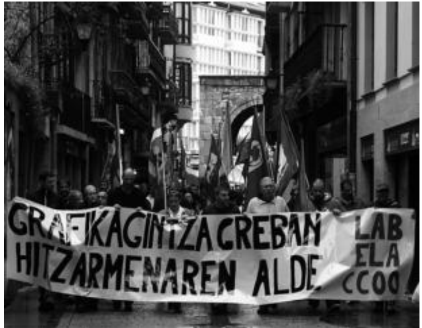
Iazko ekainean ere, kalera irten ziren eskualdeko grafikagintzako langileak. A. IMAZ

Iazko udaberrian ere bost eguneko greba egin zuten grafikagintzako sektorean, eta oraindik ez dute Adegiren patronalarekin adostasun batera iristerik lortu. Sindi-