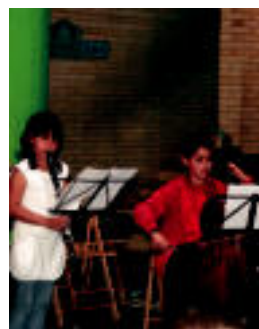
Anoetako kontzertu bat. E. EZEIZA

Gaur, 18:00etan, Villabonako Musika Eskolan, gitarra entzunaldia izango da. Eta bihar ostirala, 18:00etan, Adunako plazan, dultzaineroek herritarren aurrean emanaldia eskainiko dute. Eta ordu bate beranduago, 19:00etan, baina Irurako Musika Eskolan,