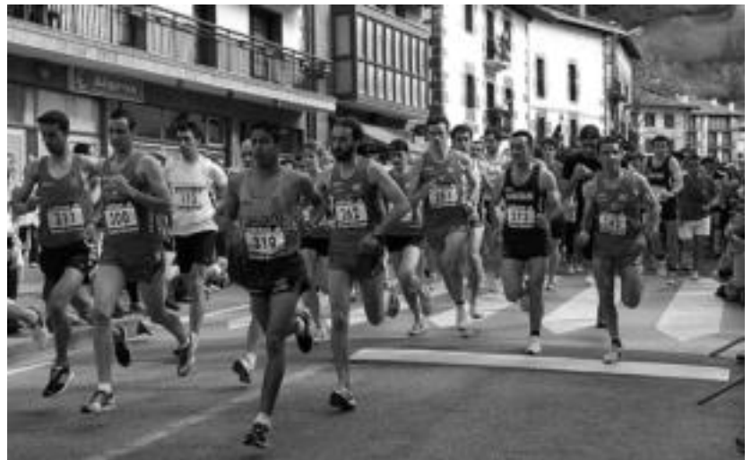
Korrikariak herriko kale nagusitik abiatzen dira, eta plazan amaitzen dute lasterketa. ESTI EZEIZA

Bihar, berriz, Korrika Txikia egingo dute eskolako haurrek, nahiz eta aurten Korrika ez den Aresotik pasako. Haurrak 15:00etan aterako dira eskolatik. Ondoren, askaria egingo dute.