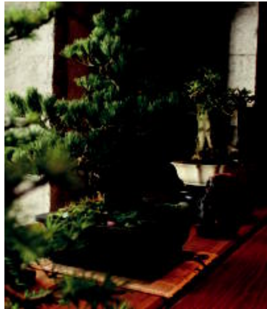
Bonsalak eta suisekiak larunbata arte egongo dira Topic-en. R. CALVO

Bukartzeko, Kenpo-Kai borroka artearen erakustaldia 18:00etan izango da Zerkausian.