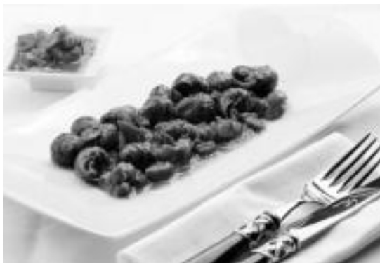
Aste Santuetako izarra: karakola plateran. HITZA

Udaletik azaldu dutenez, «Tolosak aspaldi erabaki zuen Slow Food mugimenduari bat egitea, eta ekimen honek ere zuzenean lotzen gaitu larunbateroko azokak oinarrian duen filosofia horretara. Hori dela eta, beste behin ere gure azokara gonbidatzen ditugu herritarrek, kasu honetan gainera, karakol saltsa la-saitasunean gozatzera!».