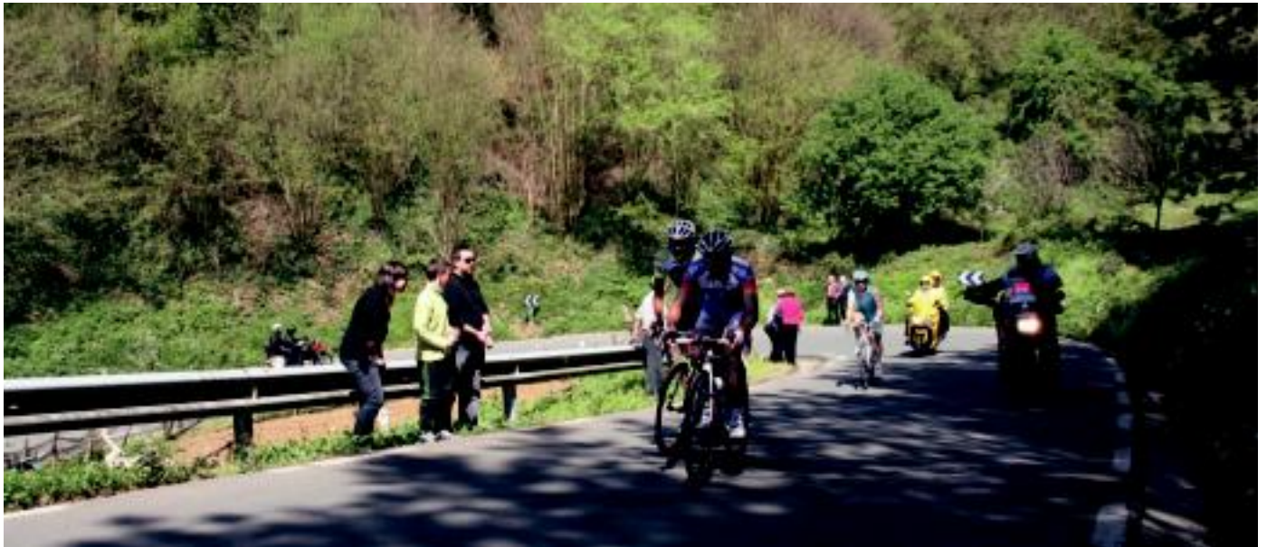
Valls, Cataldo eta Iglinski Altzoko gaina igoz. ENERITZ MAIZ