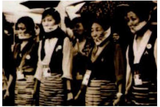
Tibet herriaren egoera gertuagotik ezagutzeko aukera, Aljibeian. HITZA

Hitzaldiaren ostean, dokumentala eskainiko dute. Hodeien atzean eguzkia ( El sol tras las nubes )