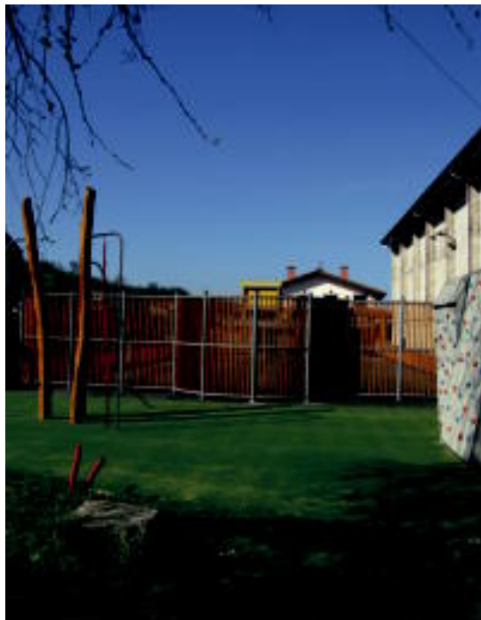
Guneak rokodromo txiki bat ere badu. E. MAIZ

106.522 euroko aurrekontua Lanak Lurkoi enpresak egin ditu, eta 106.522,61 euroko aurrekontua izan dute. Hernialdeko Udalak erdia ordaindu du eta gainontzekoa Eusko Jaurlaritzako Kultura eta Kirol Sailak.