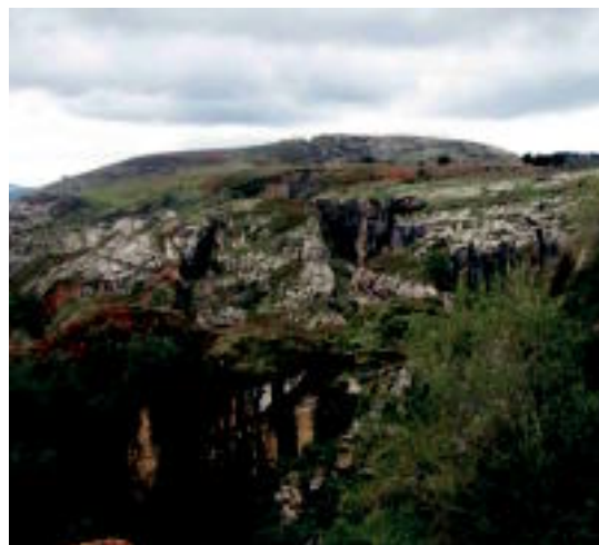
Aizkardiok, mina hauetatik pasako dira. HITZA

Izena emateko Asteasuko kiroldegira joan edo deitu beharko da, eta azken eguna hilak 7, osteguna, izango da. Aiara joateko autotik ez eta lekua behar duenak, izena ematerako garaian zehaztu egingo beharko du. Pagoetara egingo duten irteera hau, doan izango