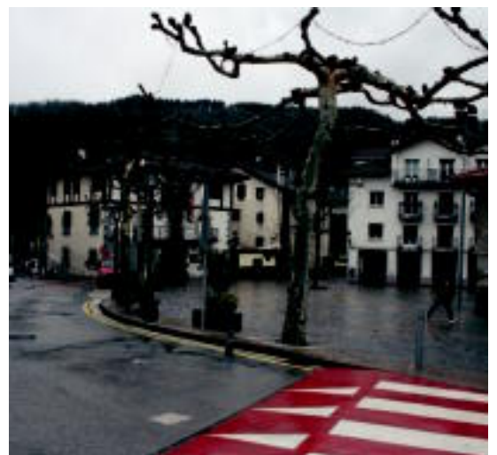
Plazara sartzeko bidea ezingo da erabili hurrengo asteetan.

Herriar guztiei, honen berri emango diete udaletik.