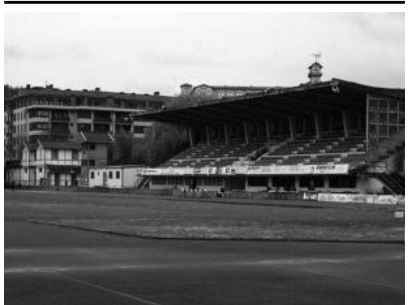
Usabal kiroldegiko zerbitzuak osatuko ditu Berazubi eraberrituak. I. URKIZU

TOLOSA › Tolosaldea osasun publikoaren aldeko plataformak sinadurak bilduko ditu datorren larunbatean. 11:00etatik 13:30era, herriko kaleetan mahaia jarriko dituzte.