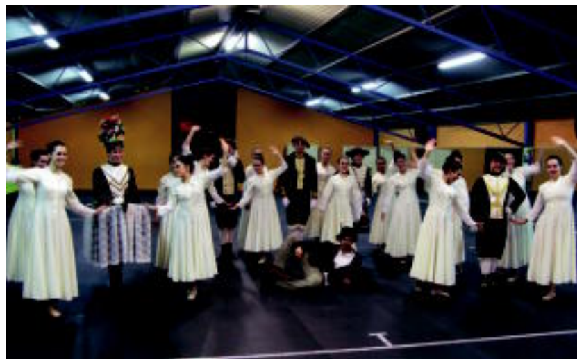
Oinkari Dantza Taldeko kideak entseguko une batean. E. MAIZ