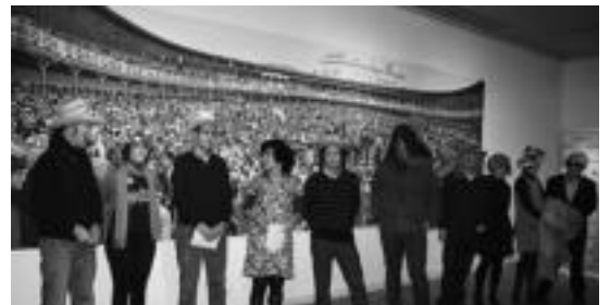
‘Jeiki, jeiki’ erakusketa aurkeztu zuten unean. HITZA

Balantzea egiterako orduan, ondorioz, «gustura» agertu dira ekimenaren sustatzaileak: «Egitasmoa hain era pozgarrian amaitu den honetan, eta Inauterietan horrelako ahalegina merezi dutela sinistuta... hurrengo urratsarako lanean hastea besterik ez dago!».