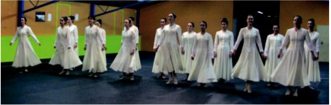
Azken asteetan egunero entsegatzen dute eta orduak pasatzen dituzte, Ikastolako ganbaran. Emanaldian zuzeneko musika izango da. E.MAIZ