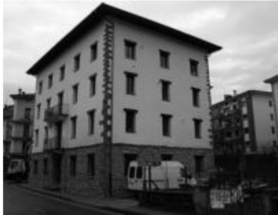
Atekarock Atekabeltzeko lanak egin ahal izateko antolatatu dute. M.U.

Kontzertuak 05:00ak inguruan amaituko diren arren, kiroldegian ez da musikarik faltako; eta eguna argitu arte parradan ja-