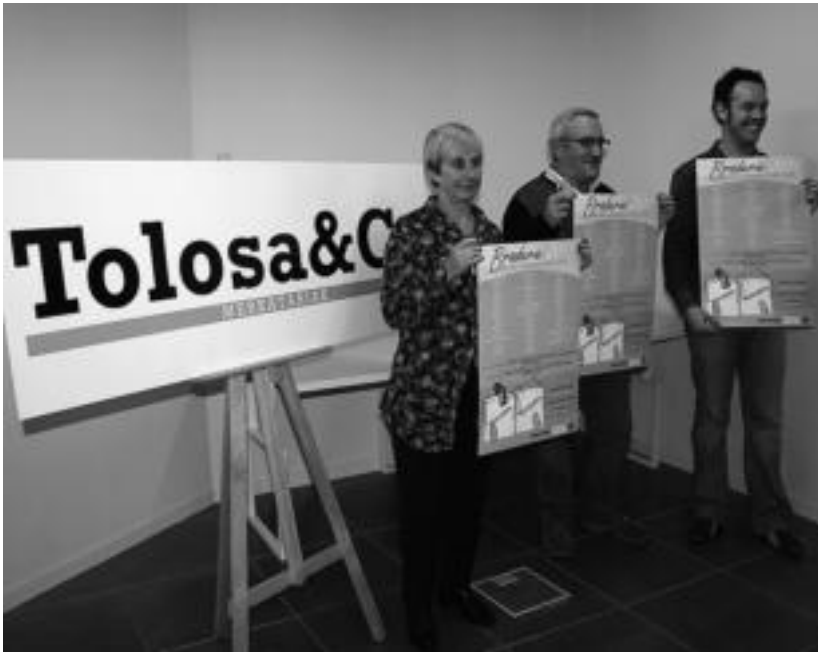
Tolosa &amp; Co merkatarik elkarteko kideak Braderie 2011 aurkezten. A. IMAZ