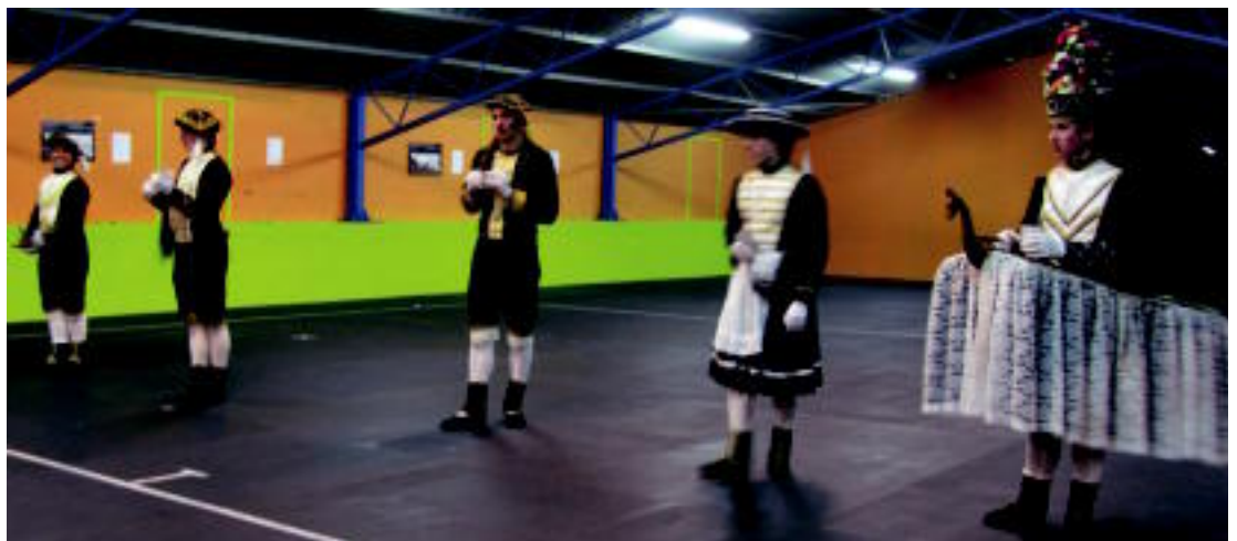
Oinkari Dantza Taldeak, talde askotan gertatzen ez den bezala, ez du arazorik dantzari mutilak aukeratzeko. E.MAIZ

Tolosako Leidor Antzokian estreinatuko dute apirilaren 15ean, 22:30ean. Sarrerak salgai daude, www.kutxa.net helbidean, eta 10 euro ordaindu behar da.