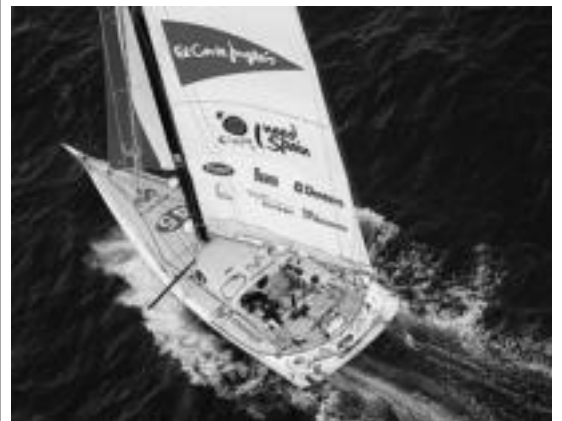
Mapfrekoek apirilaren 5an edo 6an Bartzelonara iristea espero dute.

Hala ere, Xabi Fernandezek gauzak «ondo» doazela eta «kondizio onak» dituztela esan zuen duela egun batzuk. Apirilaren 5an edo 6an Bartzelonara iristea espero dute, eta burua helmugan dutela ere onartzen dute.