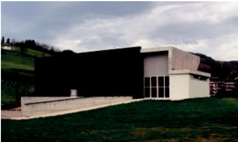
Bertako toponimia kontuan hartuz jarri diote Mikelasagasti izena auditoriumari. E. MAIZ

Mikelasagastiko areto nagusian 120 laguntzako toki dago, eta honetaz gain, bilera gela, aldagelak, biltegia, komunak, kontrol gela eta takilak ditu 6