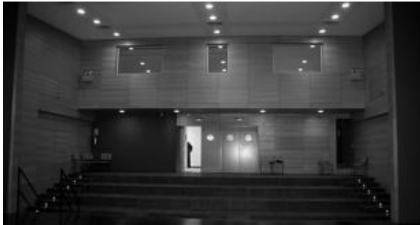
102 lagun sartzeko lekua dago, eta besaukiak jartzea falta da. Goian, bilera eta kontrol gelak daude. E. MAIZ

Eszenatoki ederra prestatu dute. Eserlekuetan, 102 lagun sartzeko tokiak izango da. Era berean, bilera gela bat, aldagelak, komunak, biltegia, kontrol gela eta takila ere baditu. Bideo-proiektzioak eskaintzeko asmoa ere azaldu du udalak. Erabiltzeko moduan