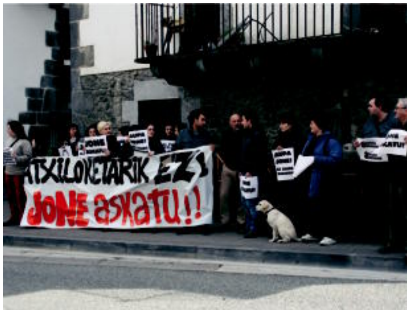
Lanuztearen baitan egindako elkarretaratzeetan, 120 pertsona inguru elkartu ziren guztira. M. UGARTEMENDIA

Lanuztearen jarraipena eta babesa «zabala» izan dela adierazi