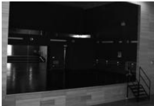
Eszenatokia, dantza entseguetarako eta emanaldietarako prest dago. MAIZ

badago ere, «janzea» falta zaie eta aurrekontuekin lanean ari dira. Hau da, aulkiak eta proiektioetarako gela hornitzeko materiala erostea falta zaie. Dantzarako, ispilua eta barrak jarri dituzte. Gastuei aurre egiteko berriz, Estatutik etorritako laguntzak