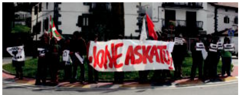
Herri hasieran dagoen biribilgunean ere egin zuten elkarretaratzea. M. UGARTEMENDIA

Leitzan eta Areson bi orduko greba egin zuten atzo eguerdian; era berean, elkarretaratzeak ere egin zituzten hainbat tokitan 5