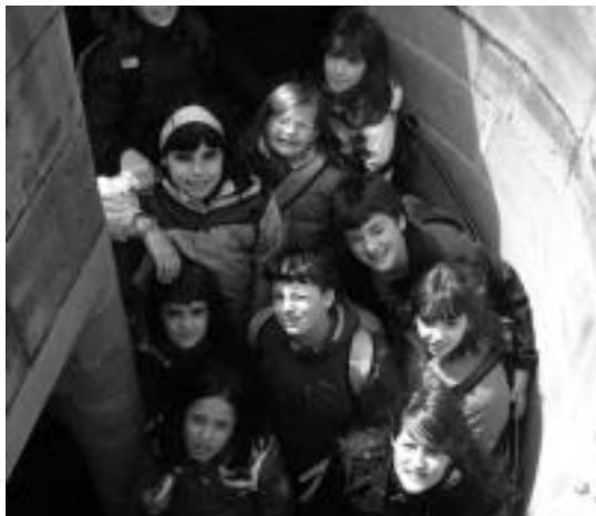
Erriberriko Gazteluan, taldeko kide batzuk. HITZA

7 eta 15 urte bitarteko haur eta gazteek abesten dute Txintxarri Txiki abesbatzan. Gainera, abes-