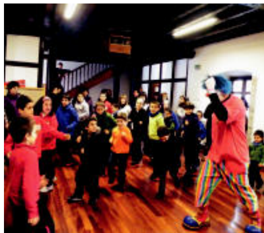
Porrotx Txalburu eskolan izan da abestietako koreografia erakusten. HITZA

Zehazki, Txalburu eskolakoek bi abestitan parte hartuko dute: Eskola Txikien Festakoan eta Maita zaitut izenekoan. Pirritx eta Porrotxekin abesten duten bitartean, Abaltzisketakoek koreografia dantzatuko dute. Azken asertean entseguak egiten ari dira.