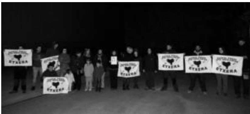
Guardia Zibilaren presentziaren aurrean, elkarretaratzea 20ko multzotan egin behar izan zuten Areson. HITZA