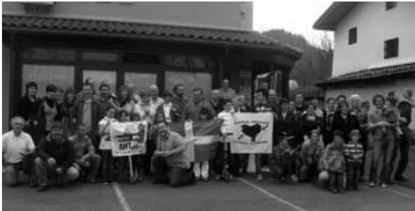
Urtero bezala, sagardotegian egingo dute bazkaria Larresoroko eta Leaburu-Txaramako lagunek. HITZA