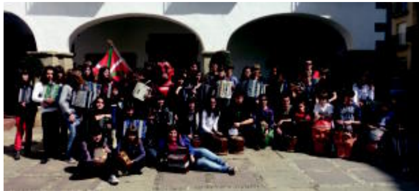
72 ikasle eta 9 irakasle larunbatean azokan eta kaleetan barrena kalejiran ibili ziren. HITZA

Euskal Herriko mugetatik haratago joan nahi izan dute musika eskolako irakasleek. Eta Kataluniako Arenys de Mar herriko Musika Eskolarekin harremanetan jarri ondoren, elkartrukea egitea erabaki zuten.