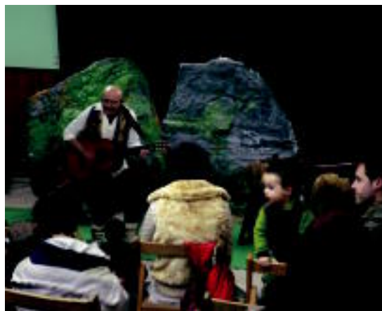
Doro Zobaran Amarotzeko emanaldian. HITZA