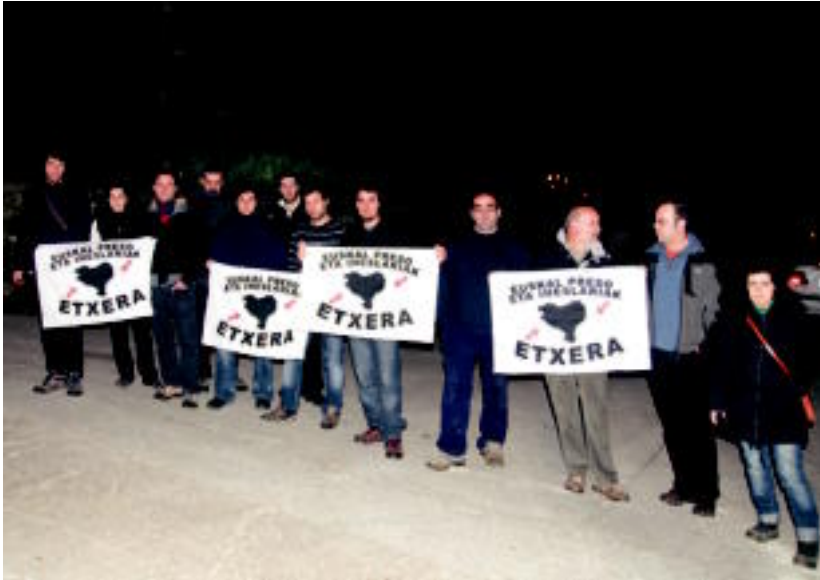
Areson elkarretaratzea egin zuten herritarrek, 20ko lau taldetan banatuta. HITZA

Osteguna, 2011ko martxoaren 24a. VIII. urtea. 2.198. zenbakia. www.tolosaldea.hitza.info