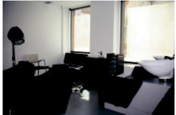
Jubilatu elkarteko kideek arduratu beharko dute gela hauen erabileraz. Erabilera askotako gela edota ileapaindegia dituzte. E. MAIZ