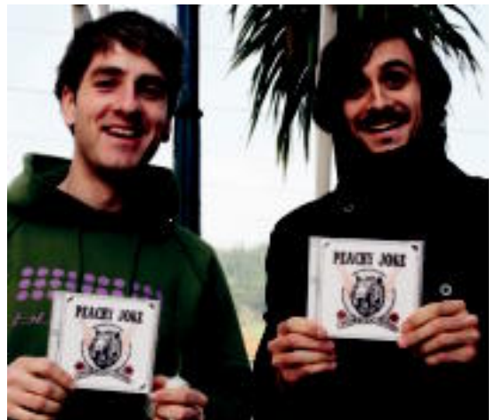
Gere eta Lemy azken lana esku artean dutela. REBEKA CALVO

Tolosaldeko taldeak 'Asian Tiger Mosquito' izeneko hirugarren lana kaleratu berri du 07