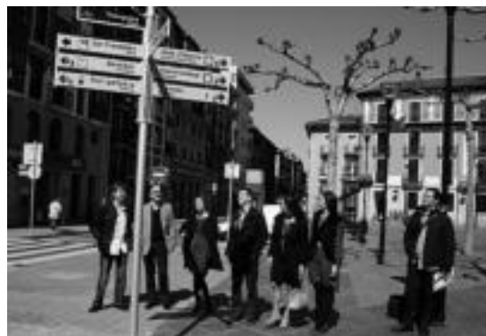
Ekimenaren bultzatzaileak Trianguloako seinalearen aurrean. A.I.