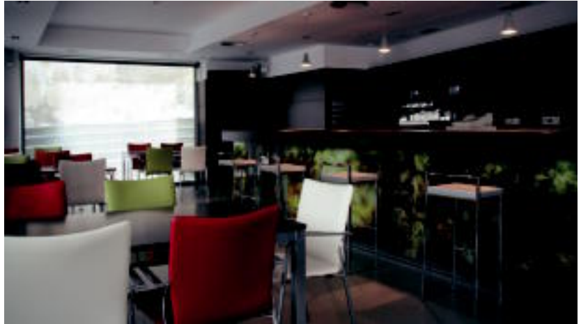
Taberna-jatetxe zerbitzua martxan jartzeko guztia prestatzen ari dira. E. MAIZ

Elkarteko kide guztiek alde pribatua erabiltzeko aukera dute, baina taberna-jatetxe zerbitzua erabiltzeko pixka bat itxaron beharko dute. Arazo batzuk tarteko atzeratu egin da. Hala ere, ahalik eta azkarren saiatuko dira kudeatuko duen arduraduna aukeratzeko; eta honen ardura izango da elkarteak zabalik edukitzea.