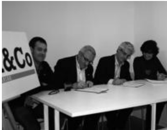
Tolosa & Co-ren egoitzan sinatu zuten hitzarmena. I. URKIZU

Tolosako merkatariek Gipuzkoako Federazioarekin sinatu duten lehen hitzarmena da hau, eta