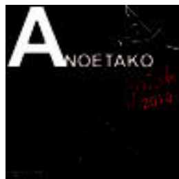
2010eko Anoetako festen kartel lehiaketako irabazlea. HITZA

Kartelaren ondorengo testua agertu behar da: «Anoetako Jaiak 2011». Lanak koloretan aurkeztu behar dira, originalak, eta beste