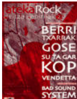
Atekarock jaialdiaren kartela. HITZA

Elkarlanetik jaio, muiskatik eraiki! da leloa. «Herriki sortu den proiektua» baita, eta eraikitzeo musika erabiliko baitute. 2010. urtea amaitu aurretik hasi ziren jaialdia antolatzen. Sarre-rak salgai daude Euskal Herriko