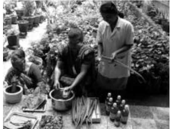
Misio Taldeak India, Ekuador eta Hondurasetan dituzte proiektuak. HITZA

Taldeak hainbat proiektu ditu martxan: Indian, Ekuadorren eta Hondurasetan. Proiektu hauek gauzatu ahal izateko Ibarraren laguntza «paregabea» izaten ari dela diote Misio Taldekoek. Horren adibide, garapen proiektuetarako udalak ematen duen laguntza. Gainera, Gabon egunean eta Santa Ageda bezperan parrokiako kuruak kalez kaleko kantaldietan lortzen duen diruak ere proiektuak aurrera ateratzeko laguntzen diete. Ibarrako merkantuan eta Merkatu Txikian ere eskuratzeko dute babesa emateko beharrezkoa den laguntza. Aurtentz Orona kooperatibak ere egin diete ekarpena. Guzti honez gain, Laskorain Ikastolatik jasotako laguntza; jendeak eskura emandako eskupekoak; ikasketa bekak aurrera eramateko 150 familiaren konpromisoa; hainbat enpresen dohaineko kolaborazioa; eta beste hamaika lani esker lortzen dute beraien proiektuek urtez urte aurrera egitea. Proiektu asko gauzatu dituztelarik.