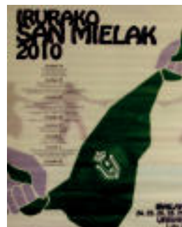
2010eko Irurako festen kartel lehiaketako irabazlea. HITZA

Irurako lehiaketan 15 urtetik gorako edonork parte har dezake. Inprimatutako edozein kolore eta eratako lanak onartuko dira: photoshop, freehand, collagea, pintura, eta abar. Lanen neurriak 42 x