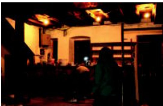
Atekabeltz eraikina berrantolatzen ari dira. M. UGARTEMENDIA

Eraikinean obrak egiten ari dira, eta finantzazioa lortzeko apirilaren 2rako Atekarock Jaialdia antolatu dute ◊4