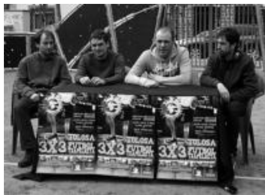
Martxoaren 27an hasiko da 3x3 futbol txapelketa. E. MAIZ

Partidak dauden igandeetan Denak taberna irekiko dute 09:00etatik aurrera.