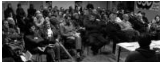
Herritar asko bertaratu zen aurreko bilerara. I. GARCIA