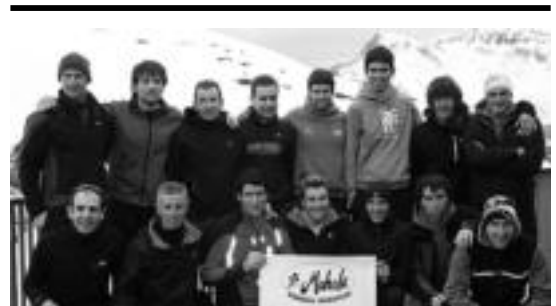
Tolosaldea Triatloi Taldeko partaideak. HITZA