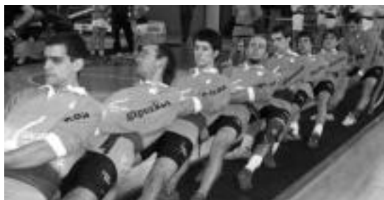
Ibarra taldekoak tiraldi batean, Gernikan.

Emakumezkoen 500 kiloko txapelketan bigarren saioa izan zuten asteburuan, Gernikan. Hiru taldek parte hartzen dute lehiketa horretan. Badaiotz eta Sakana berdinduta gelditu ziren lehen postuan, tiraldi kopuru berdina irabazi baitzuten. Ibarra taldekoak hirugarren egin zuen. Hurrengo asteburuan hirugarren eta azken saioa izango dute.