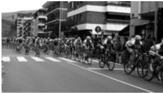
Aiztondo Klasikoan, tropela Villabonako kaleetan zehar. SARA GOMEZ

Adunan hasi eta Villabonan bukatu zen Aiztondo Klasikoa. Sarasola mendatearen jaitsieran erabaki zen. Tarte hori aprobetxatu zuen Pradesek (Tarragona taldea) iheslarien artetik alde egin eta Villabonara segundo batzuen abantailarekin iristeko. 15 segundokoa izan zen lortu zuen tarterik handiena. Helmugan hiru segundo atera zizkion bigarrenari.