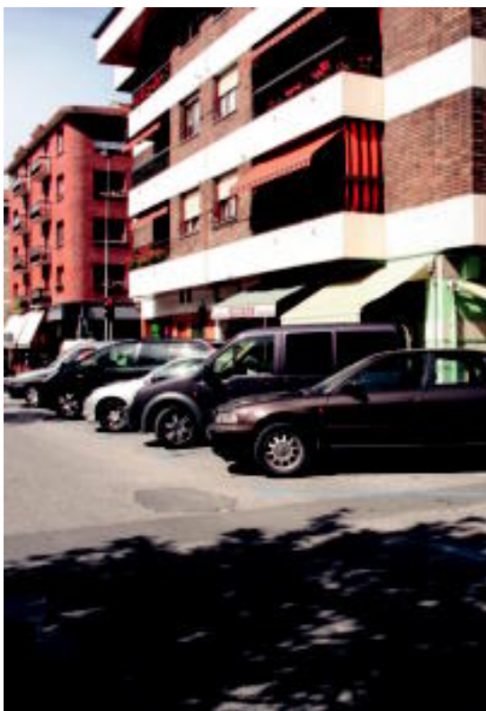
Zenbait tokitan orain autoak baterian jartzen dira.

Bizi kalitatea, segurtasuna eta herria antolatzeko beharra kontutan hartuta hainbat proiektu egiten ari da udala