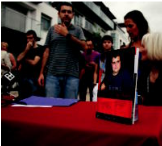
Uztailaren zinegotzi ohiaren omenezko liburua aurkeztu zuten.

etik, Eresargi abesbatzaren 25. urteurrenaren harira, Mikel Urdangarin abeslariarekin eskaini zuten ekitaldia. Uztailaren 28an berriz, gazteak izan ziren protagonista eguerditik aurrera. Kuadrilen arteko baltsa jaietsiera antolatu zuten Onddo Gazte Asanbladako kideek. Arrakasta handia izan zuen ekitaldiak, parte-hartzaile asko eta jende ikaragarri bildu baitzen Oria ibaiaren ertzetara. Ondoren bazkaria izan zuten eta gauen berriz, Lain, Sixty Sexers eta Esne Beltzaren kontzertuak izan ziren.