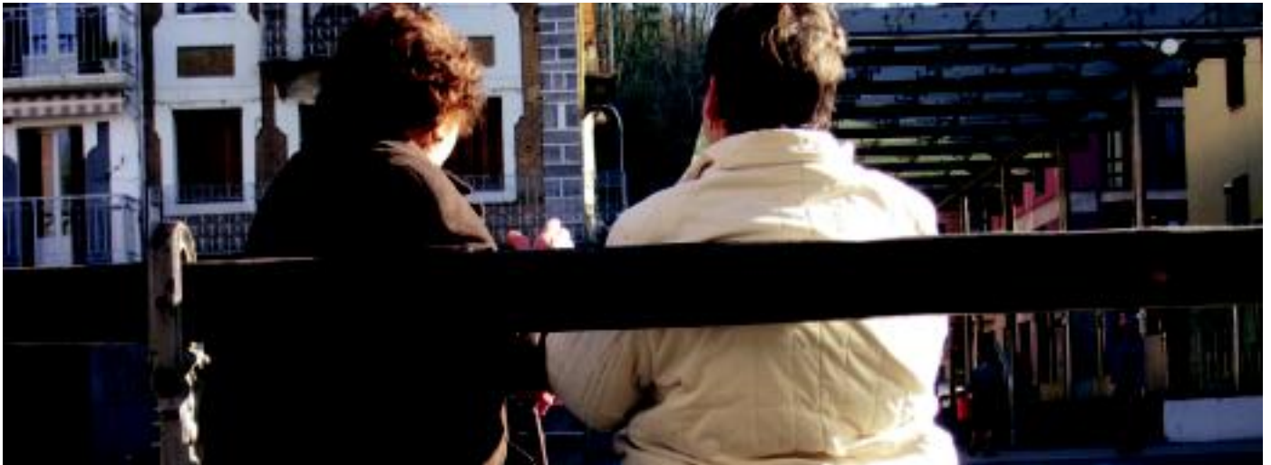
Gizarte Zerbitzuetan inoiz baino lan gehiago dutela diote udaleko arduradunek.

Krisi ekonomikoaren egoeraren harira, udaleko arduradunek lanez leporaino dabilta