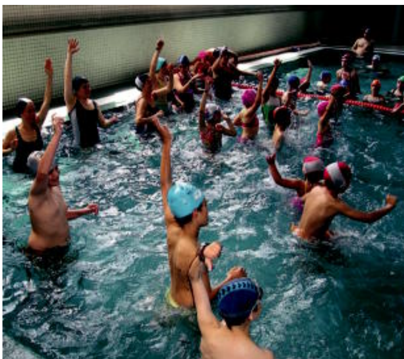
Futbol zelaiaren belar artifiziala jarriko dute. Beheko irudian Olaederrako jardueretako bat ikusi daiteke.