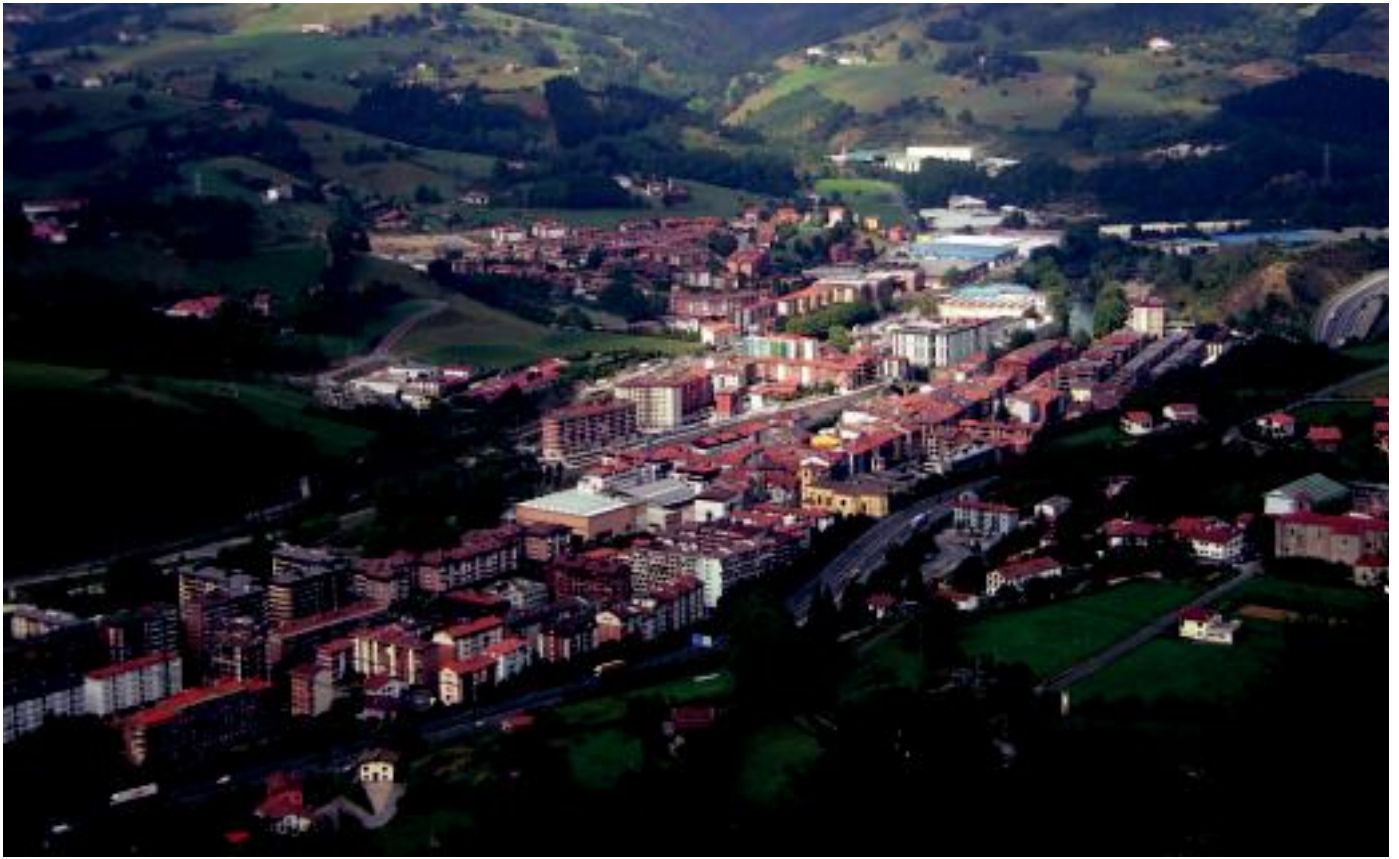
Herrian euskararen erabilera bultzatzeko ari da lanean udala.