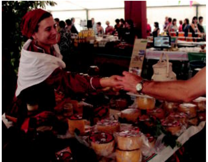
Kontsumo Taldea sortu nahi dute Villabonan; baserriarrak ekoiztutako garaian garaiko barazkiak eskuratzeko aukera eskainiko litzateke.

Udalak bere jardunean natur baliabideak aurreztu eta hondakin sorrera murrizteko pausok eman ditzake eta herritarren aurrean jarrera eredugarria era-