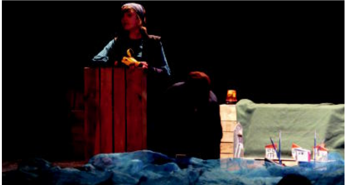
Sinatutako akordioaren haritik Greban gaude antzezlan ikusi ahal izan zen orain gutxi Gurean.

Euskarari bultzada ematen zaiolako, hurrengo urteari begira ere, kultur ordenantzak egitea be-