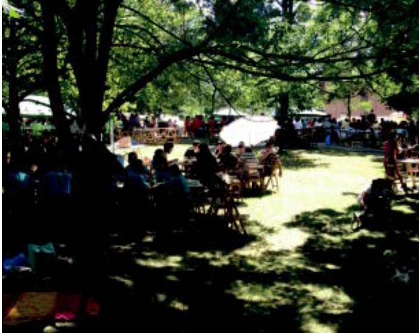
Santio jaietako Koadrila Eguneko bazkariaren irudia; urtero bezala Etxeondoko zuhaitzian bildu ziren.

Villabonan zeresan handia izan du betidanik errebotek eta jaietan ere izan zuten bere lekuri kirol berezi honek plazako frontoian. Aipagarria izan zen, beste-