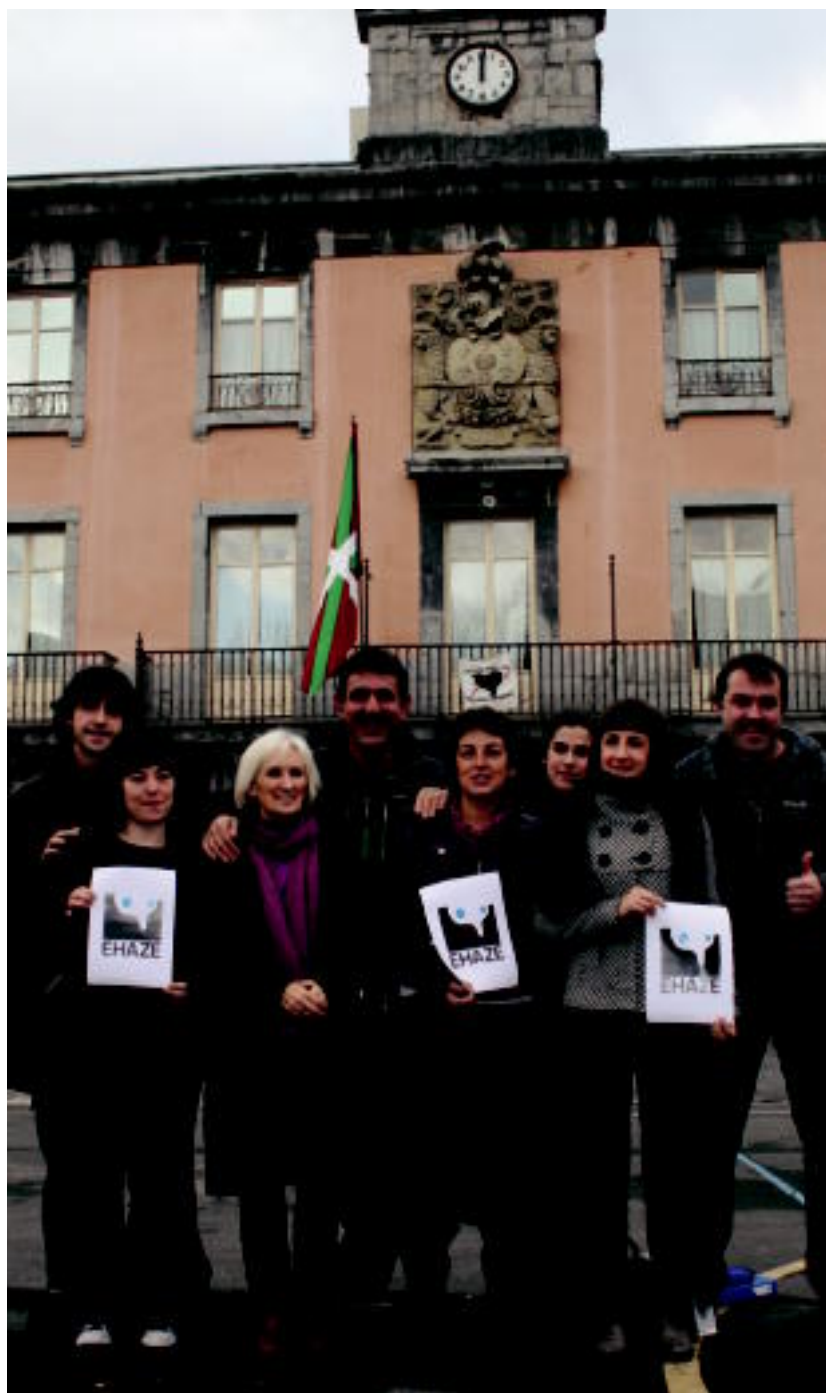
Pasa den urtarrilean sinatu zuten hitzarmena EHAZEko eta udaleko arduradunek.