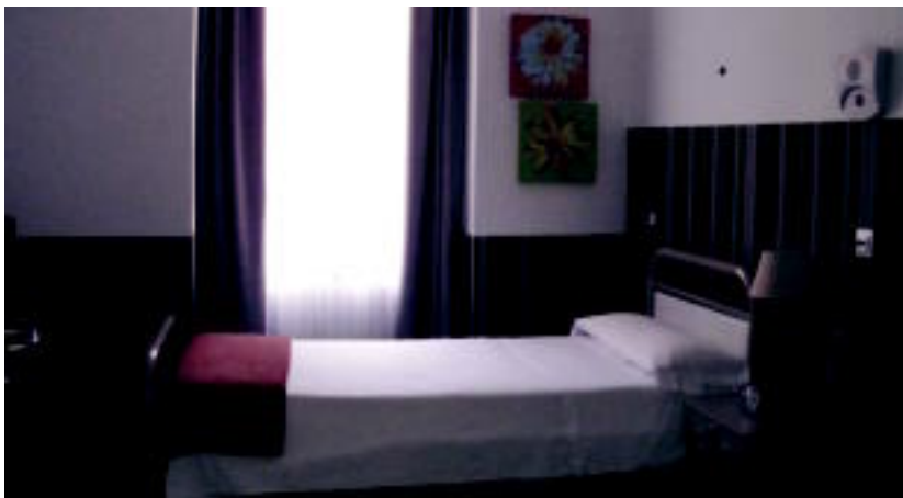
Santiago egoitzan eraberritzen lanetan hiru fase aurrekusi zituzten; bigarren faseari amaiera ematen ari dira.