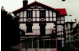
Etiko sursimio eskolaren egin du Gazteleku.

Gazteek aisialdirako eta euren beharrek asetu ahal izateko erakin berria irekitzar dute udaleko arduradunek