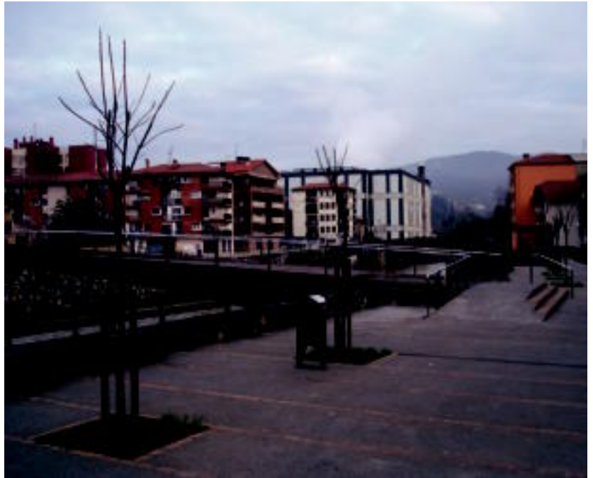
Erriberako pasealeku berriaren irudia.

Giza probetarako ere arrasterako harria agertu zen inguru honetan. Animaliekin frogak egiteko erabiliko ez bada ere, ber-