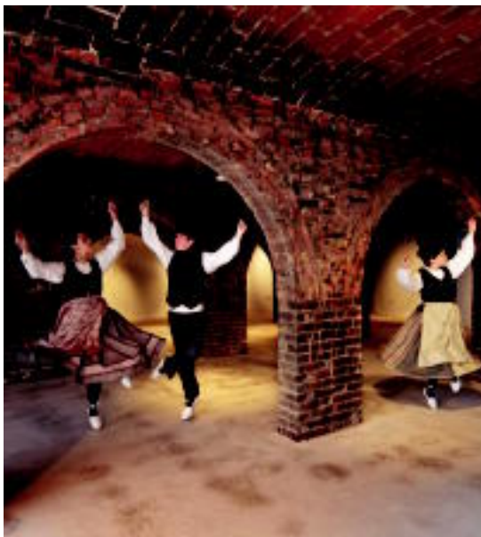
Aljibearen erakusketa desberdinak izan dira, azkena Oinkari dantza taldearena izan da.

Bestetik, diru partida guztian lokal berrira zuzentzea zen. Bigarrenaren aldeko apustua egin zuten adinekoek. Momentu honetan, lanak amaitu dira eta Villabonako adinekoek tabernadun lokal berria dute Salbadora inguruan.