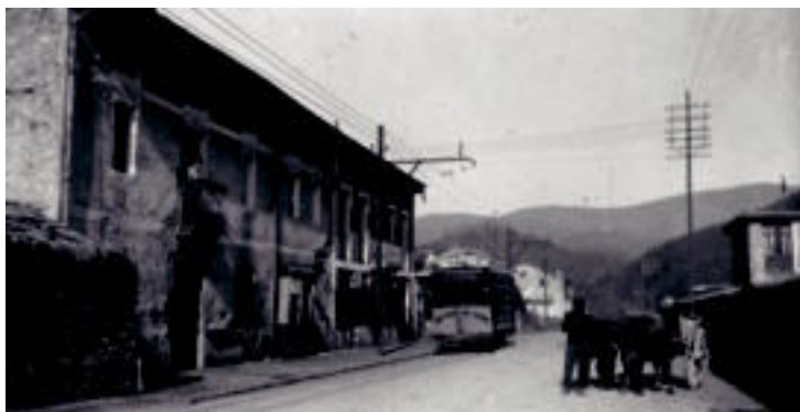
Villabonako garai bateko itxura ikusi daiteke honako argazkietan.