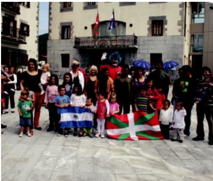
Adunan egin zuten Iaz II. Senidetze Eguna; Villabonako udal ordezkariak izan ziren herritar ugarirekin batera. A. MAZ