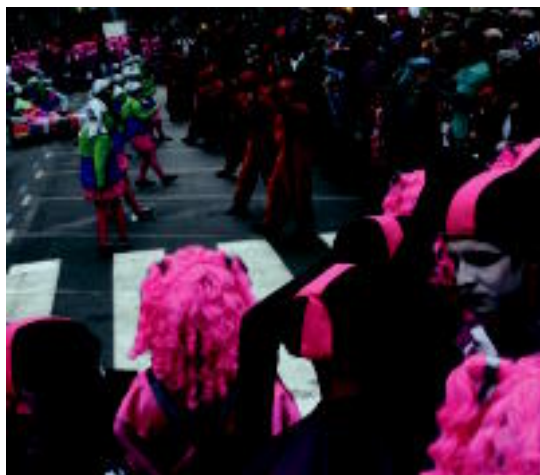
Atsedena taldekoak 101 dalmataz atera ziren, Txiribitukoak tetriseko fitxaz eta Ttenttekoak Panpin etxea irudikatu zuten. R. CALVO-A. IMAZ