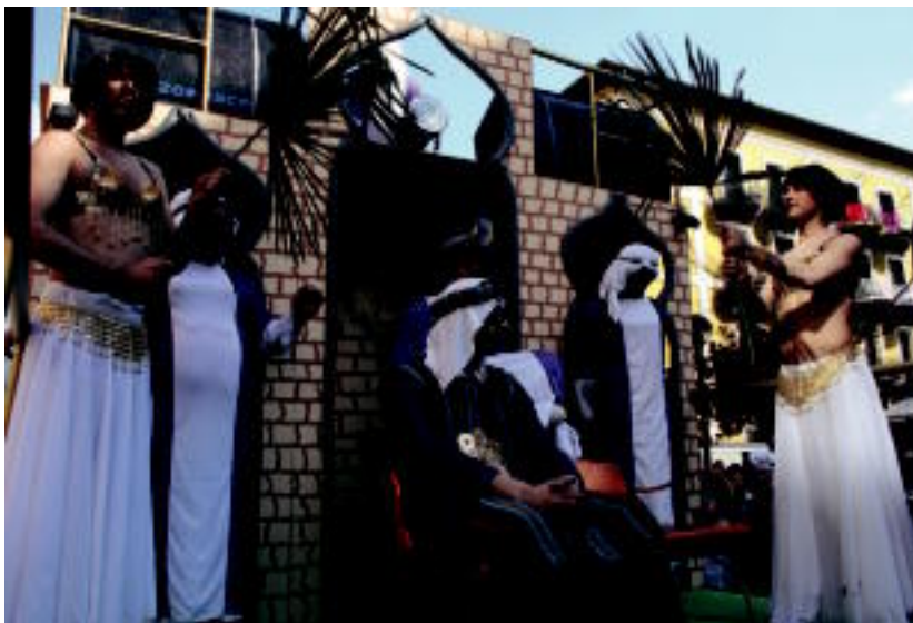
Tolosar ibartar hauek urtetik urtera maila altuagoa erakusten dute, alor guztietan. Ikusgarria. A. IMAZ