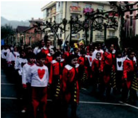
Atsedena eta Kirikiño taldeko gazteak dantzan. R. CALVO