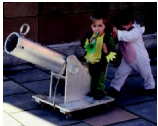
Txiki-txikitatik konpart sarekin, hori bai, lanak hobeto banatu behar dira. I.A