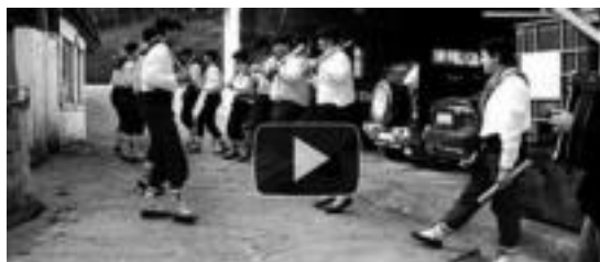
Txantxoaren eta Talaien bideoa 'www.alegaldea.hitza.info' helbidean. HITZA