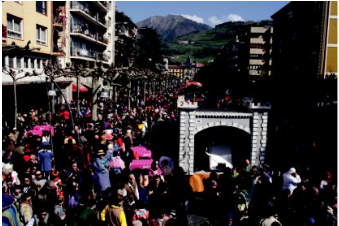
Gehiegi. Jende eta karroza gehiegi elkartu ziren San Frantziskon Zaldunitan. Oinez ibiltzeko eta inguruaz gozatzeko zailtasunak zeuden.

Herenegun ateratako argazki denak jartzea ezinezkoa da, denei argazkiak ateratzea ezinezkoa den bezala. Hala eta guztiz ere, hemen bakan batzuk. Gehiago, www.tolosa.hitza.info-n .