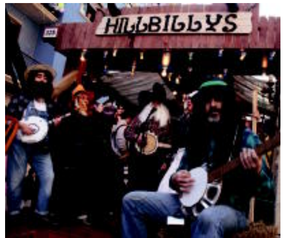
Zuzeneko emanaldiak ikusteko aukera egon zen igandean. A. IMAZ