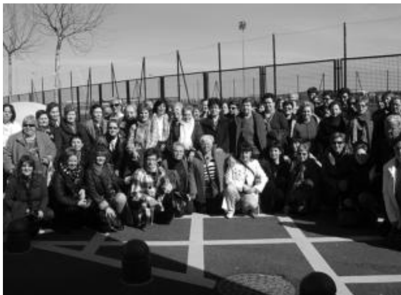
Iaz Emakumearen Eguna zela eta, Zizurkilgo emakumeen egun osoko irteera egin zuten. HITZA

Zizurkilgo ezker abertzaleak Emakumearen Nazioarteko Eguna dela eta «zizurkildar guztiak, bereziki emakumeak, antolatu eta borrokara» deitu ditu, «emakumeak askatasunean bizitzeko eskubidea aldarrikatu» ditzaten.