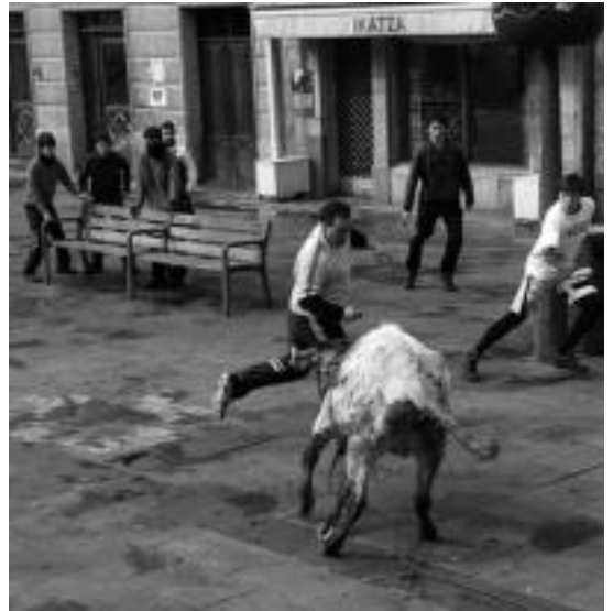
Plaza Berrian sokamuturra eta txaranga ikusteko aukera egon zen atzo goizean. I. GARCIA