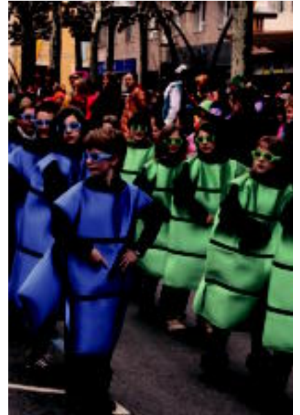
Ttenttekek eta Txiribitu taldekoak; lehenengoak Panpin etxeaz eta besteak, Tetriseko fitxetaz. A. IMAZ-R. CALVO