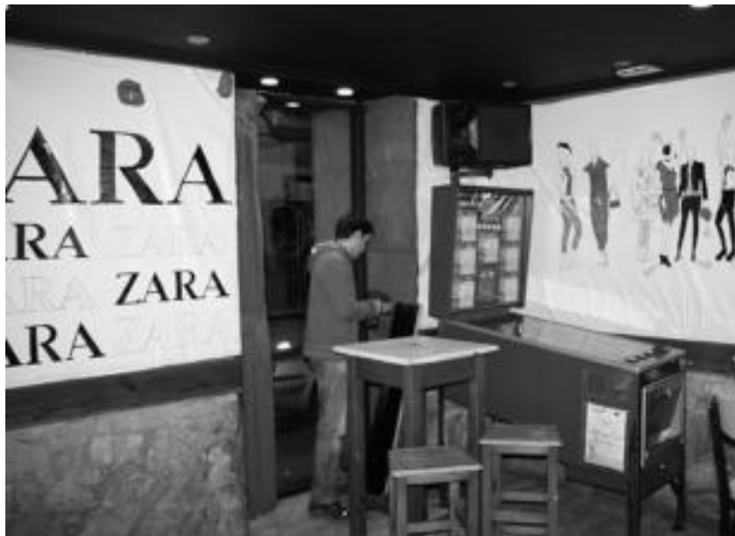
Inauterien aurreko egunetan apainketa lanetan aritu dira Elorri tabernan. I. GARCIA

Langileen aldetik, larunbatean hiru edo lau izaten badira, Inauterietan zortzi aritzen dira eguneroko, batez ere barran. «Sukaldean emaztea aritzen da eta bi edo hiru lagun adina egiten du. Berari laguntzeko pertsona bat hartzen dugu», azaldu du Artutxak. Bestalde, hamabost egun daramatzate prestaketa lanak