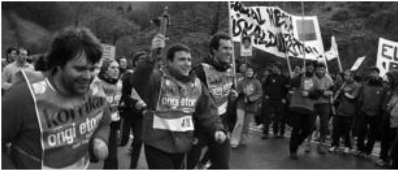
Korrika 17 ez da Leitzaldetik pasako. Duela bi urte, udal ordezkariak lekukoa eraman zuten. ASIER IMAZ