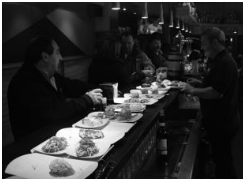
Ikatzan lan handia izaten dute janaria zerbitzatzen. I. GARCIA