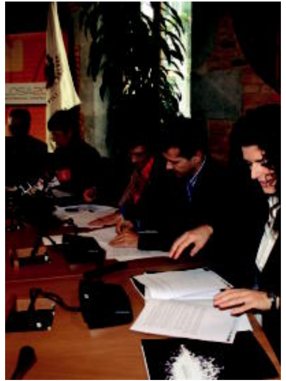
Tolosako Udalak ahozkotasa lantzeko akordioa sinatu ia. I. TERRADILLOS

Prozedura «zorrotza» izan dela esan dute Kontseilutik. Udalak hartutako erabakiak, esleitutako baliabideak eta horien emaitzak aztertzeaz gain, herritarrek euskarazko zerbitzua jasotzeko eta langileek euskaraz lan egiteko eskubideen bermea zein neurritaraino dagoen eta nola gauzatu den neurtu da. «Finean, herrita-