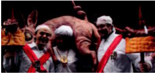
lazio Ostegun Gizenean, korporazioko kideak.

Aurrerantzean urtero egingo dute izendapena txupinazoan, Ostegun Gizeneko korporazioaren eskutik