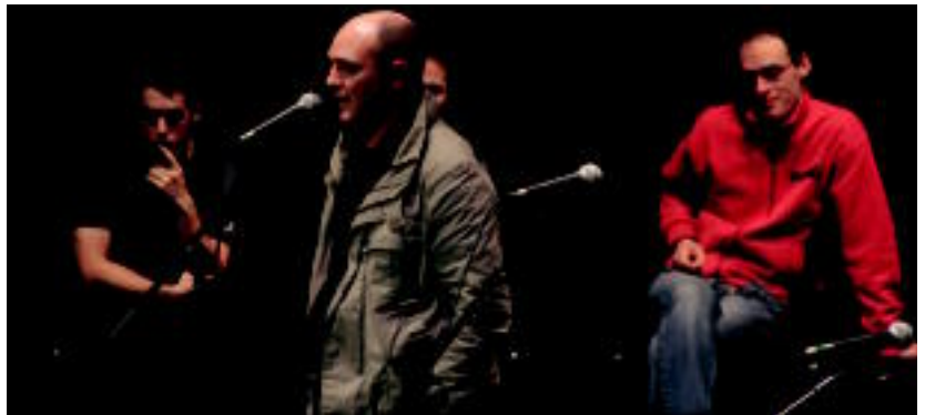
Bertso saio esperimentalaren izango da. HITZA

Hitzaldiak, eztabaidak, bazkaria eta bertso saioa izango dira datorren martxoaren 12an Gurean