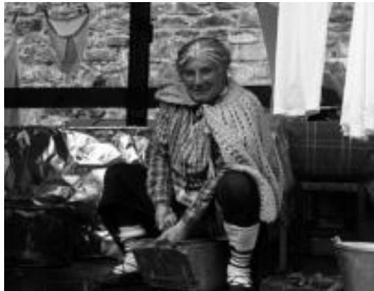
Lizartzarrek oso giro onean pasa dituzte aurtengo Inauteriak. ENERITZ MAIZ

Aldi berean, antolatzaileek eskerrak eman nahi dizkiete base-ritarrei, puska biltzean izandako harrera ona nabarmentzeko izan baita eta beraien eskuzabal-tasunik gabe hau egitea ezinezkoa litzatekeelako. Gainera, aur-