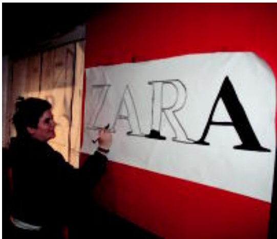
Elorri tabernak Zara dendetako itxura izango du Inauterietan.

Tolosako jaiak kalean bizitzen direla esan ohi da, baina ez dira gutxi orduak taberna zuloetan ematen dituztenak; tabernariak jo eta su ari dira lanean edariak eta giroa prest edukitzeko 03