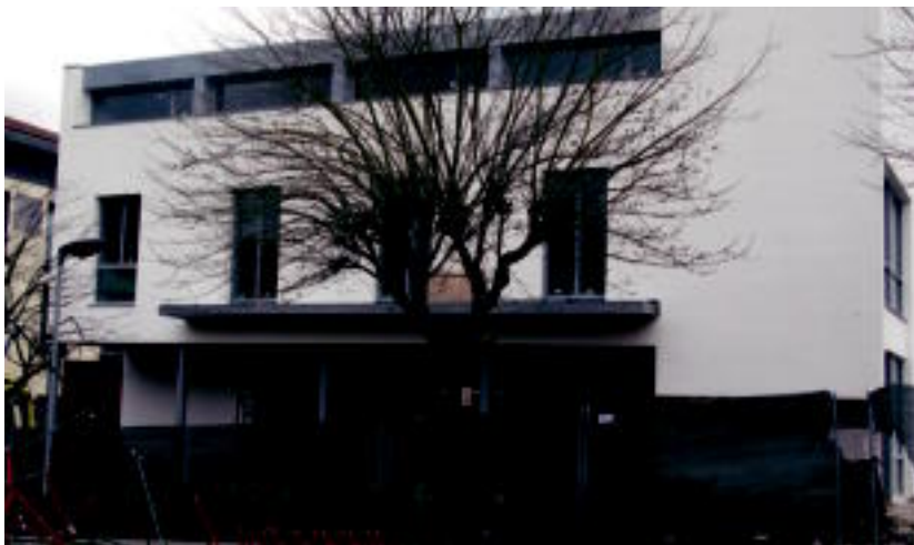
Udaletxe berriaren eraikuntza lanak amaitzen ari dira. Maileguetako bat obra ordaintzeko da. HITZA

Inbertsioetarako hiru mila euro ditu aurten udalak eta Ostatuko argiteriaren potentzia aldatzeko erabili da