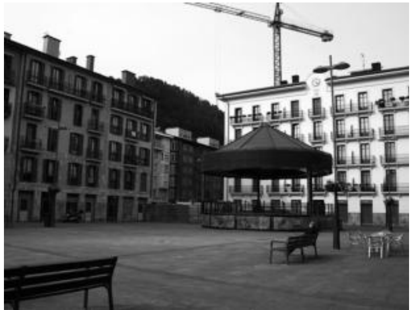
Plaza Berrian dago zozketatuko dituzten hamabost etxebizitzaren eraikina. A. IMAZ

Hamabost etxebizitza hauetatik hamaika lehenengo, bigarren eta hirugarren soilairukoak dira, eta