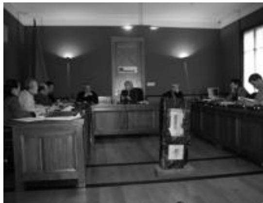
Atzo Ibarrrako Udalan egindako plenoan hainbat gai onartu ziren. MU

Erabilera anitzeko eraikin honetan kokatuko dira 15 eta 20 plaza arteko gaitasuna izango duen eguneko zentroa, gaur egun San