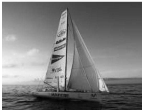
Mapfre ontzia Zeelanda Berrian dabil orain. HITZA