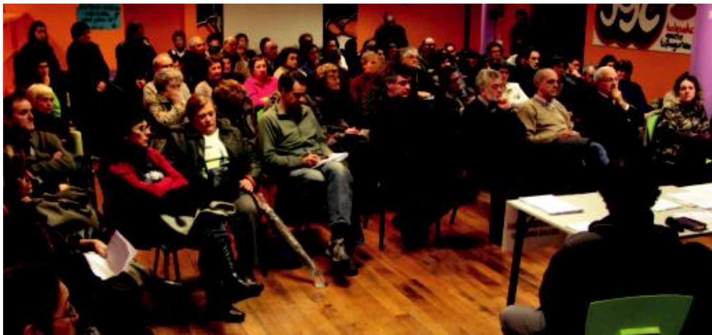
Herritarrak, langileak, udal ordezkariak, sindikatuak,... bildu ziren Tolosan egin zen bileran, asteartean. Bilera oso jendetsua izan zen. I. GARCIA

Asteartean hainbat herritar Tolosako Kultur Etxean bildu ziren. Osasun arloko zerbitzu publikoarekin gertatzen ari denaren berri eman zuten eta honi aurre egiteko koordinakunde bat sortu nahi dute.