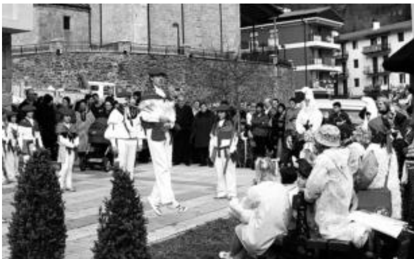
Larunbat honetan, gibela dastatuz emango diete hasiera Inauterietan lizartzarrek. U.