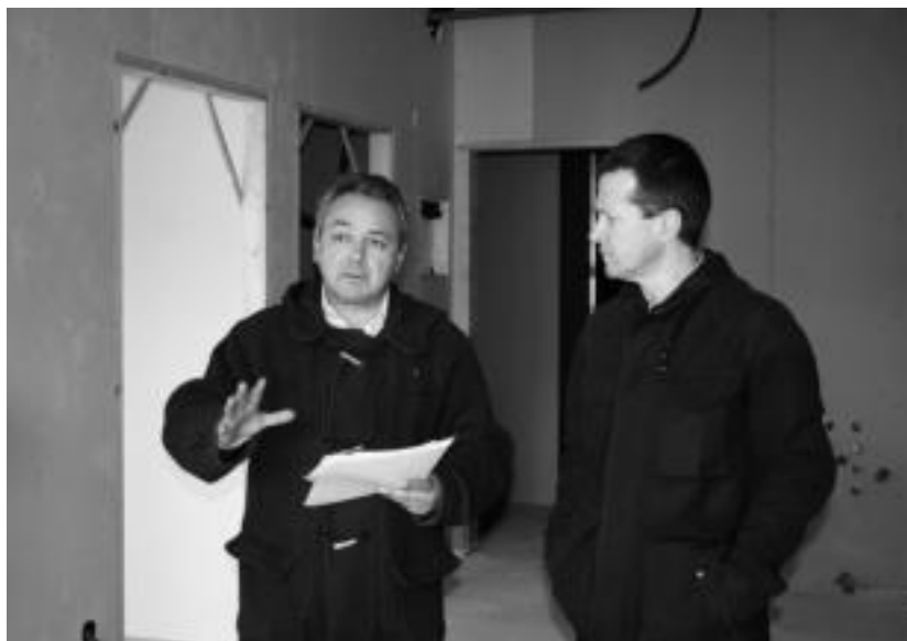
Udal ordezkari eta teknikoak Uzturre asistentzia zentroko apartamentuetan. A. MAZ

Izena ematen dutenek, Tolosan erroldatuta egon beharko dute azken bost urteetan, etenik gabe, edo 10 urte azken 15 urteetan. Azken kasu honetan, urtebeteko antzintasuna izan beharko dute eskaera egiteko garaian. Baldintza