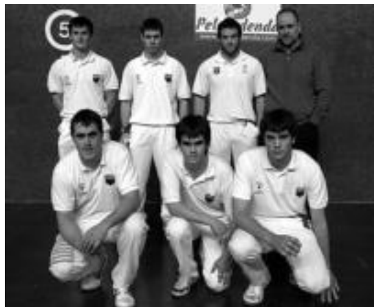
Berria Txapelketako kanporaketa aritu zen Aurrera-Saiazeko taldea. HITZA

Aurrera Saiazeko kadeteak, Mujika-Iruretagoienak, 22-8 irabazi zuten. Jubentleak, Labaka-Arratibeak, eta nagusiek, Narbarte-Telleteak, 22-17 irabazi zituzten beraien partidak.