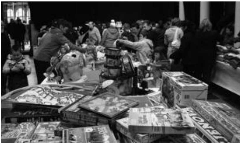
Nikaraguako emakumeen hezkuntza bermatzeko bilduko dute dirua. HITZA