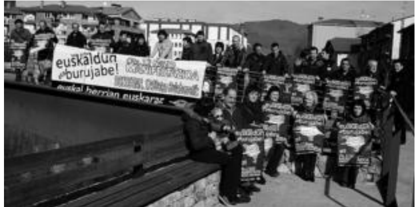
Villabonan, EHE-ek deitutako manifestazioari babesa emateko hainbat herritar elkartu ziren, larunbatean. A. IMAZ

Euskal Herrian Euskaraz hitzetan, «Hizkuntza komunitate