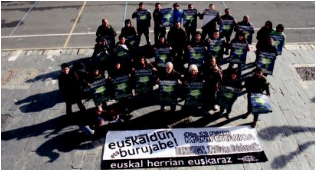
Villabonako Euskal Herrian Euskarazek Donostiako manifestaziora joateko eskatu du. J. A. IMAZ

Asteartea, 2011ko otsailaren 8a. VIII. urtea. 2.170. zenbakia. www.tolosaldea.hitza.info