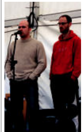
Mendiluze eta Arzallus. ITZEA URKIZU

Atzo amaitu ziren ospakizunak; dantzariak, aizkolariek, bertsolariek eta trikitilariak osatu zuten jaien azken eguneko egitaraua 04