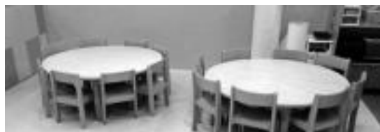
Erbilera anitzeko gelak ere izango dira haurreskolan.