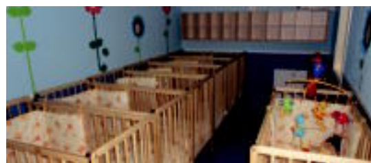
Komunikabideek haurreskola ikusteko aukera izan zuten.

0-2 urte bitarteko 56 haur hasi dira; maiatzean berriro irekiko dute matrikulazio epea 02