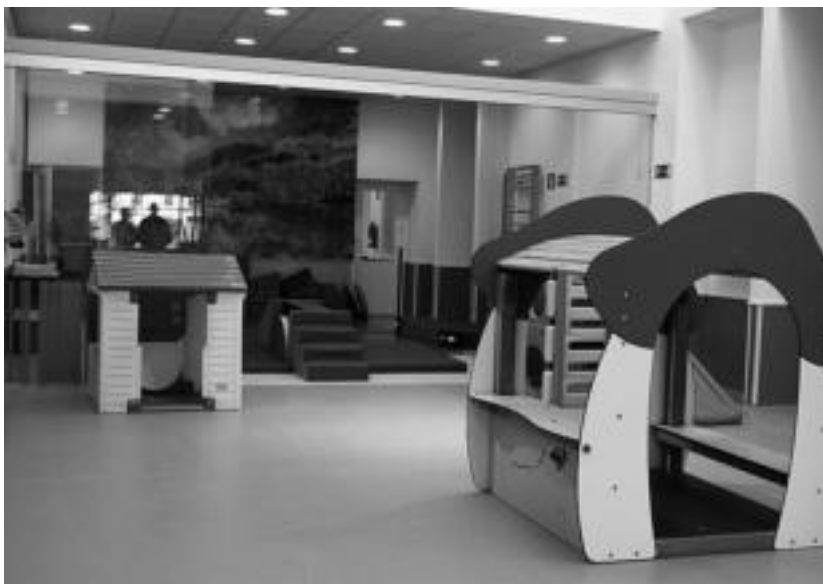
Jolasleku estalia izango du haurreskola berriak. I. URKIZU