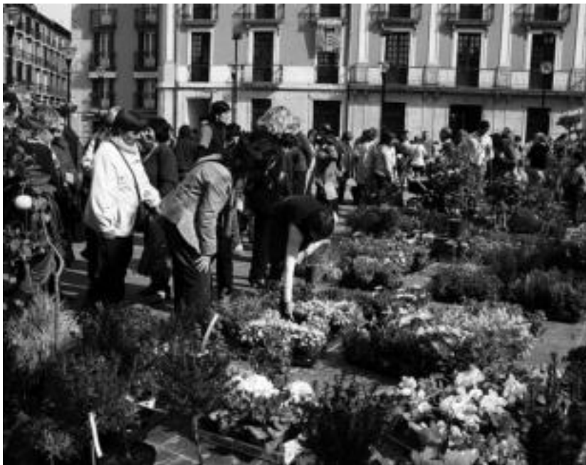
Lore, landare, zuhaixka eta zuhaitz mota desberdinak ikusi ahal izango dira larunbatean.