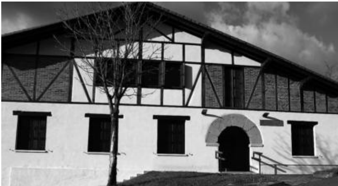
Martintxo barrutik eta kanpotik guztiz berritu dute. M. UGARTEMENDIA