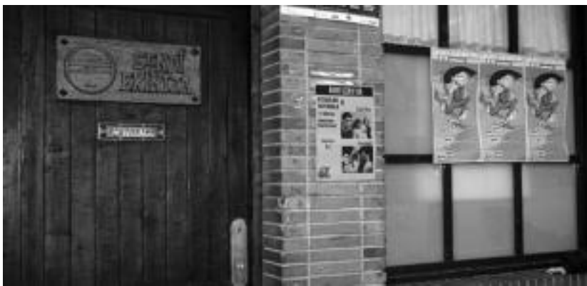
Sendi-Ekintza elkarteak parte hartze handia espero du elkartearen egunean. MUGARTEMENDIA