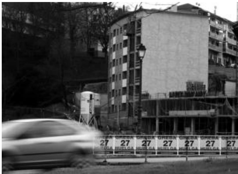
Urtarrilaren 27an, bihar, eskualdea gelditzea espero du euskal gehiengo sindikalak. A. IMAZ

Leitzarrak eta aresoarrak, eguerdian Iruñera deitu dituzte. Arratsaldean berriz, 18:00etan hain zuzen, Leitzako plazatik manifestazioa irtengo da.