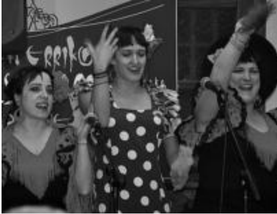
Giro bikaina jarri zuten Andoaingo kanporaketan. HITZA