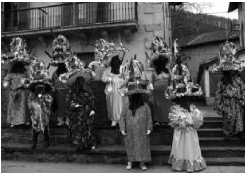
Atsaureak plazan bildu ziren, kalejiran atera aurretik. M. UGARTEMENDIA