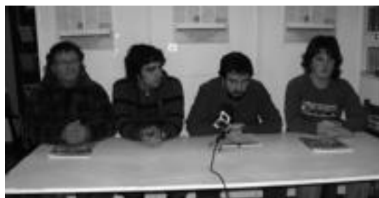
Euskal Herria Sozialista aldirikako kideak Tolosan.