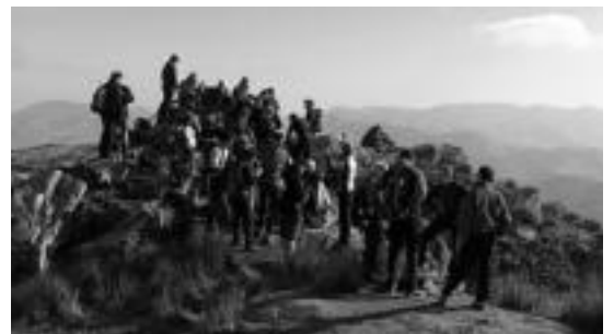
Igandean Sara eta Zugarramurdi izan ziren Arxuria tontorra igaroz. HITZA

Igande honetarako ere prestatua dute ibilbidea, Zubietara joango dira. Goiz pasako ibilbidea prestatu dute. Villabona bertatik irten eta Zubietara joango dira Andatza menditik pasaz. Edozeinek parte har dezake irteera honetan eta nahikoa da 08:30erako Olaederra kiroldegian aurrera inguratzea.