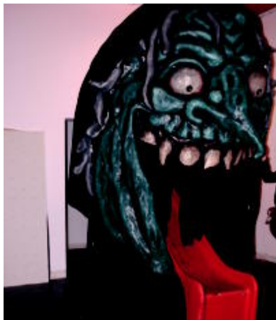
Erakusketarako gargantua hau berreskuratu dute.

Honen harira, otsailaren 5ean deialdi berezia izango da gaztetxentzat. Herriko aisialdi taldeen laguntzaz, Aranburu jauregioko atarian bilduko dira 17:00etan, eta adinaren arabera taldeak egingo dituzte jolasteko. Amaitzeko, meriendatxoa banatuko zaie parte hartzaile guztiei.