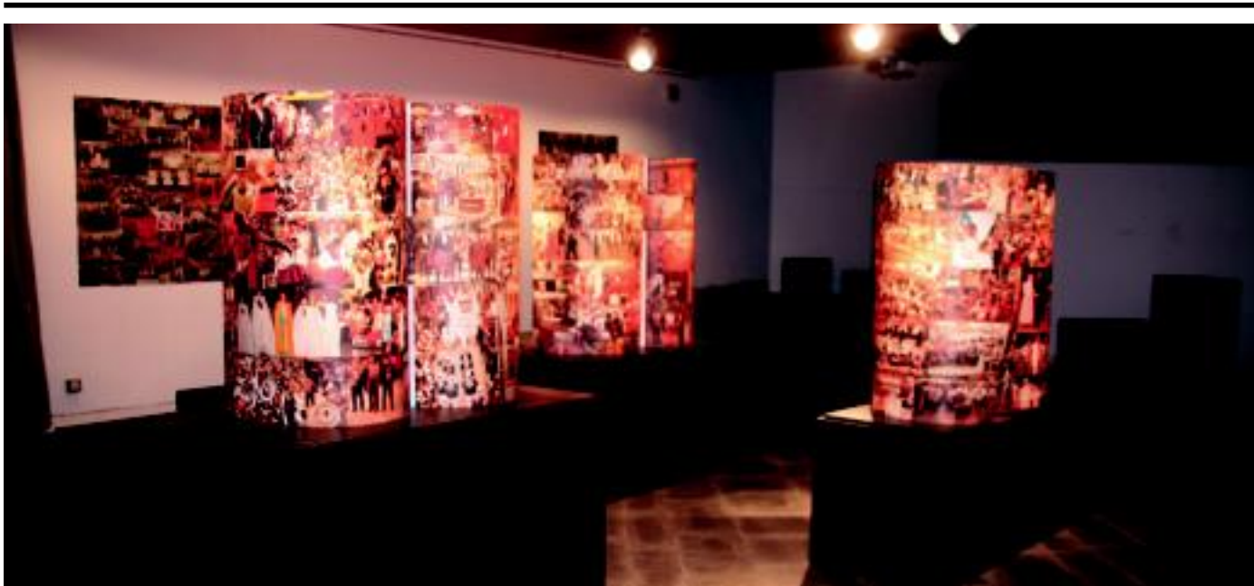
Erakusketako argazkiak euskarri desberdinetan ikusi ahal izango dira. | URKIZU