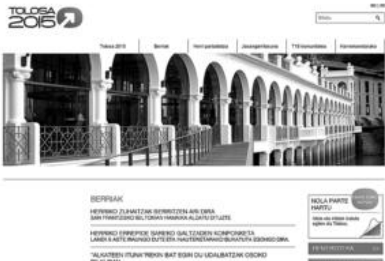
Webgune berriak honako itxura izango du hemendik aurrera. HITZA

Bidali Curriculum Vitae zehatza, urtarrilaren 28a baino lehen, gizabaliabideak@arduna.net helbide elektronikora. Ez ahaztu erreferentzia zehatzea.