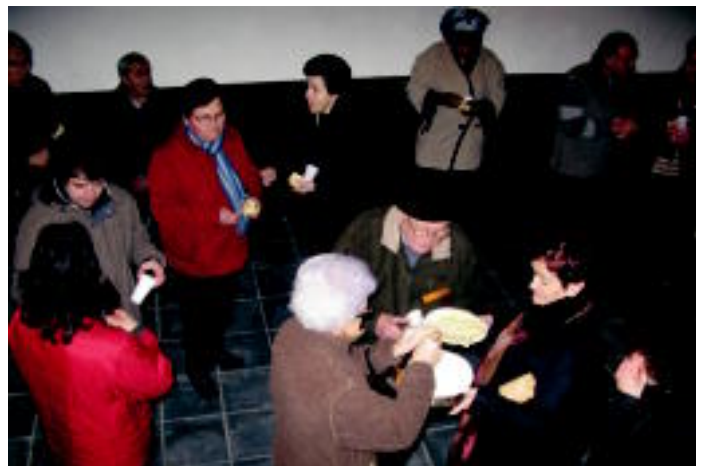
Golan , Leaburuko dantzariak emanaldia eskaintzen. Erdian , Orendainen San Sebastian doinuarekin bandera astintzen. Behean ezkerretan , berastegiarrak meza entzuten. Eta, behean eskuinean , berrobitarrak mokadutxo bat jaten ermitan. MAIER UGARTEMENDIA

Mezak eta mokadutxoak izan ziren San Sebastian eguneko protagonista eskualdeko herrietan