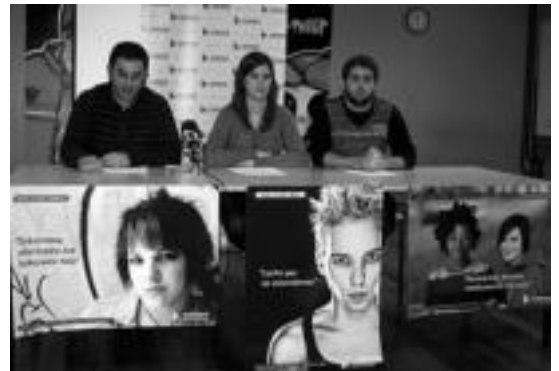
Aralar alderdiko Iratzarri gazte erakunde kideak.

Azken atxiloketak hizpide Atxiloketak «onarte zintzat» jo ditu Iratzarrik. Horrekin batera, bihar Iruñean egingo den manifestaziora joatea eskatu dute.