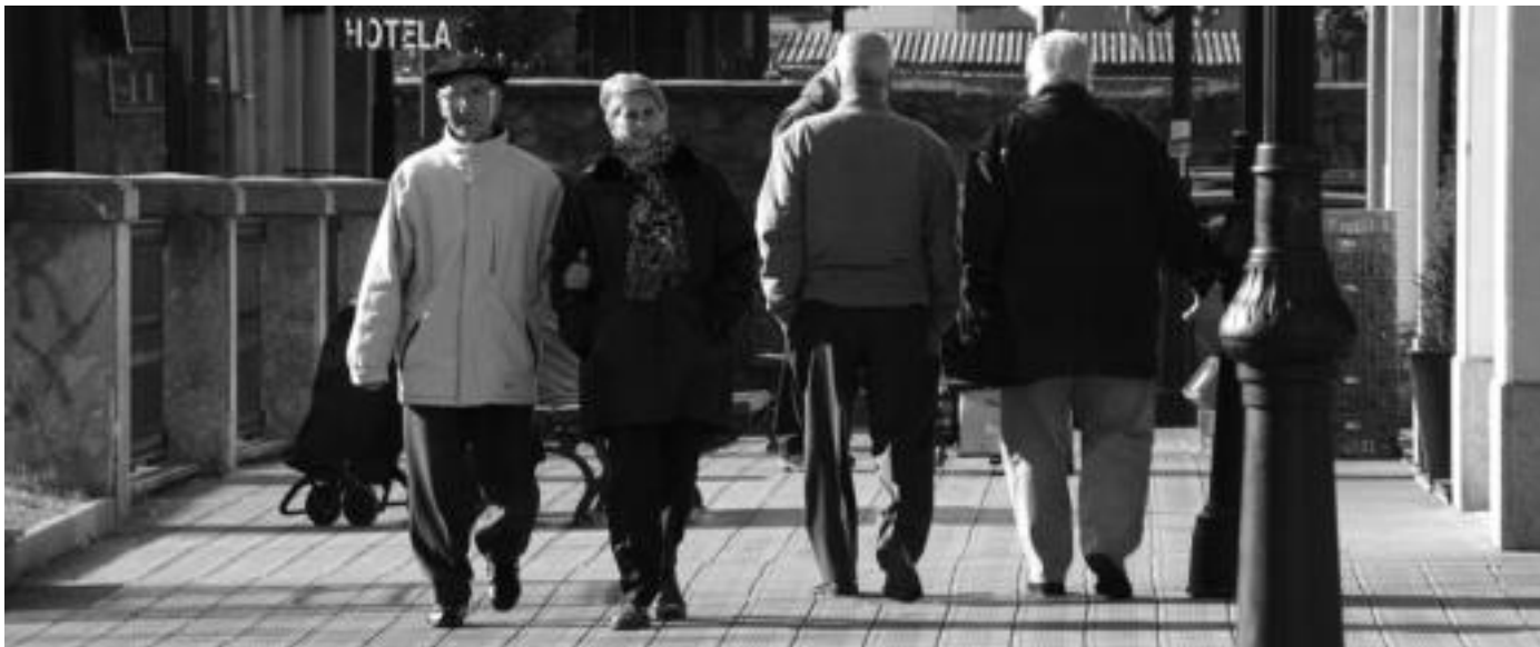
Espainiako Gobernuak hilaren 28an pentsioen erreforma onartzen badu, besteak beste, 67 urtera arte atzeratuko dute jubilatzeko adina. E. MAIZ