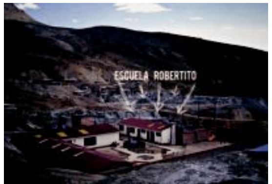
Boliviako Robertito eskola Cerro Ricon dago kokatua. HITZA

Lortutako dirua nagusiki bi proiektu laguntzeko bideratuko dute. Alde batetik, 200 euro, duela urte bat inguru Haitin gertatutako lurrikaran kaltetutako herritarrei laguntzeko, eta bestetik, beste horrenbeste, Boliviako Escuela Robertito egitasmoa bultzatzeko. Honez, gain, sobratzen den diruarekin, merienda egiten dute.