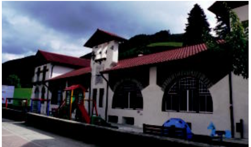
Estilo kolonialeko eraikina da Aresoko herri eskola; 1922an izan zen eraikia. HITZA

Abenduaren 28ko 823/2010 Ebazpenaren arabera, Nazabal Haur eta Lehen Hezkuntzako Ikastetxe Publikoa da orain.