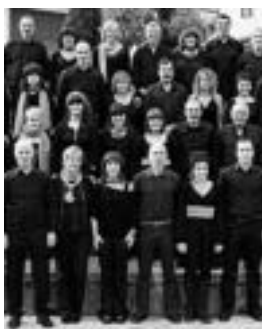
Txintzarri abesbatza. E.ARRAYET

Bide batez, elkarteko bazkide egin nahi izanez gero, koruko kideren batekin harremanetan jarri edota kultur etxeko postontzian eskaera uztea besterik ez da egin behar.