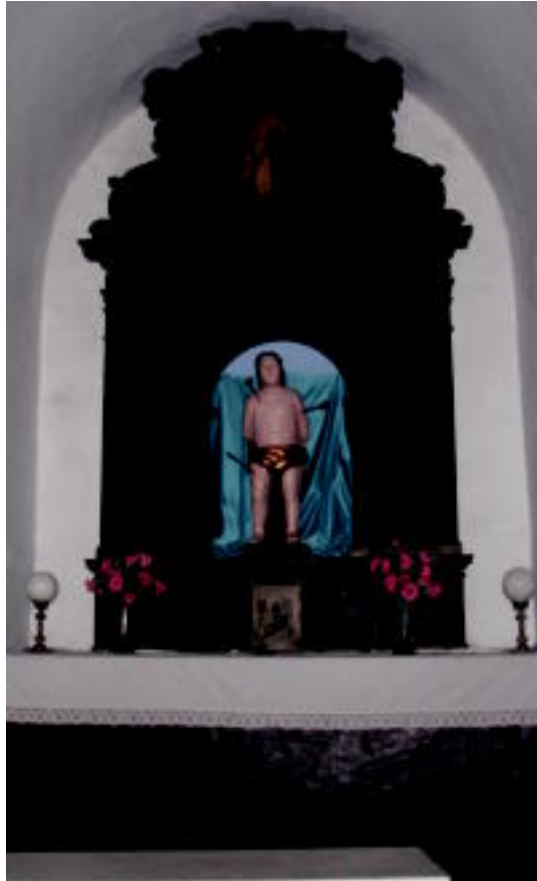
San Sebastian santuaren irudi berria dute Berrobin. MU

Leaburun ere ospatuko dute santuaren eguna. 17:30ean meza izango dute San Sebastian ermitan. Ondoren, herriko dantzariak emanaldia eskainiko dute ermitaren kanpoan. Bukatzeko, afari-