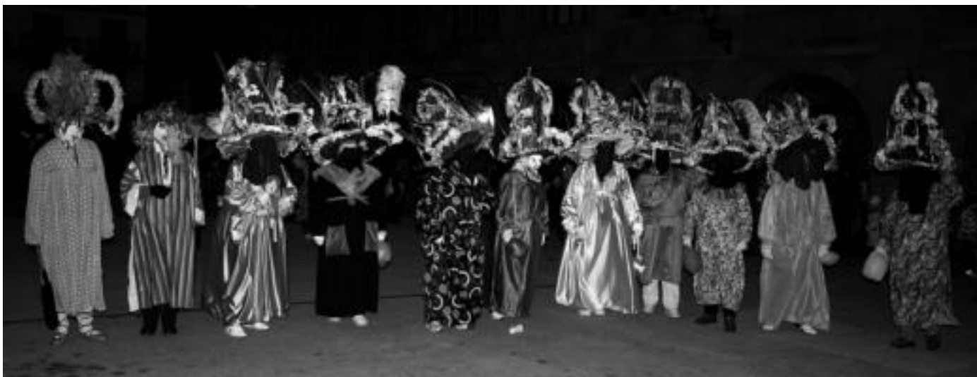
Iazko Ihoteetan kalejiran atera ziren hainbat lagun bertako atsaureak jantzita. A. IMAZ