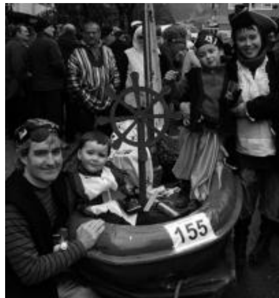
Iazko Inauterietako konpartsen irudia. A. MAZ