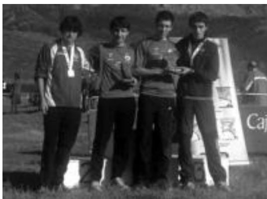
Junior mutilak Euskadiko txapeldunak gelditu ziren. HITZA