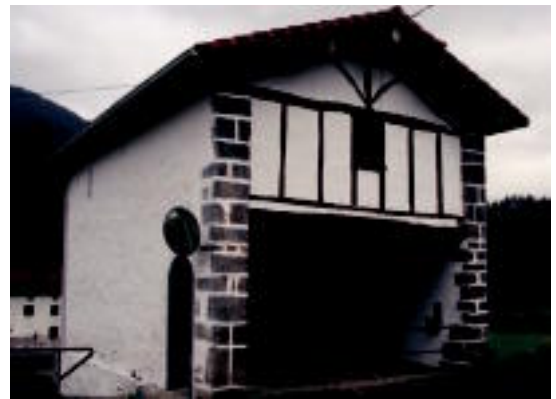
Ermita kanpotik eta barrutik berritu dute. MU

Ospakizunez betetako eguna izango da biharkoa Tolosaldean. Gipuzkoako herri askotan du San Sebastianek basiliza, eta horren erakusle dira eskualdean hainbat herritan dauden ermita ezberdinak.