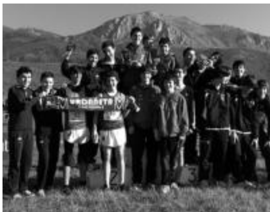
Kadete mutilak Euskadiko txapeldun gelditu ziren. HITZA