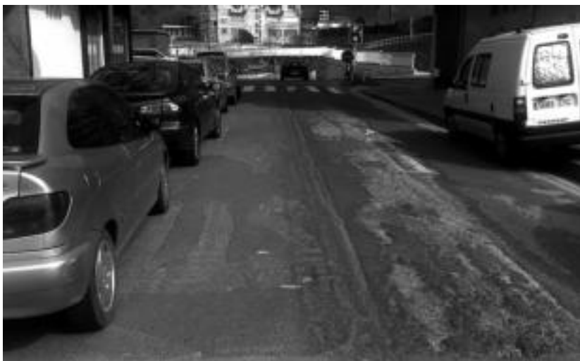
Araba etorbidearen sarrerako errepidean dauden zuloak tapatuko dituzte datozen asteetan.