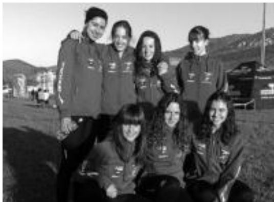
Kadete neskek Euskadiko hirugarrenak gelditu ziren. HITZA

Hemendik aurrera, neguko gailontzeko txapelketak jokatuko dira. Tolosa CF taldeko arduradunek emaitza bikainekin jarraitzea espero dute, kirolarien lana txalotzearekin batera.