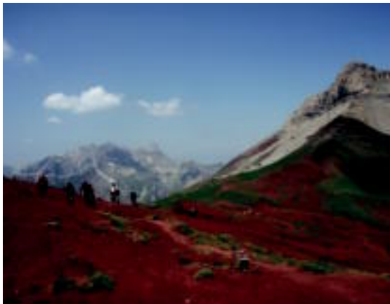
laz uztailean Aizkardioko Ozaiko oihanetik abiatu ziren Castillo de Atxer (2.384 m) gailurrera igotzeko.

Talde batzuek hilean behin egiten dute irteera, besteak hilean ez. Urteko lehen eguna kenduta, Alpino Uzturre, Oargi, Aizkardi eta Sagainek, igande honetan dute lehen irteera. Eta hurrengo