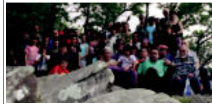
laz Mendibil mendi taldekoek Irusko Trikuharrien Inguruen egun zuten itzulia.