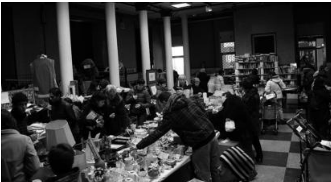
Merkatu Txikia hamalau egunetan zehar zabalik egon da Tolosako kultur etxean, Gabonetan. I. TERRADILLOS