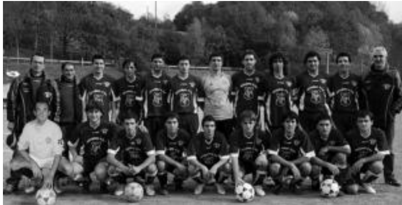
Intxurreko lehen taldearen jokalariek eta prestatzaileak. HITZA

Zorte pixka batekin bigarren itzulian egoerari buelta ematea lortuko dutela azaltzen dute. «Ez ditugu oso urrutiko mailari eusteko postuak», diote. Garmendiak gai-