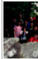
laz Mendibil mendi taldekoek Irusko Trikuharrien Inguruen egun zuten itzulia.