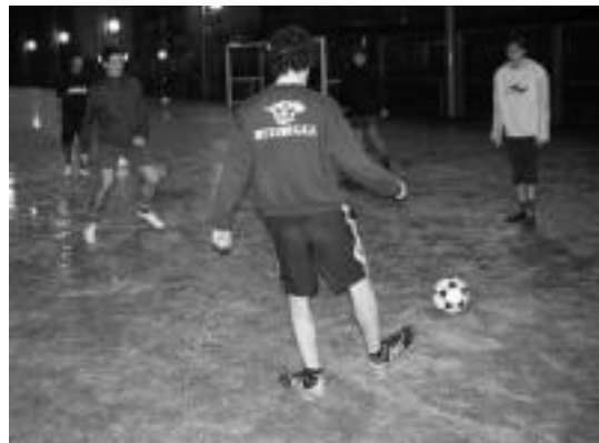
Talde nagusiko zenbait jokalariek entrenamendu batean. I. GARCIA

Bestalde, «jendeak konpromiso gutxi hartzen du, entrenatzeko eta. Nahiago dute areto futbolean