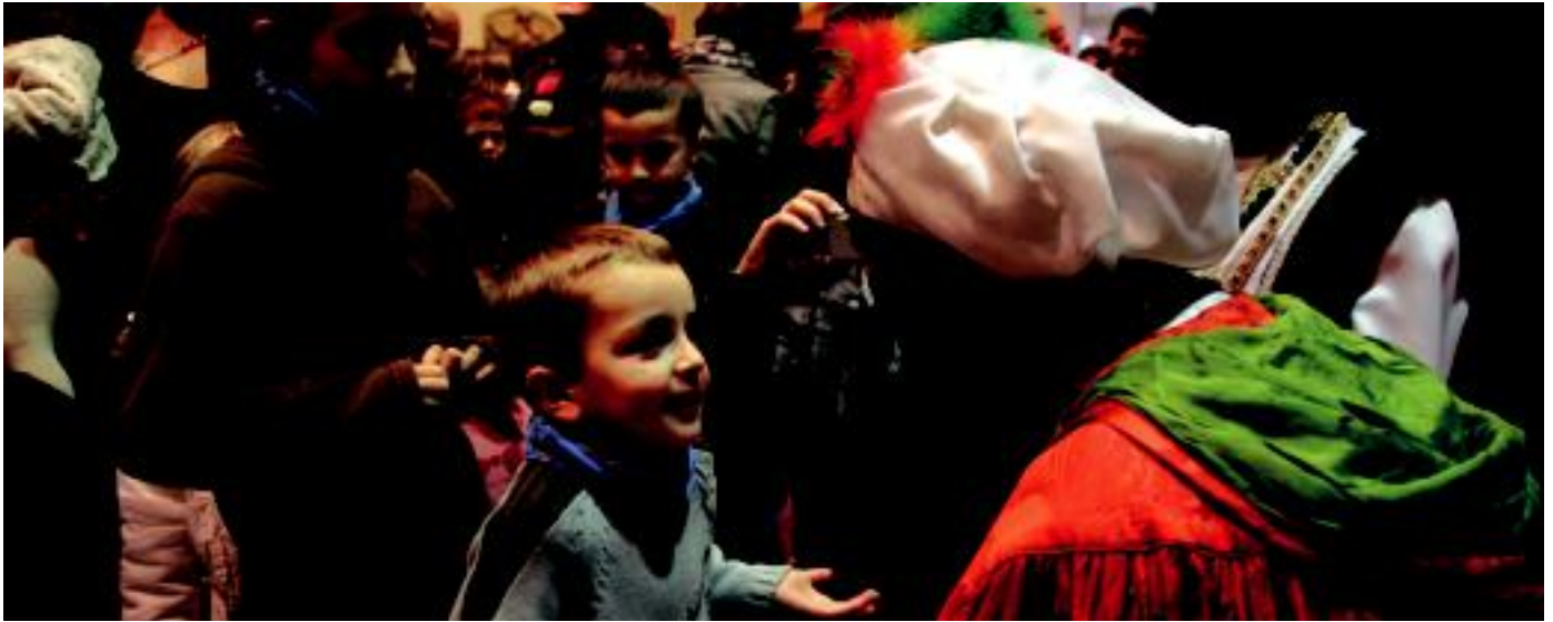
Hiru Erregeak, urtero bezala, Tolosako lurreamendi egoitzara joan ziren arratsaldean. Iluntzean berriz, Tolosako kaleetan ibili ziren. I.TERRADILLOS

Osteguna, 2011ko urtarrilaren 6a. VIII. urtea. 2.153. zenbakia. www.tolosaldea.hitza.info