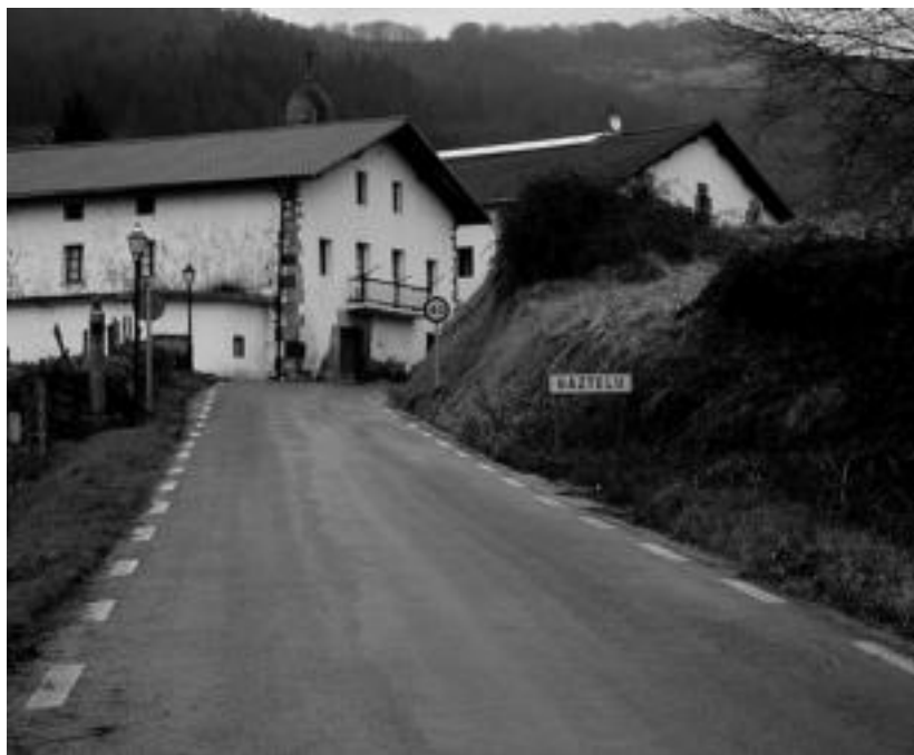
Gaztelu inguruetan hiru txakur hil ziren iragan astean, pozoinduta.

Euskal Herri osoan jokatu-ko dituzte partidak. Eskualdean ere lehia ugari izango dira. Villabonan hilaren 7an, 19:00etan; Zizurkilan egun berean, baina 20:00etan; Iruako trinketean hilaren 7an, 20:15ean, hilaren 8an 09:15ean eta 15:00etan eta hilaren 9an 09:15ean; Bidegoianen hilaren 8an, 16:00etan eta Ikaztegietan egun eta ordu berean.