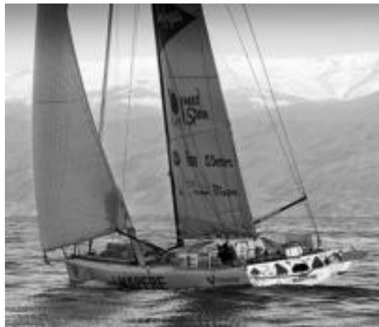
Mapfre ontzia Mediterraneoan zeharkatzen.

Atzo zeharkatu zuten Gibraltargo itsasarte eta orain Atlantikoan dira; Virbac-Paprec 3 doa sailkapeneko buru