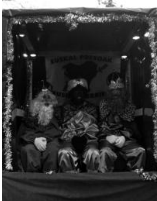
Gurdi gainean zeharkatu zuten herria Orexan. IT.

Beste irudia Zizurkilen topatu ahal da, izan ere, atzo denborarik ez eta gaur igaroko dira bertatik errege magoak. 11:00etako mezan izango dira, eta hau bukatzean, zimiterioan opariak banatuko dizkiete txikienei. Ondoren, Fraisorora joango dira, eta han ere opariak banatuko dituzte. Kasu honetan, bertako egoiliarrei.