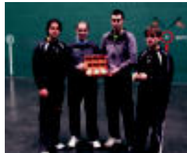
Lau pilotariak aukeratuak pilotekin Beotibarren. I. Iruia

106 eta 105,3 gramokoak bereiztu zituzten. Bi bikoteek lehen partida galduta egon zuten. Beotibarren 18:30ean hasita, lehen partida Promozio Binarako BSB Txapelketako finalaurrene-