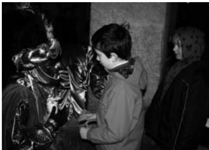
Berastegin, opari bana eman zien bertako haurrei eta gozokiak banatu zituzten. E.EZEIZA