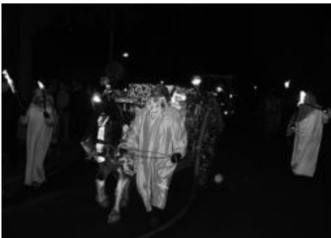
Gettoki aldetik, pajeeekin eta atzetik opariz betetako karroa zutela etorri ziren erregeak. E.MAIZ