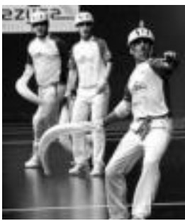
Zeberio II.ak gaur jokatuko du. HITZA