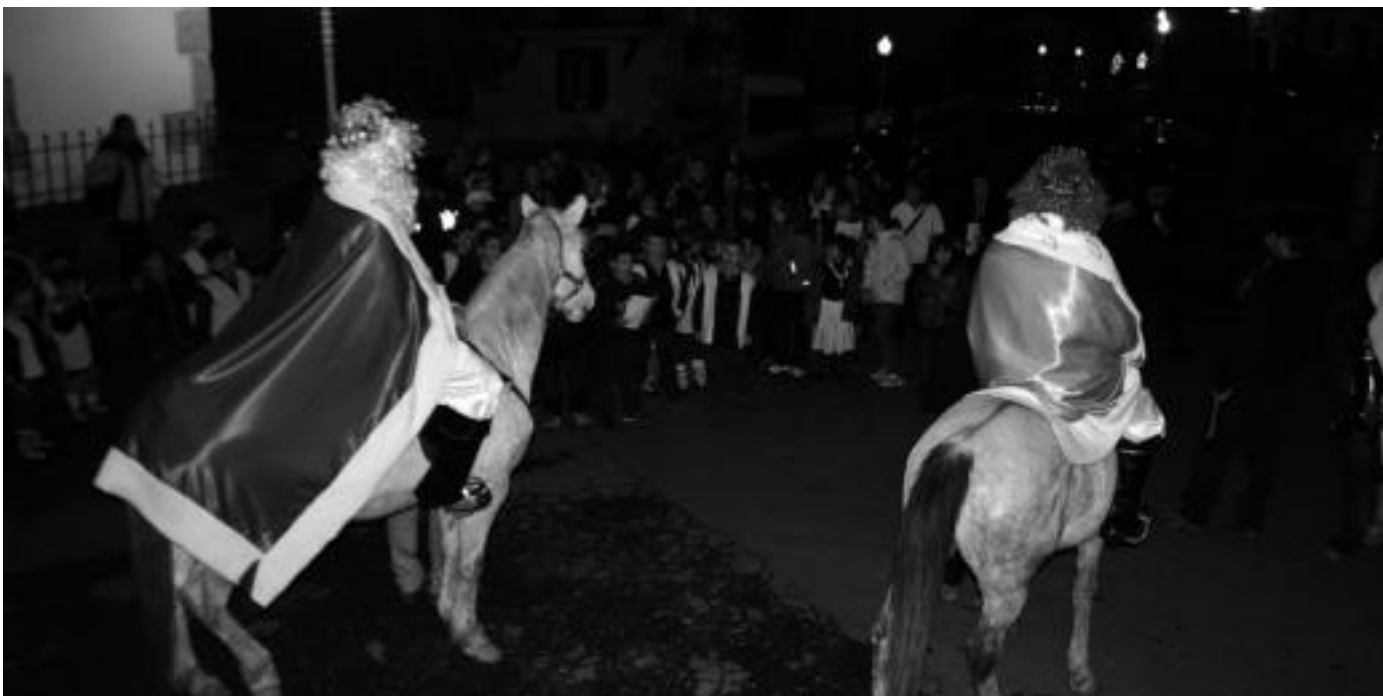
Elizaren aurrealdean errege magoei abestu zieten Amezketako gaztetxoek. Bertatik frontoirako bidea egin zuten zaldiz. I.GARCIA