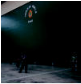
Atzo jokatuak finalaren une bat. HITZA

Gazteira hamalau bikote aurkeztu ziren txapelketan parte hartzeko. Bikote bakotza neska batez eta mutil batez osatuta egon behar zuten. Kanporaketak eta finalerdia 15 tanatarak jokatu zituzten herenegun.