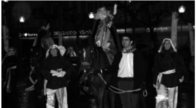
Tolosan laguntzaile ugari izango dituzte Meltxor, Gaspar eta Baltasarrek. NOELIA LATABURU

Jada ezagunak dira Errege Magoentzat Alegia, Amezketa, Anoeta, Areso, Asteasu, Berastegi, Berrobi, Bidegoian, Irura, Larrraul, Leitza, Lizartza, Oresa, Tolosa eta Villabonako haurrak. Ur-