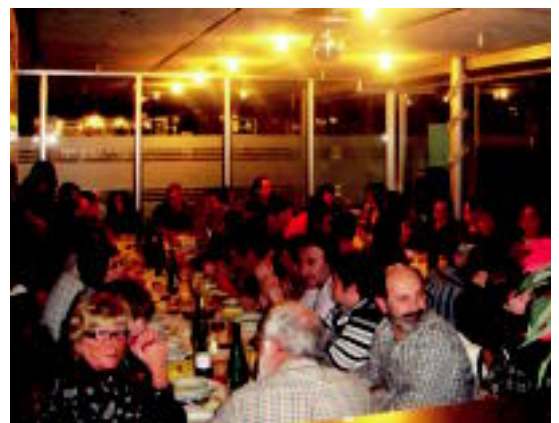
Gure Txokoa Oroituz izan zuten afariko argazkia. HITZA

Igandean Euskal Herriko Mus Txapelketaren barneko kanporaketa burutuko da Anoetan. Kuku Elkartean izango da eta 17:00etan hasiko da. Izena 16:00etatik aurrera elkartean emango da. Bikote bakoitzak 20 euroko izen-ematea ordaindu beharko du. Eskualde mailako txapelketara pasako dira lehen postuetan gelditzen direnak. Lehengo bikoteari txuleta pareta eta bigarren bikoteari untxi pareta oparituko zaizkio.