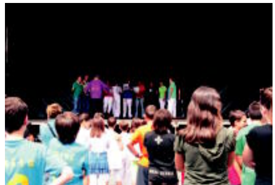
Abesbatzak azken festetan eskaintako emanaldia. E.MAIZ