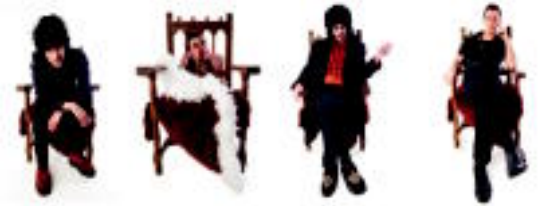
Lobo Electrico 23:30etik aurrera ariko da. HITZA

Lehenengoek Anoetako Cheyennen joko dute eta beste hiruak Villbonako Kantinan 5