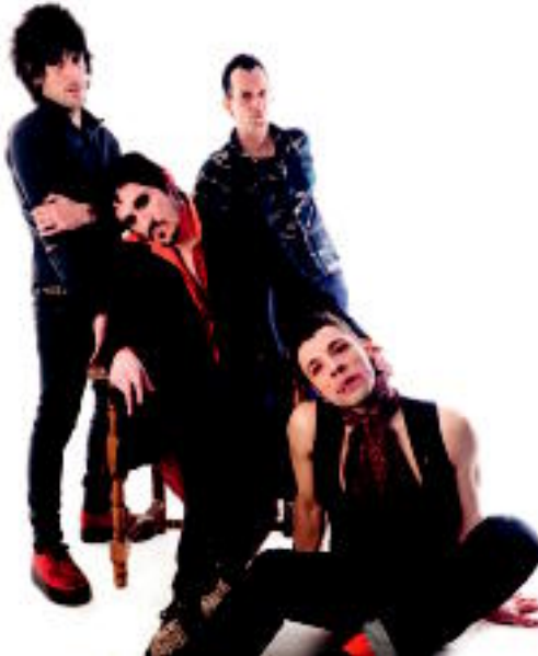
Lobo Electrico taldea osatzen duten lau kideak. HITZA

Talde tolosarrak kaleratu duen bigarren diskoa du. Sirius Magma , Perrolobo , Iki Peligro eta Guanche ezizenez ezagutzen diren taldekideak. Kontzertu dibertigarriak egiten saiatzen dira eta zuzenean entzutea bezalakorik ez dago.