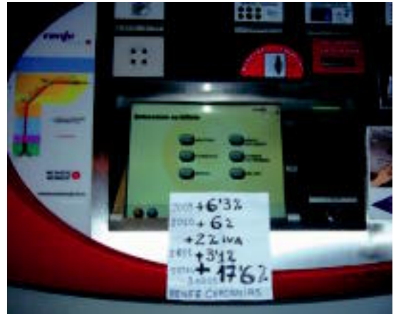
Eguzkik aldiriko trenen salneurria igo dela salatu du.

«Igoera gainera, diskriminatzailerik da erabiltzaile 'aberatsak', hau da, abiadura handiko trenen erabiltzaileek, %2,3ko igoera izango baitute, aldiriko trenen igoera baino baxuagoa dena, 2009an eta 2010ean gertatu zena», gaineratu dute.