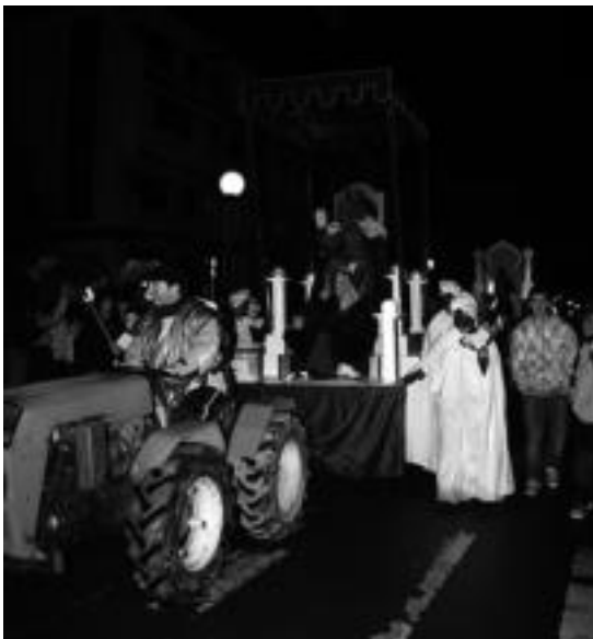
Amasatik Villabonara jaitsiko dira Erregeak, ia traktorean. E.MAIZ

Bestetik Tolosa & Co merkataritza enpresa antolatutako ekimenen baitan, Bonberenea txarangakoak Tolosako kaleetatik barrena ibili ziren. Bestalde, 'Goenkale' telesailaren grabaketak ez du atsedetik hartu Eguberrien eta grabatzen aritu ziren atzo Tolosan. E.MAIZ