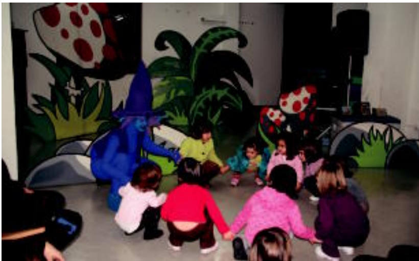
Adunan Xurdirin ipotxaren bisita izan zuten atzokoan. E.MAIZ

Tolosan erraldoien, Musika Bandaren, txistularien, soinu-joleen eta dultzaineroen laguntza izango dute; Jaiotzen Lehiaketa ere izango da 6-7