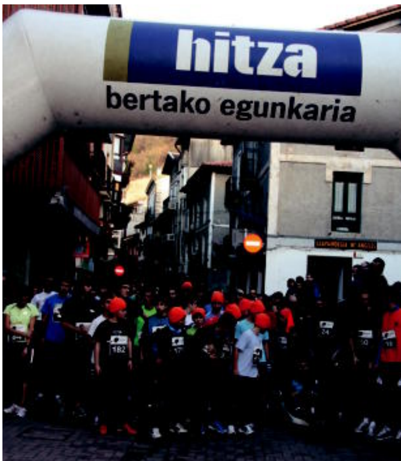
Alegian lehen aldiz egin zuten Urtezaharreko krosa. PATXI RENOBALES

Asteartea, 2011ko urtarrilaren 4a. VIII. urtea. 2.151. zenbakia. www.tolosaldea.hitza.info