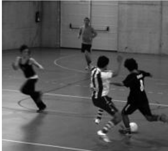
Bost eta zortzi lagun arteko taldeak aritu ziren lehen.

Partida motxen ligaxka izan zen, neska nahiz mutilekin osatutako taldeen artean jokaturakoa. Bestalde, antolatzaileen aurreikuspenak bete ziren, 7-8 taldek izena emango zutela espero baitzuten.