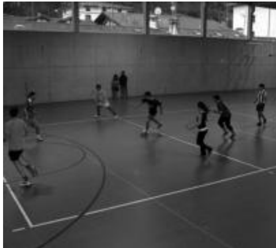
Denera zazpi taldek hartu zuten parte Futbito Maratoian. E. EZEIZA