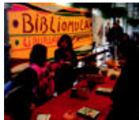
Bildutako dirua Kolonbiara bidartuko dute. LAGAZA