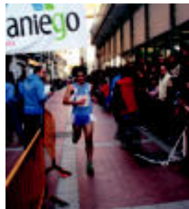
Tolosako lehen lasterkaria helmugara iristen.