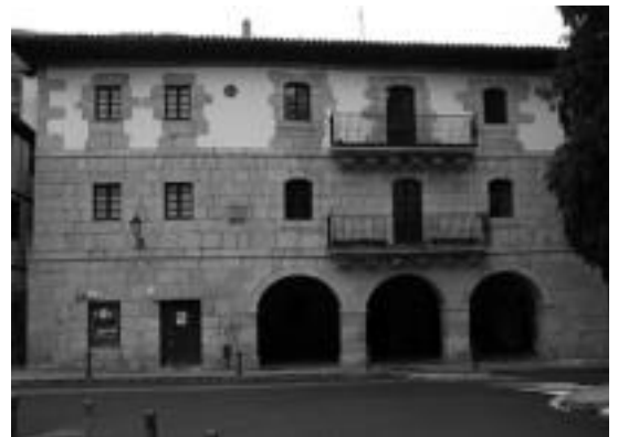
Herri Ostatu udaletxearen azpiko solairuan dago. I. GARCIA

Ostatuaren arduraren hartzearen nahia bere negozioa izatea izan da. «Beti egon naiz beste batzuei negozioak irekitzen laguntzen edo besteentzako sukaldean aritu naiz eta nire kontura zerbait hartzeko gogoan nuen. Albizturko jatetxea ikusi nuenean gustatu zitzaidan eta gainera ikusi nuen babarrunarekin mugimendua dagoela eta bezeroen zati bat ziurtatuta dagoela».