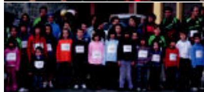
Alikiza, Berastegi eta Lizartza lasterketetan inbaditu geratu zirenak edota parte-hartzaileak. MTA