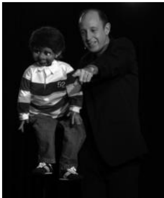
Elvi sabel hiztunak egindako saioaren une bat. E. EZEIZA

Tolosan Gazte Astearen baitan makillaje ikastaroa egin zuten. Oinarriko aholkuak eman zituzten ikastaroko begiraleek. Gaurkorako 40 lagun inguru joango dira autobusean euskal selekzioaren partida ikustera Bilbora.