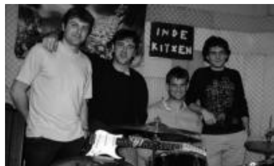
Indekitzen taldeko kideak. ESTI ZEIZA

Kontakizun honetan, pertsonaia bakoitzak maitasuna, jakintza edota familia bezalako bizitzeko funtsezko bertuteak nola bilatzen dituen ikusi ahaliko da. Emanaldia 4 eta 11 urte bitarteko haurrentzat eta familientzat da aproposa. Hurrek 4 euro ordaindu beharko dute, eta helduek 7.