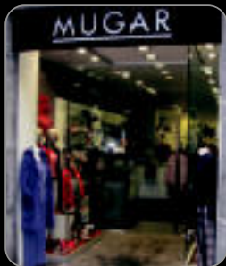
Egin zure erosketak Mugarren

→ Aspertzeko astirik ez. Eguberriak direla eta etxeko txikienek jai dute egun hauetan, baina ez dute aspertzeko denborarik izango. Izan ere, Anoeta, Ibarra, Irura eta Tolosa bezalako herrietan ekitaldi ugari antolatu dituzte txikienezako. Irudian Ibarrrako kultur etxeko atzoko Elvi sabel hitzunaren emanaldia ikusi daiteke. 5