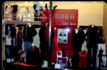
Opari praktikook Mugarren

Nafarroa etorb. 16 • Tel.: 943 65 56 85 Pablo Gorosabel, 28 • Tel.: 943 65 40 37 TOLOSA