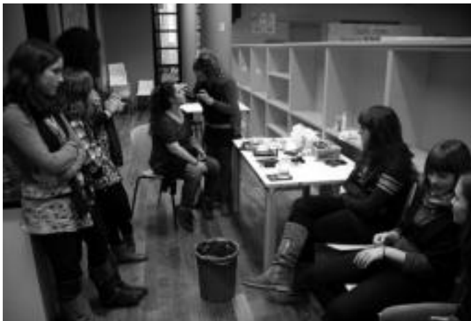
Tolosaldeko Topagunean makillaje ikastaroa egin zuten. I. GARCIA