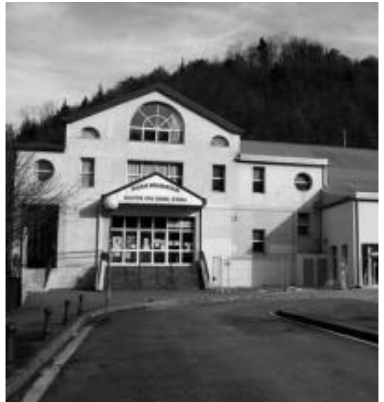
Segituan hasiko dira Kultur etxean berokuntza sistema berria jartzen. E.MAZ

«Laburbilduz, aurreko bi urteetan igoerei eutsi nahi izan genien, 2009an KPIa denetan eta zaborrarak %10 eta ia igoerarik ez (KPIa ere ez)», azaldu du alkateak. «Ur kontsumoa egokia izate aldera gutxien erabiltzen dutenei, eta behar gehiago dutenei gutxiago kobratzea hobetsi dugun», gaineratu du alkateak.