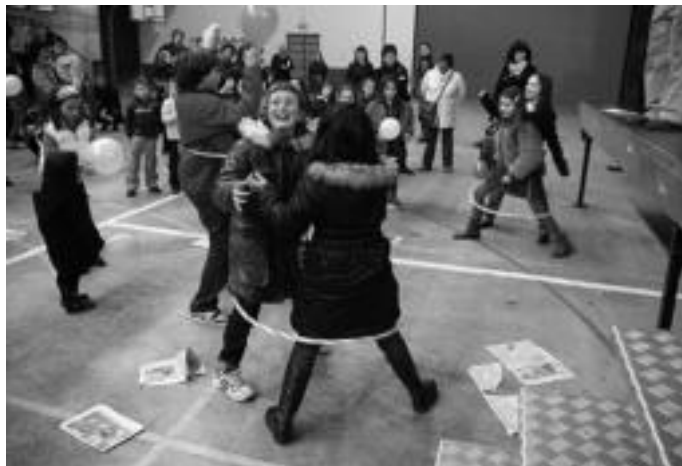
Iruako pilotalekuan Diskoiaian jolastu eta dantzatu zuten hainbat herritarrek. I. GARCIA