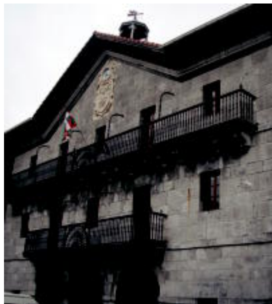
Asteasuko udaletxeak mozioa onartu du. JOXEMI SAIZAR

■ 19:00. Aiztondo bailarako Etxerategiaren, herritarrek eta Udalen deitu dute. Euskal Presoen eskubideen aldeko manifestazioa Villabonako Errebote plaza-tik abiatuko da.