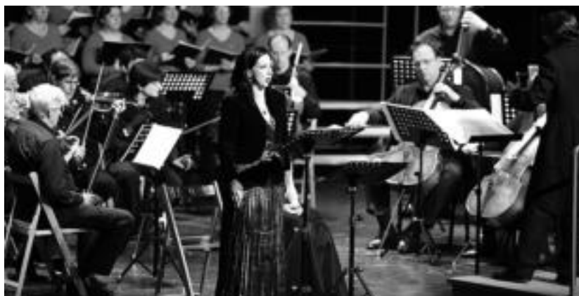
Biharko emanaldia pasa den urtekoa bezain arrakastatsua izatea espero dute.