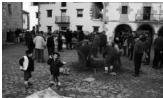
Jende asko izan zen Abaltzisketan larunbatean.

Sorazu herri desberdinetan aritu zen apaiz, baita Berastegin ere 60. hamarkadan, eta horregatik 2008an omenalditoxa egin zioten herrian. Ibarra ere 2007an omenaldia eskaini zioten.