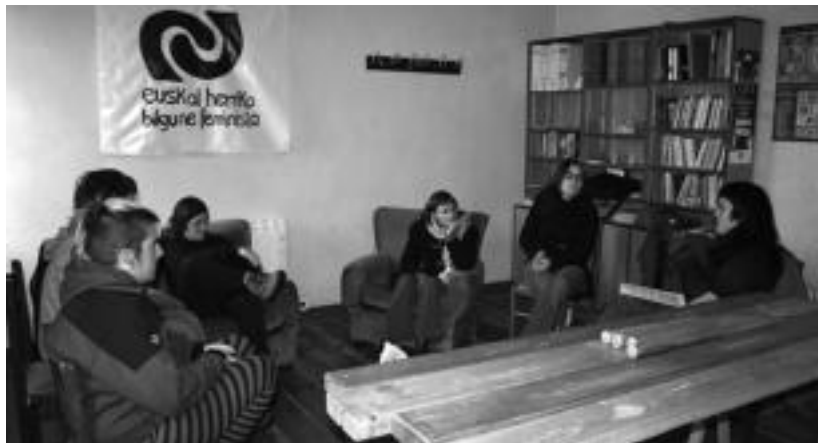
Duela bost urtetatik «herriaren zerbitzura» dago Atekabeltz gaztetxea. A. IMAZ

«Irekia, balioanitzeko eta parte-hartzailea» izatea da Atekabeltz etxearen asmoa. Hori dela