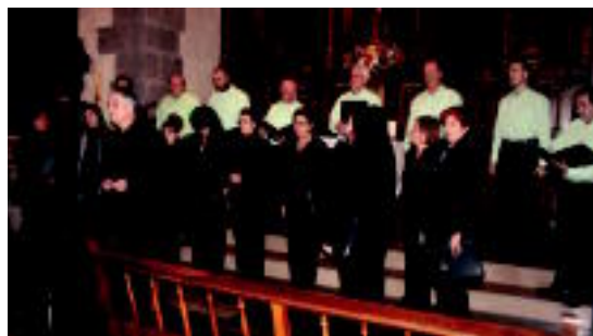
Eresargi abesbatzak 25 urte bete ditu aurten. HITZA

Eresargik, bere aldetik, Gabonetako kantak abestuko ditu eta kontzertuari denen artean emango diote amaiera. Kontzertuan argazki proiektzioa ere egongo da. «Espero dugu honetan ere, momentu hunkigarriki bizitzea bilabonatar guztiekin», gaineratu dute.