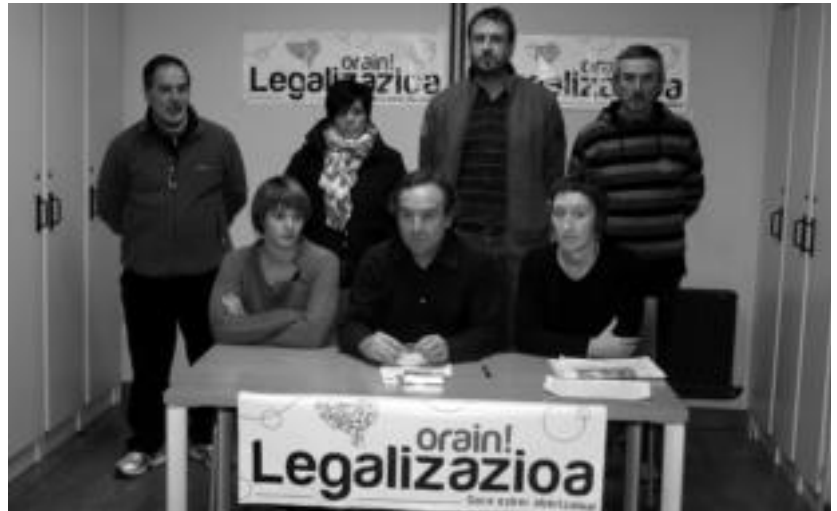
Tolosako Ezker Abertzaleko hainbat kidek herenegun eskaini zuten prentsurrekoak. A. IMAZ

Tolosan Ezker Abertzaleko hainbat kidek prentsurrekoak eskaini zuten herenegun, larunbateko ekitaldietan herritar ororen parte hartzea beharrezkoa dela azaltzeko: «Euskal Herrian egon daitezken sentsibilitate ezkeriar eta abertzaleak elkarlanean aritzeko garaia heldu da. Soilik modu ho-