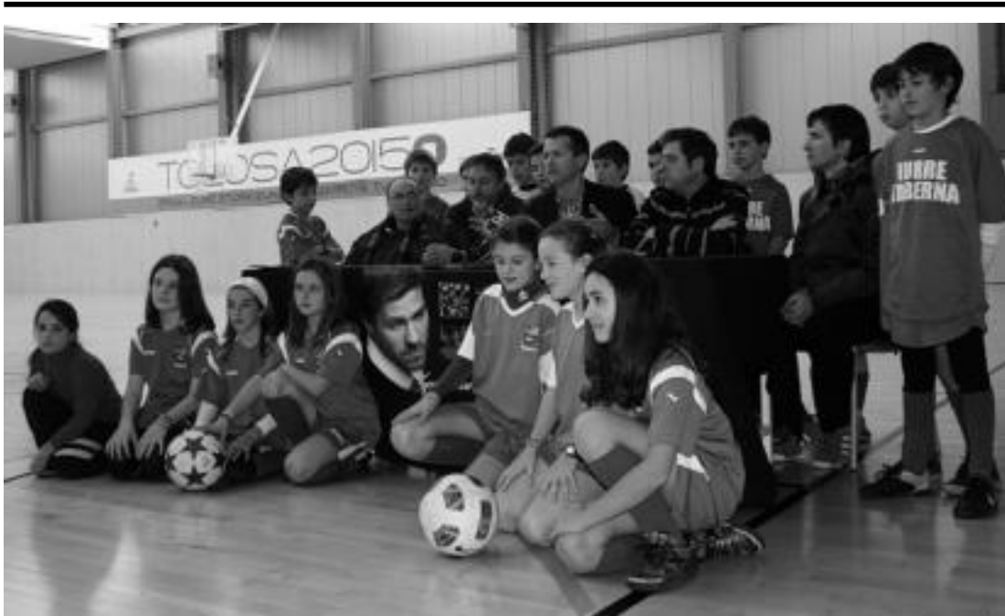
Udaleko ordezkariak omenaldia antolatzen ari diren kideekin eta gaztetxoekin batera, atzo eginiko aurkezpenari. L. TERRADILLOS