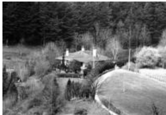
Tunelaren sarrera Gurutzega baserriaren ekialdean joango litzateke.

Handik aurrera, trazatuak norabidea aldatzen du, mendebalderantz egitenaz, Goi-Arri eta Mendi-Alai baserriak iparraldean utziz, eta GI-2631 errepidearekin bat eginez, Olentzoko arean; han egingo da hirugarren biribilgunea.