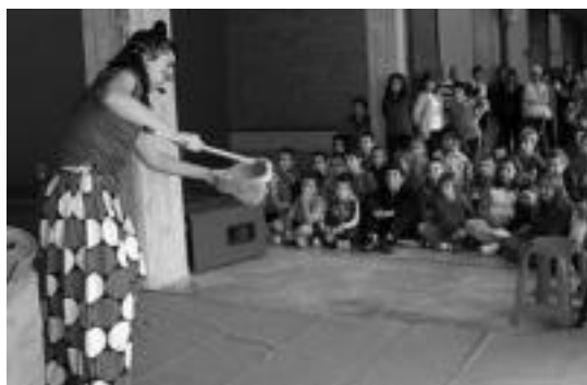
Aresoko haurrak aztoratuko dituzte Pantxika eta Txinpartak. I.T.

Saio honez gain, beste ekitaldi bat ere izango dute asteburu luze