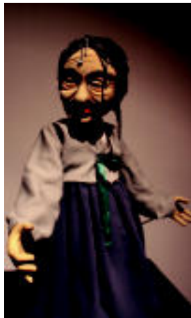
Adaxekin maniatu daitezkeen txotxongilo baten adibidea. it

Txotxongilo tradizionaletik garaikidera bidala Japoniara bidaltzeraz gonbidatzen du erakusketak, haina ez edozein motako bidala, txotxongiloen historiara, hain zuzen. Hain, tradiziozkoenak diren elementuekin hasten da bilbideta. Lehen zati horretan Japoniako