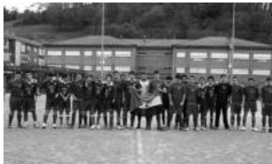
Intxurre eta Euskalduna taldeko jubenilak Saharako banderarekin.

Futbol kontuekin jarraituz, Intxurreko Erregional mailako taldeak Oriokoren aurka denboraldiko bigarren garaipena eskuratu zuen pasatu berri den asteburuan. Alegiako taldeak egun sei puntu ditu eta azkenbigarrena da sailkapenean.