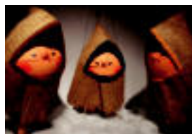
Txotxongilo tradizionalak nahiz berriak, denetarik dago ikusgai. it