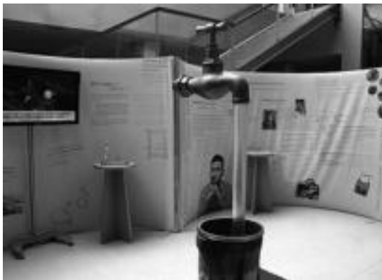
Erakusketa ibiltariaren zati bat kiroldegia harreran dago.

Kiroldegia guztira 9.100 bazkide eta egunero 1.700 erabiltzaile ditu eta lau eremutan sentsibilizatu nahi ditu. Urtean 50 milioi litro ur gastatzen dituzte kiroldegia eta beraz, moderazioz kontsumitzeko eskatzen die. Paperari dagokionez, 581.400 metro paper kontsumitzen ditu. Hondakinengatik, kiroldegia berziklatze puntu bezala identifikatu izatea nahi du eta erabiltzaileei eskatzen die ahal den hondakin gutxiena sortzea bai instalazioaren barruan eta baita kanpoan ere. Energiari dagokionez, urtero 230.000 kw elektrizitatean eta 2,4