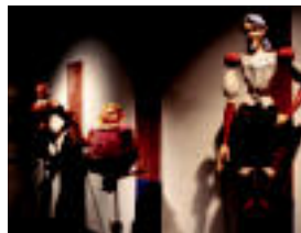
Pertsonaia ezagun ugari ikus daitezke erakusketan. Hiru mosketarien txotxongilo hauekin, esaterako, telesail bat ari diren egiten Japonian. it