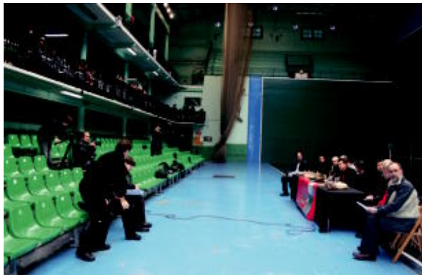
Txotxongilo jaialdira etorritako haurrak lekuko zirela eskaini zuten atzo prentsaurrekoa.

Zesta punta jaialdi batekin emango zaio gaur hasiera Beotibarren 75. urteurrenari. Ospakizunek ordea, hilaren 8ra bitarte iraungo dute eta pilotaren alor ugari uki-