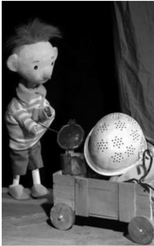
'Ran den mar' lana ikusgai izango da bihar Ibarra. HITZA

Operación AVI-n , beraien lehenengo ikuskizunean, zahartzeaz hitz egin zuten, Txano Gorritxo , Barbantxo eta ipuinetako beste zenbait pertsonaia agure bihurtuta ikusten genituen bitartean. El Rey de la casa , anai-arreben arteko jeloskortasunaz eta boteregoseaz ari zen. Eta OVNIan , familiaz hitz egiten dute, gurasoen maite ez duten neska koskor bat aitzakia hartuta.