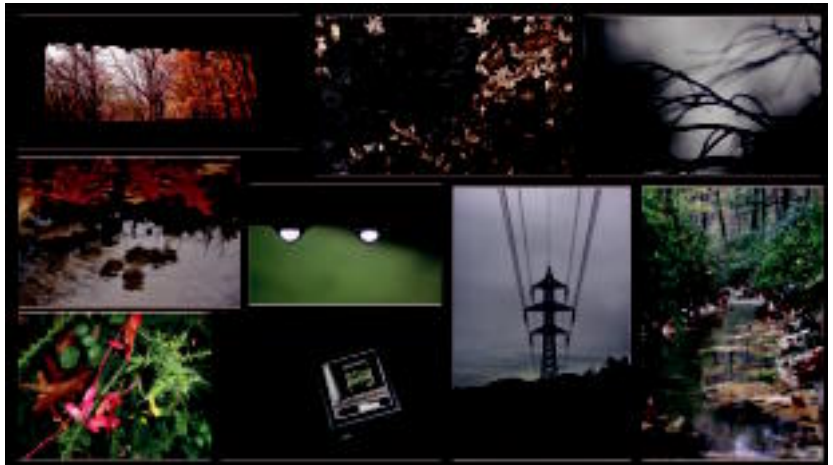
Argazki lehiaketako 40 argazki ikusgai daude Gurean. Zure gustukoena bozkatzeko aukera dago. HITZA

IRTEERA > Aitzondo Zerbitzuen Mankomunitateak antolatuta, abenduaren 13an Zumarragako azokara irteera egingo dute. Santa Luzia eguna ospatuko dute eta arratsaldean Getariatik buelta egingo dute. Izena emateko azken eguna hilaren 29a da. Izena 943 69 39 30 telefonora deituz eman daiteke. Autobusa 08:00etan Larrauldik aterako da eta 8:15ean Alkizan izango da. Jarraian, 08:30ean Zizurkil Goian eta 08:45ean Adunatik pasako da.