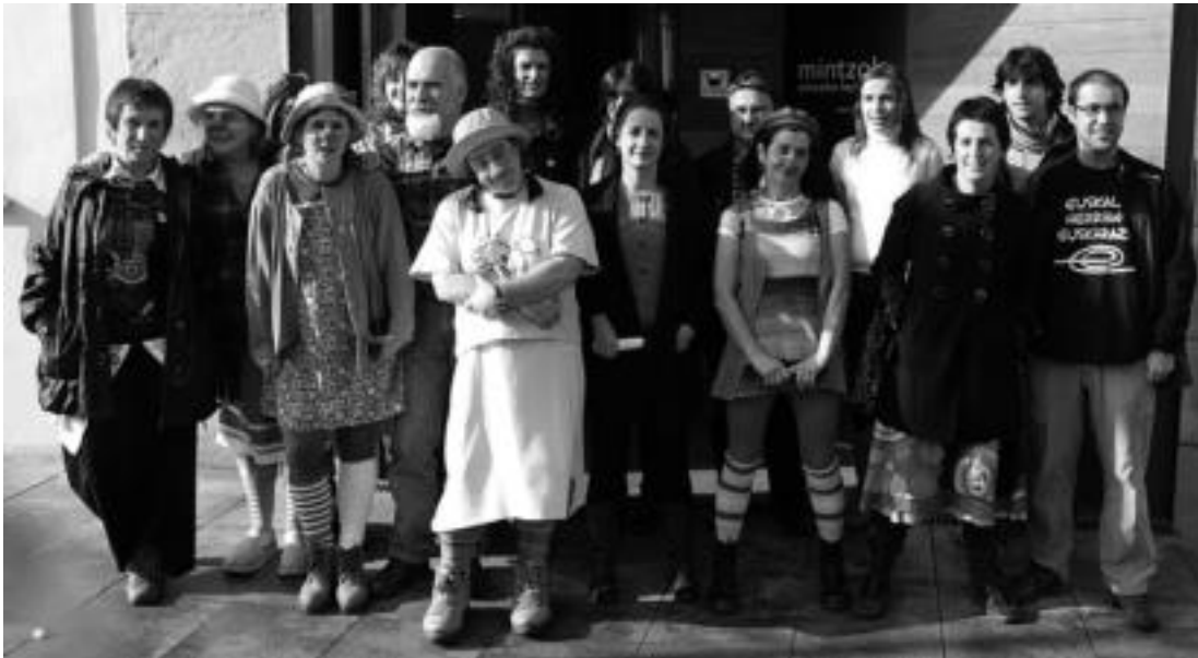
Larunbatean egingo den Antzerkizale Eguna Mintzolan aurkeztu zuten. Ekitaldian pailazoak ere izan ziren. . E.MAIZ