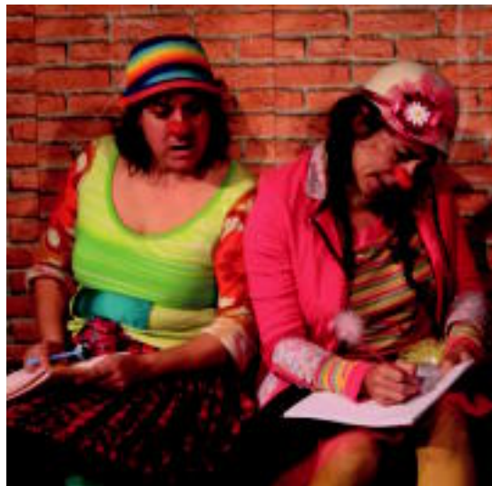
'Zu zeu izan' antzezlaren une bat. HITZA

Antzezlana haurrei hausnarketa eragiteko pentsatuta dago: «Askotan dauzkagun harrema-