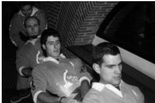
Denboraldian bete bete sartuta daude Ibarra sokatira taldekoak. A.I.

duten pisuaren arabera, indarra eta erresistentzia lantzen dituzte. Ibarra talde berria baina gogorra da. 15 eta 36 urte bitarteko gazteek osatzen dute. Hauek lanerako gogo handia dute, nahiz eta zailtasunak izan. Esaterako, argiarena. Iluntzetan Kiroldegian entrenatzen direnez, pilotalekuko argia piztu nahi baldin bada beraie poltsikotik ordaindu behar dute.