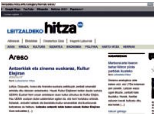
'Tolosaldeko eta Leitzaldeko Hitza'-ren webgune berriak. HITZA

ekin eta jakin beharrekoekin. Aldi berean, webgune nagusiak, tolosaldea.hitza.info hain zuzen ere, azpi sailtako albiste guztiak biltzen ditu.