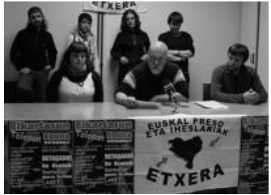
Herenegun Elkartasun Eguna aurkeztu zuteneko unea. I. TERRADILLOS

Antolatzaileen arabera, egoera honek sortzen du elkartasuna, «elkartasunak injustizian baitu sorburua». Hala, diotenez, «espetxe politika anker honen ondorio