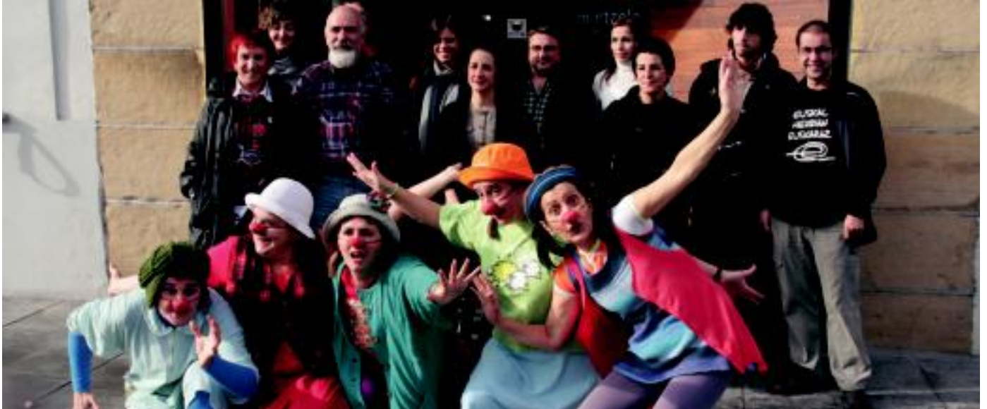
Mintzolan aurkeztu zuten Euskal Herriko Antzerkizale Elkarteko kideek etzi Villabonan izango den Antzerkizale Eguna. E.MAIZ

Osteguna, 2010eko azaroaren 25a. VIII. urtea. 2.129. zenbakia. www.tolosaldea.hitza.info