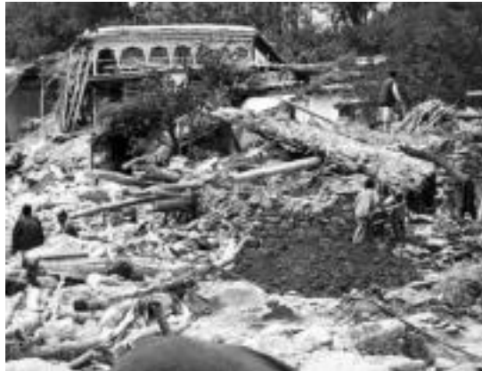
Talis herrian uholdeek 38 etxe suntsitu zituzten. HITZA

Erakusketa hilaren 27a arte bisitatu daiteke Kultur Etxeko ludoetikan. Ordutegia 18:30etik 20:00etara da ostirala arte, eta larunbatean 10:30etik 13:00etara. Bertan Fundazioaren perspektiba historikoa jaso daiteke hainbat panelen bitartez.