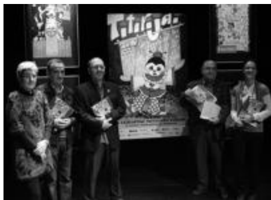
TEEko, Tolosako Udaleko eta Kutzako ordezkariak, atzo, Topic-en. I.T.

● Albiste hau eta Titirijai aurkezpenaren ikus-entzunezkoa: tolosa.hitza.info