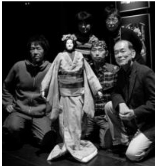
Japoniako lau talde ariko dira aurtengo Titirijai jaialdian.