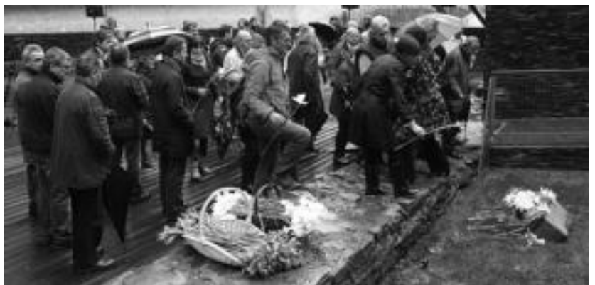
Udaleko ordezkariak eta hainbat herritarrek hartu zuten parte ekitaldian euriari aurre eginez. IÑIGO TERRADILLOS