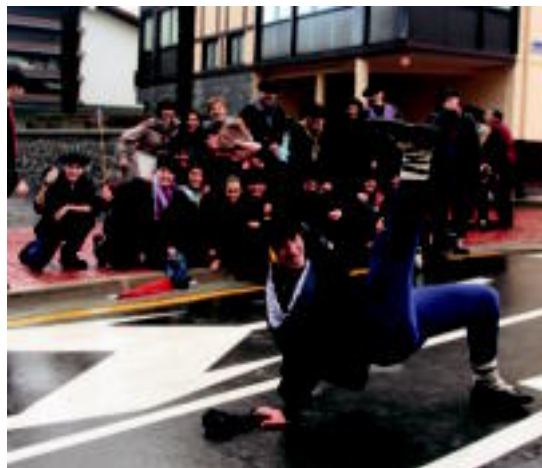
Amasan Gazte Eguna izan zuten atzo, San Martin jaien baitan. E. MAIZ