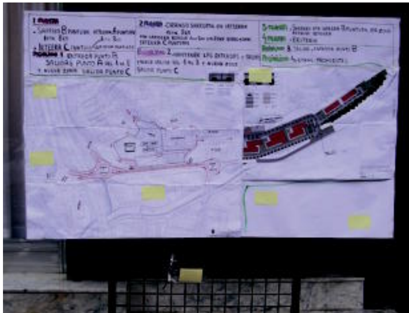
Auzotarrek euren iritzia eman dezaten panelak jarri dituzte Amarotzen. HITZA

Hitza-ko bezeroen arreta zerbitzua (zalantzak argitzeak, harpidedun egiteko): 902 82 02 01