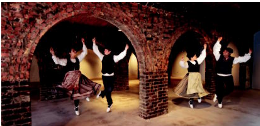
Oinkari dantza taldeko dantzariak, igandetik aurrera erakusketa ikusgai egongo den aljibearen dantzan. HITZA

Hurrengo asteburuan, besteak beste, kantaldia, dantzaldia eta bazkaria izango dira. Igandean Malkar plazan eskainiko dute ikuskizun berria, Dantza zak plazan , non taldeko 40 mutilek dantzatzuko duten. Jarraian, sagardotegira joango dira bazkaltzera.