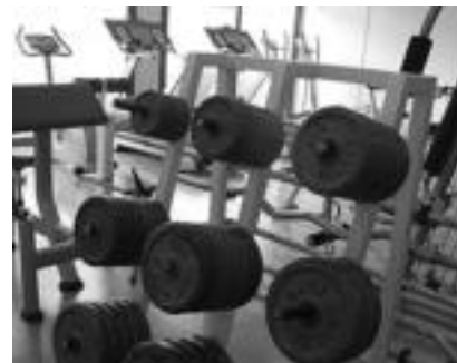
Beirategi handi bat du gimnasio berriak; kirol makinak eta pisuak erabiltzeko makinak mantentzen dira. I.GARCIA