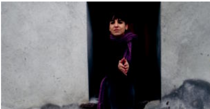
Euskaratzen duen bigarren liburua kaleratu berri dute, 'Fahrenheit 451' izenekoa. I. GOROSTARZU

Jaialdia gaur izango da Tolosako Leidor aretoan 22:00etatik aurrera; nazioarteko zein Euskal Herriko musikariak izango dira taula gainean o3